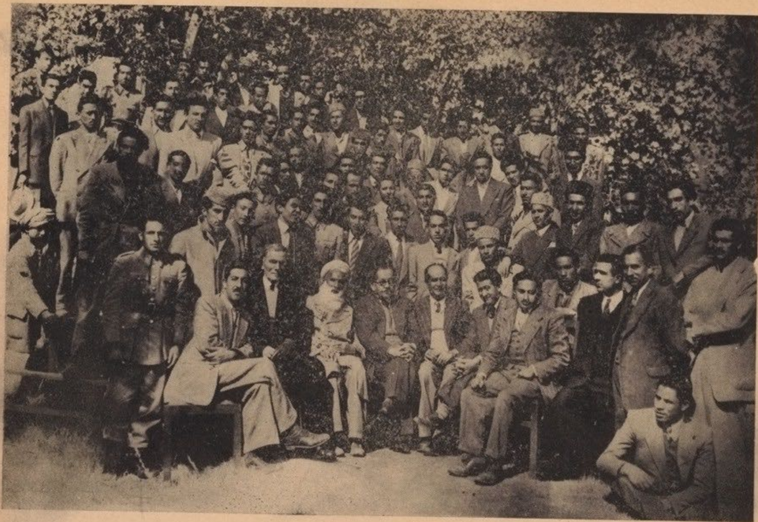
جمعیت استادان و محصلین فاکولتہ ادبیات