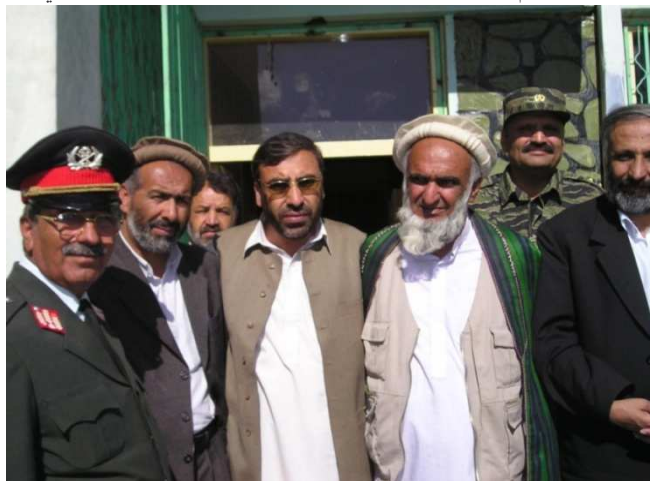
د پکتیا والي اسدالله وفا سره کتنه: د کبېې خوانه امنیه قوماندان جنرال حی گل سلیمانخیل، بناغلی هر یو فضل احمد عظیمي، شاه محمود میاخیل، اسدالله وفا او محمد معصوم ستانکزی (گردیز ښار)