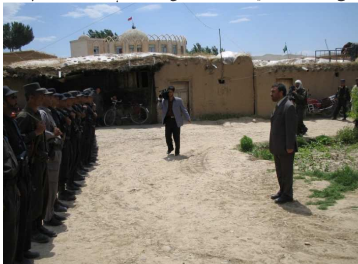
د بلخ ولایت د شولگری ولسوالۍ د پولیسو د قطعي معاینه