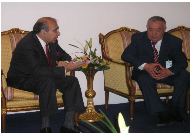
علي احمد جلالی د تاجکستان د کورنیو چارو وزیر سره (دوحه ، قطر)