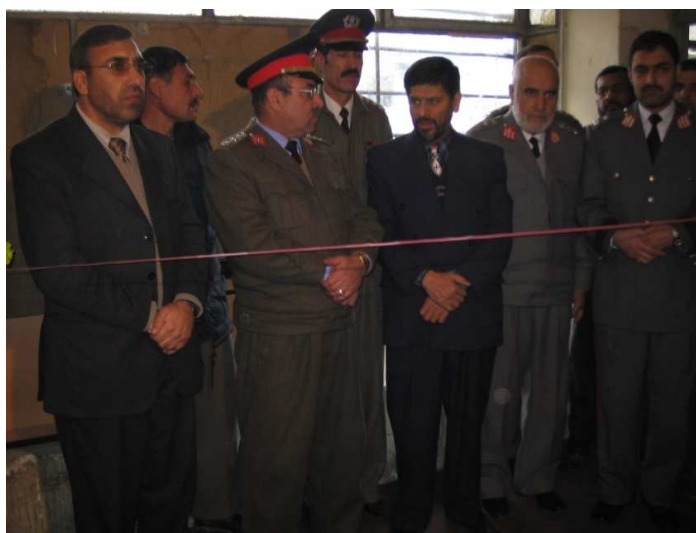
د کورنیو چارو وزارت د پیژنتون د اسنادو د کمپیوټري کولو مراسم: د کښې خوانه شاه محمود میاخیل، جنرال شیراغا روحاني، انجنیر محمد حسیب لطیفی، جنرال سید محمد خان او جنرال محمد ناصر هاشمی