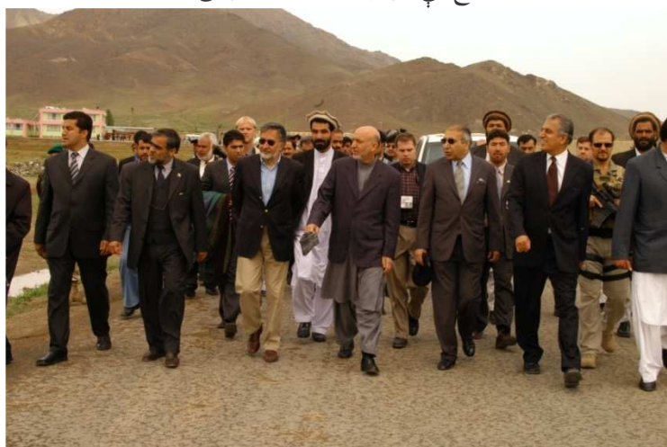
له بني خوا خټه لومړی زلمی خليل زاد ، علي احمد جلالی ، حامد کرزی ، شهزاده مسعود ، زلمی رسول ، محمد یو سف پښتون او ولي منور (لوگر محمد اغه ولسوالي)