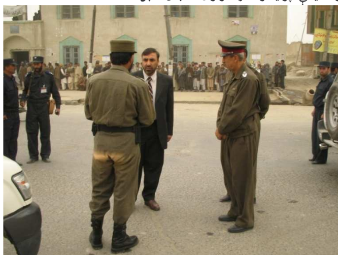
د شاه شهید په سیمه کې د ټاکنو له حوزې څخه کتنه (کابل)