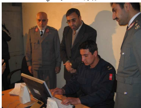
د کورنیو چارو وزارت د پیژنتون د اسنادو د کمپیوټري کولو نه کتنه