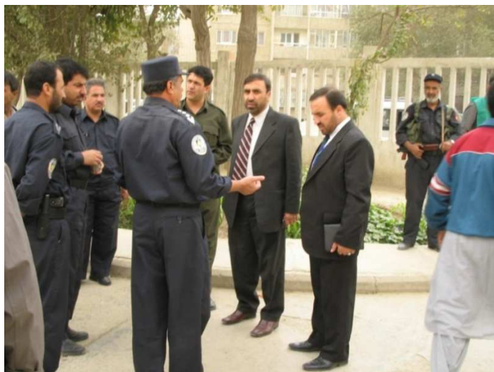
د جمهورۍ ریاست د ټولټاکنو په مهال شاه محمود میاخیل د کورنیو چارو وزارت ویاند لطف الله مشعل او جنرال عبدالمنان فراهی د استقلال لیسې په حوزه کې