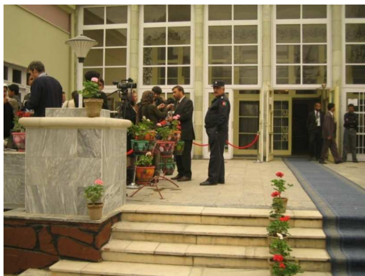
په صدارت کې له رای اچونې وروسته شاه محمود میاخیل له خبریالاتو سره خبرې کوي