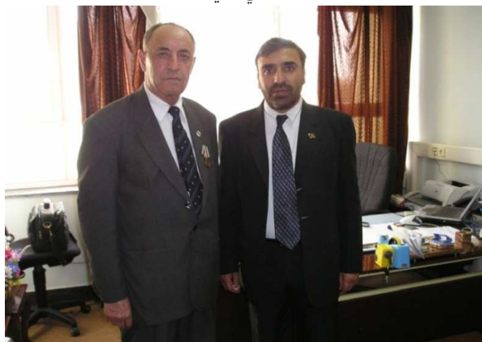
شاه محمود میاخیل د پولیسو د اکاډمۍ د قوماندان ډگر جنرال محمد موسی نعیمی سره (د کورنیو چارو وزارت)