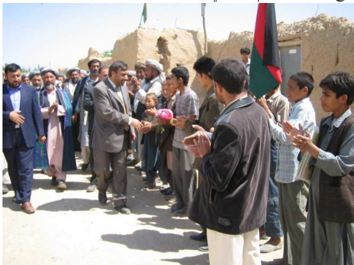
د بلخ ولایت د شولگری ولسوالي د خلکو سره کتنه