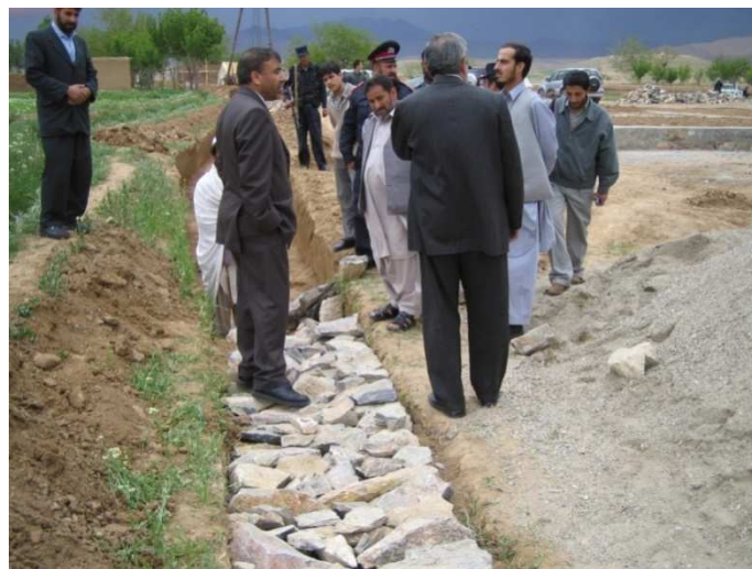
د لوگر ولایت د سرخ اب د انجونو د ښوونځي د کار له بهیر څخه کتنه (لوگر)