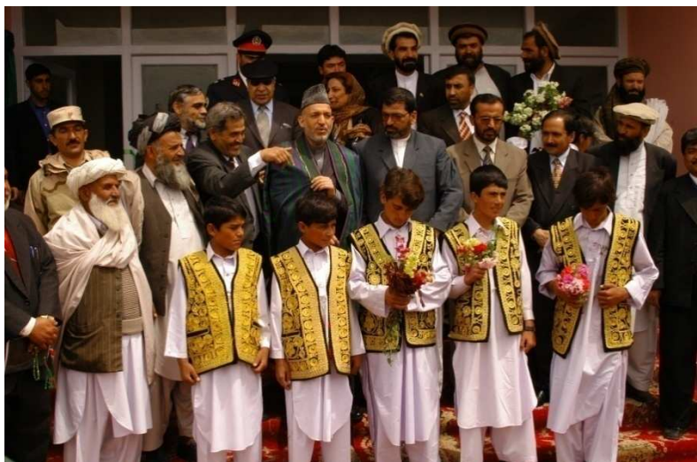
بناغلی حامد کرزی د یو شمیر چارواکو ، قومي مشرانو او دښمنځي زده کوونکو په منځ کې (لوگر محمد اغه ولسوالي)