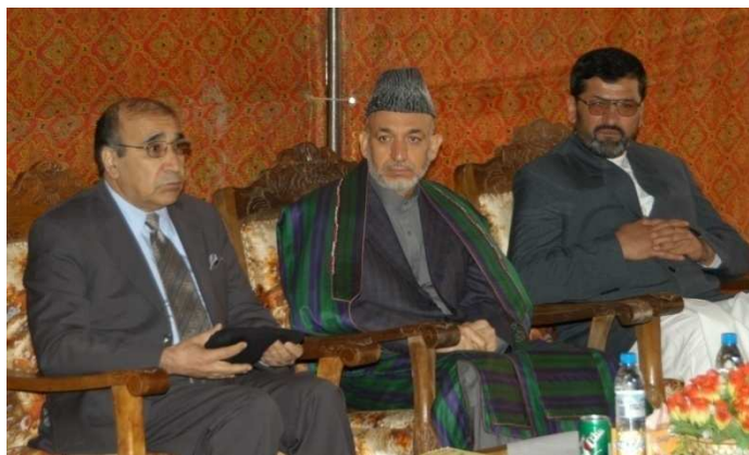
له چپې خوا کورنیو چارو وزیر علي احمد جلالی ، دافغانستان ولسمشر حامد کرزی او د لوگر والي محمد امان حمیمي (لوگر د محمد اغي ولسوالی)