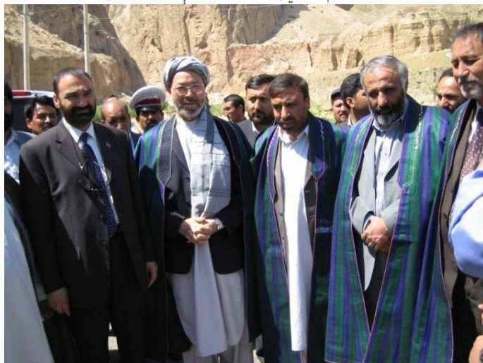
د تاشقرغان په سيمه کې د بلخ والي عطا محمد نور د کابل څخه ورغلي پلاوی سره خدای په