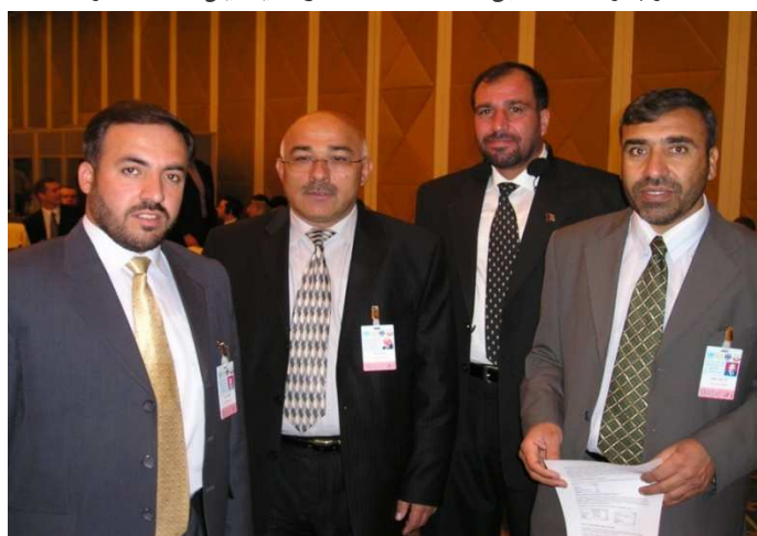
له کینیې خوا نه لطف الله مشعل ، ډگر جنرال هلال الدين هلال ، جنرال عبدالرحمن او شاه محمود میاخیل (دوچه قطر)