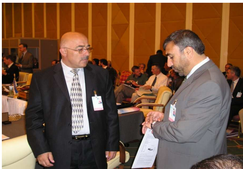
ډگر جنرال هلالدين هلال او شاه محمود میاخیل (دوچه قطر)