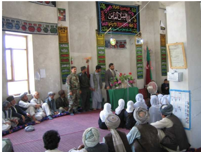
د بلخ ولایت د شولگری ولسوالۍ په جامع جومات کې د خلکو سره خبرې