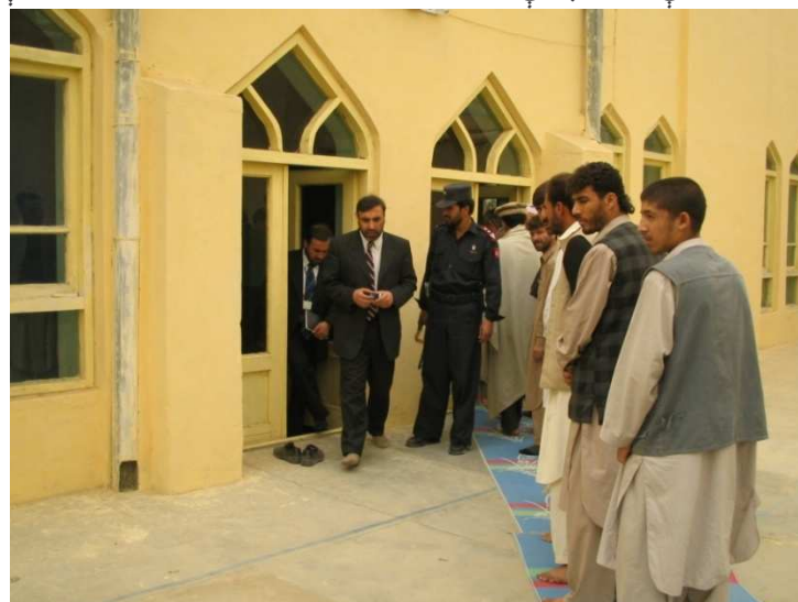
د کارته نو په سیمه کې شاه محمود میاخیل د ټاکنیزې حوزې څخه د کتنې پر مهال