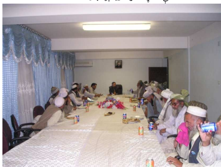
د خاص کنړ د ولسوالۍ د قومي مشرانو سره لیدنه (د کورنیو چارو وزارت)