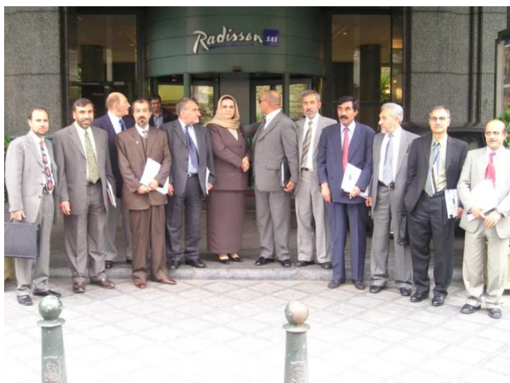
افغاني پلاوی د بلجیم د بروکسل په ښار کې