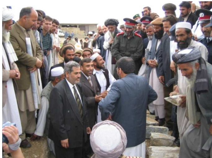
د لوگر ولایت د ودانۍ د بنسټ اېښودلو مراسم (لوگر)