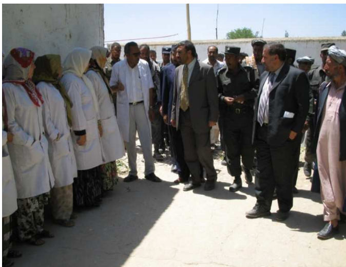
د بلخ ولایت د شولگری ولسوالۍ د صحي کلینک د منسوبینو څخه کتنه