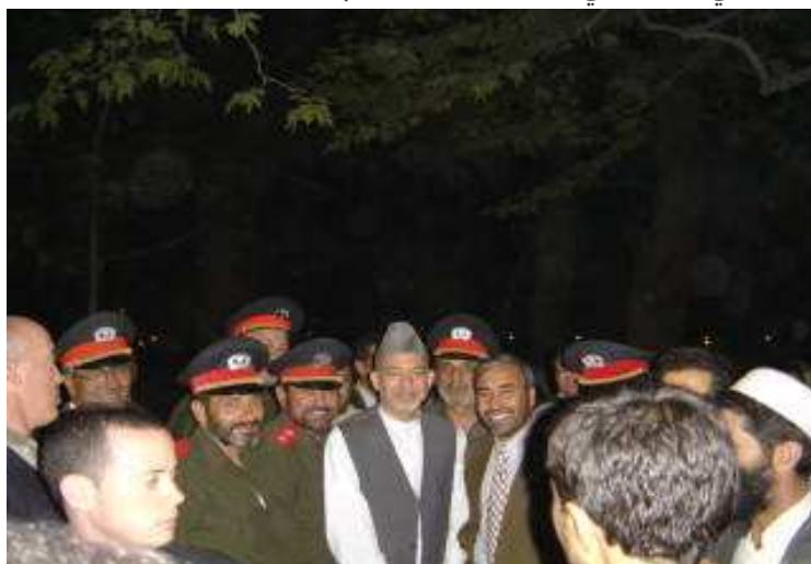
بناغلی حامد کرزی او شاه محمود میاخیل د کورنیو چارو د وزارت د پولیسو د عالی رتبه منصبدارانو سره (دارک مانی)