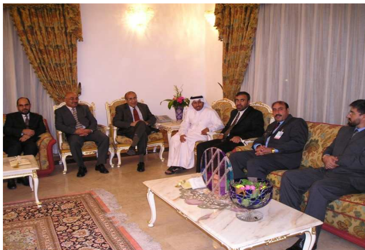
د قطر شیخ حسن له خوا په جوړه شوي میلستیا کې بناغلی علي احمد جلالی او ورسره پلاوی د کین خوا څخه په قطر کې د افغانستان سفیر ، ډگر جنرال هلال الدین هلال ، علي احمد جلالی ، شیخ حسن ، شاه محمود میاخیل ، ډگر جنرال عبدالجمیل جنبش او ډگر جنرال صبغت الله صایق (دوچه قطر)