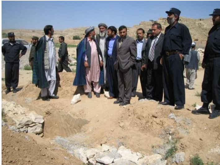
د بلخ ولایت د شولگری ولسوالي د ودانۍ د کار له بهیر څخه لیدنه