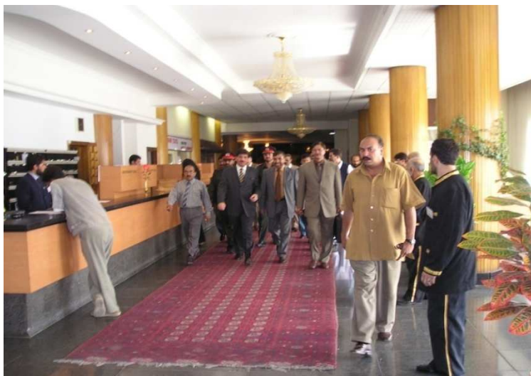
د پاکستان د کورنیو چارو وزیر فیصل صالح حیات او شاه محمود میاخیل (کابل انټر کانتیننټل هوټل)