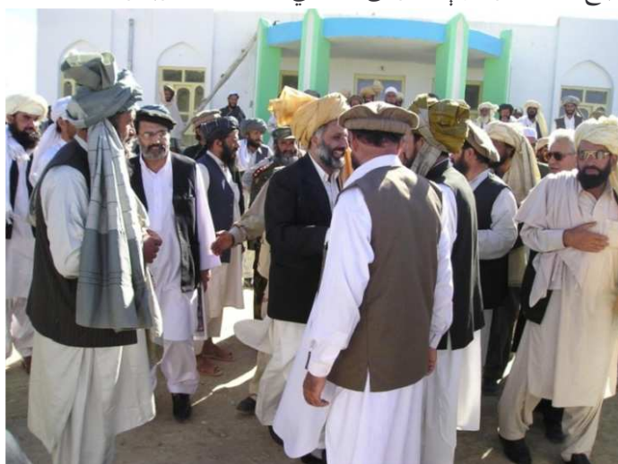
د پکتیا ولایت له قومي مشرانو سره کتنه ، په عکس کې دمخابراتو وزیر محمد معصوم ستانکزی او د کورنیو چارو وزارت سلاکار معین مرستیال هم لیدل کیږي