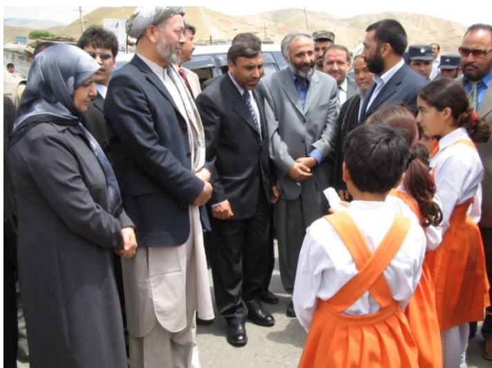
شمالی ولایتو ته کاري سفر د کینې خوا نه اعلیٰ امنه افضلې ، د ولسمشر مرستیال محمد کریم خلیلي ، شاه محمود میاخیل ، نناغلی معصوم ستانکزی او نناغلی جمعه خان همدرد