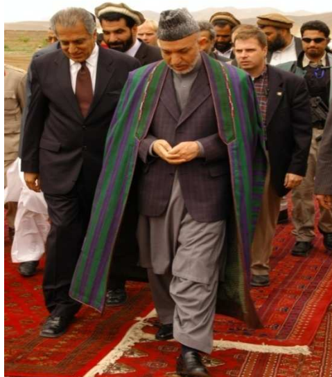
ولسمشر حامد کرزی او دامریکا سفیر زلمی خلیل زاد