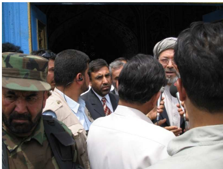
دولسمشر مرستیال محمد کریم خلیلي په مزار شریف کې د خبریالاتو پوښتنو ته ځواب وايي