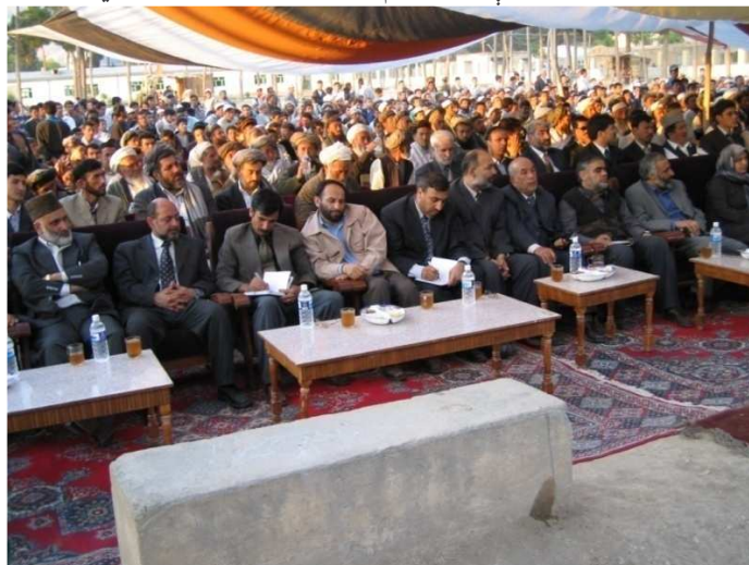
د شمال دکاري سفر په ترڅ کې په ایبکو ښار کې په هغه غونډه کې گډون چې د کابل څخه د ورغلي پلاوی لپاره جوړه شوې وه