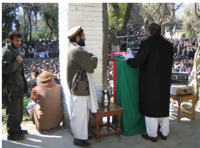
شاه محمود میاخیل د کنړ نوي والي اسدالله وفا د معرفي کیدو لویه مراسمو کې د کنړ خلکو ته وینا پر مهال