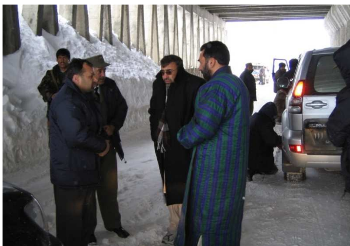
بغلان ته دنوي والي جمعہ خان همدر د معرفي کولو لپاره تڼي او په سالنگونو کې د زیاتو واورو وړیدو له امله ودریدل