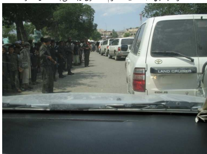
شمالی ولایتونو ته د کاري سفر د موټرو د کاروان یوه بیلگه