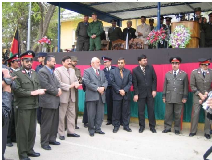
د پولیسو دفراغت او شهادتنامو د ویشلو مراسم د بنې خوانه ډگر جنرال نورالله خل ، ډگر جنرال شیرآغا روحانی ، امنیتي معین بناغلی ضرار احمد مقبل ، شاه محمود میاخیل ، ډگر جنرال سید محمد خان ، تورن جنرال سید کمال سادات او ډگر جنرال صبغت الله صایق