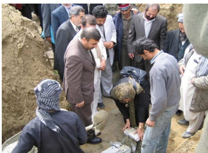
شاه محمود میاخیل او ترڅنګ یې د کابل والي بناغلی سید حسین انوري او قومي مشران د کابل د استالف ولسوالۍ د تعمیر د بنسټ د ډبرې د ایښودلو په حال کې