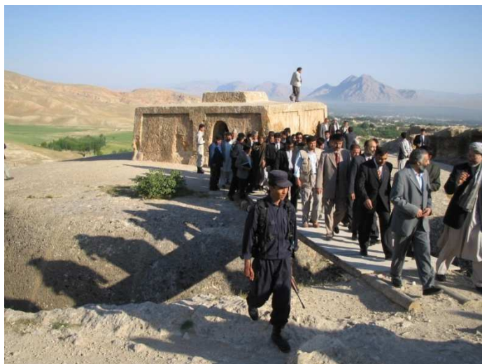
دولسمشر مرستیال محمد کریم خلیلی او ورسره پلاوی په ایبکو کې د تخت رستم څخه د لیدلو پر مهال