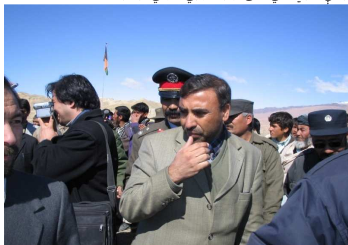
شاه محمود میاخیل په بامیانو کې د قومي مشرانو او د کورنیو چارو وزارت د منسویینو په منځ کې (بامیان)