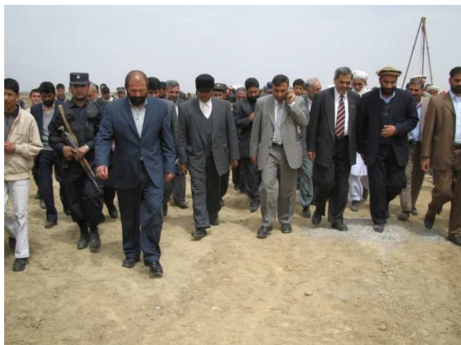
د کابل د کلکانو ولسوالۍ دنوې ودانۍ د بنسټ اېښودنې مراسم شاه محمود میاخیل د کابل والي انوري اونور قومي او دولتي مشرانوسره (کابل کلکان)