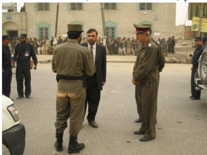
د شاه شهید په سیمه کې د ټاکنو له حوزې څخه کتنه (کابل)