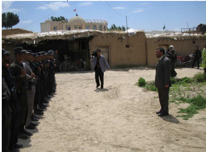
د بلخ ولایت د شولگری ولسوالۍ د پولیسو د قطعي معاینه