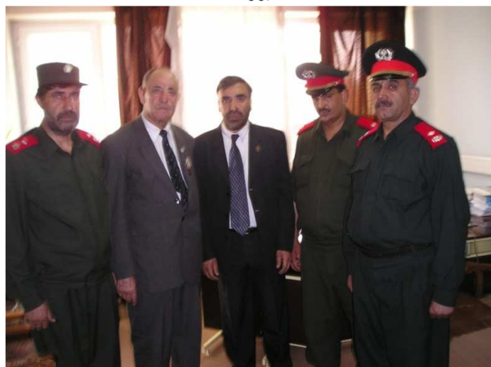
د کینډي خوا نه جنرال محمد شفیق فضلي، جنرال نعیمی، شاه محمود میاخیل، جنرال مطیع الله او جنرال محمد حبیب ناصري (د کورنیو چارو وزارت)