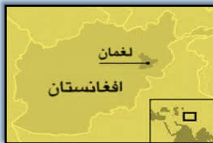
تصویر: از دریای الینگار