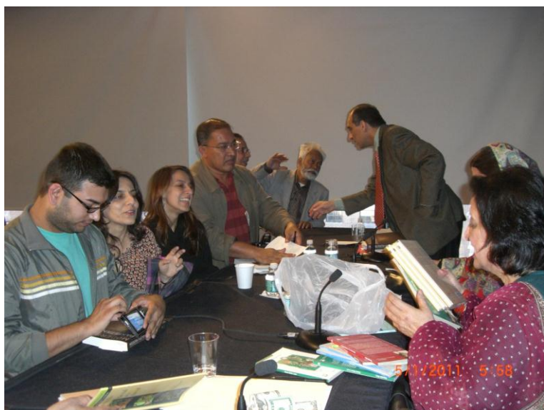
د فهمیده ریاض د کتابونو خرڅېدل