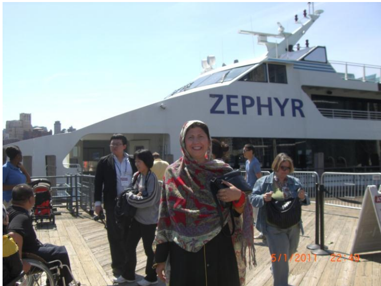
یو بل عکس