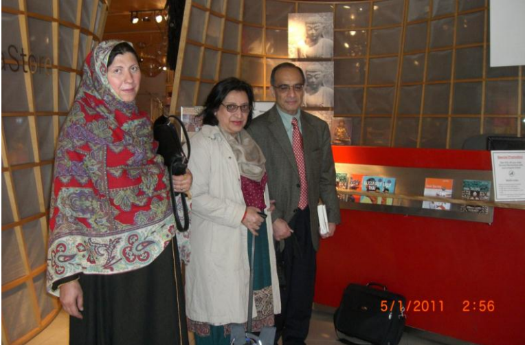
په نیو یارک کي د دستوري نه مخکي