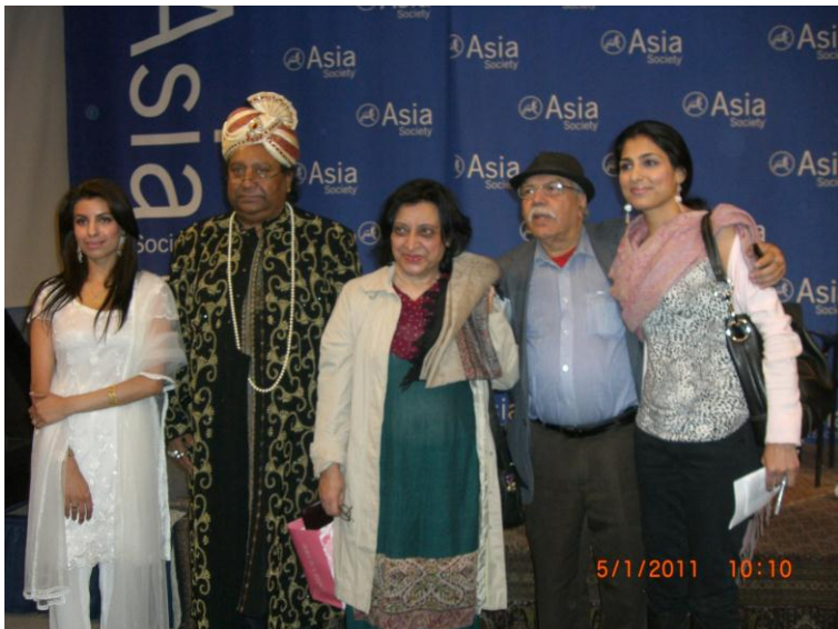
په نیو یارک کې د اردو ژبې له لیکوالو سره