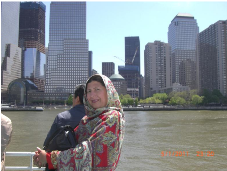
د بنار يو بل منظر د سمندر نه