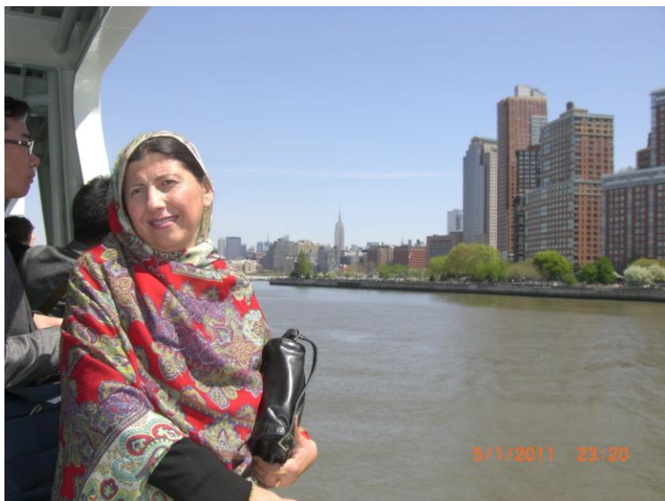
د سمندر چکر د بلی غاری سفر