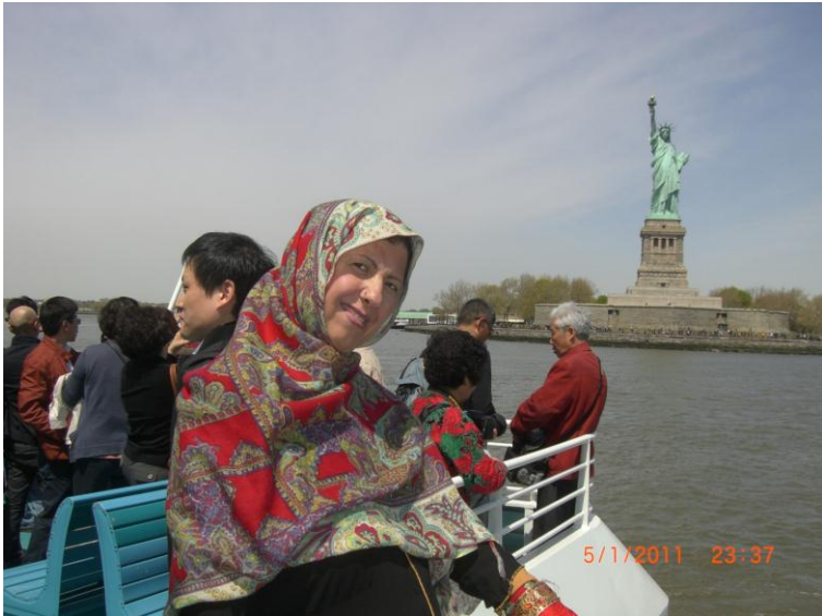
د اخري منزل يو بل عكس