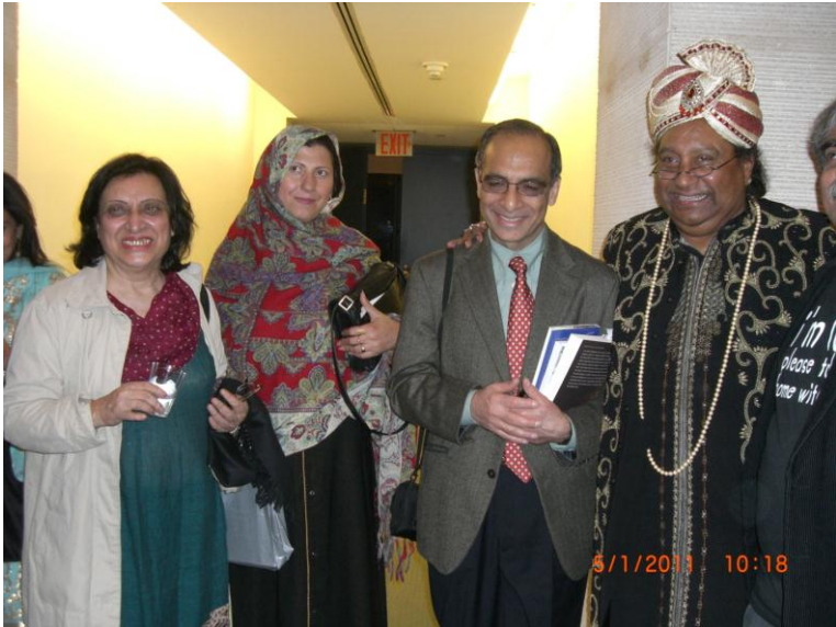
هم ددي وخت يو بل عكس