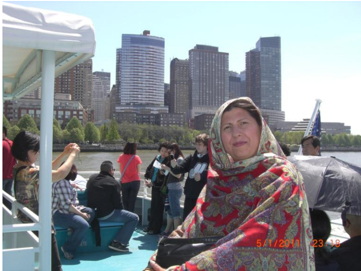
راغلي سيلگر، او زه