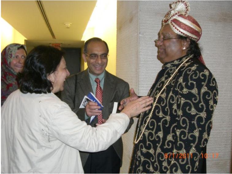
افتخار نسيم وقاص خواجه فهميده رياض او حسينه گل د دستوري نه پس