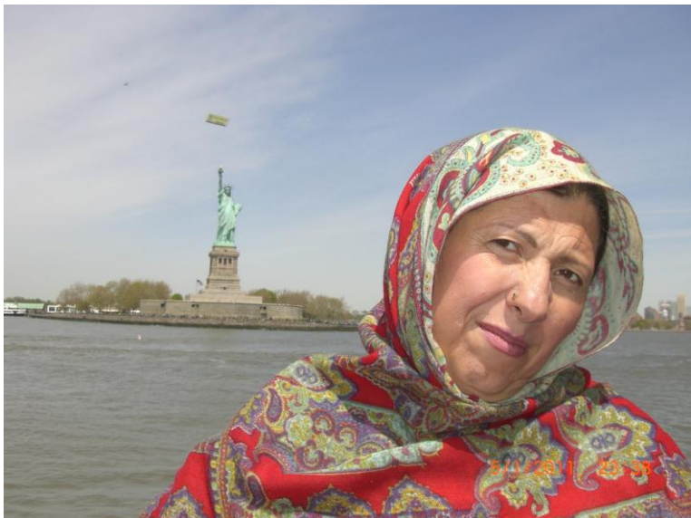
د سمندر غاړه نيو پارک