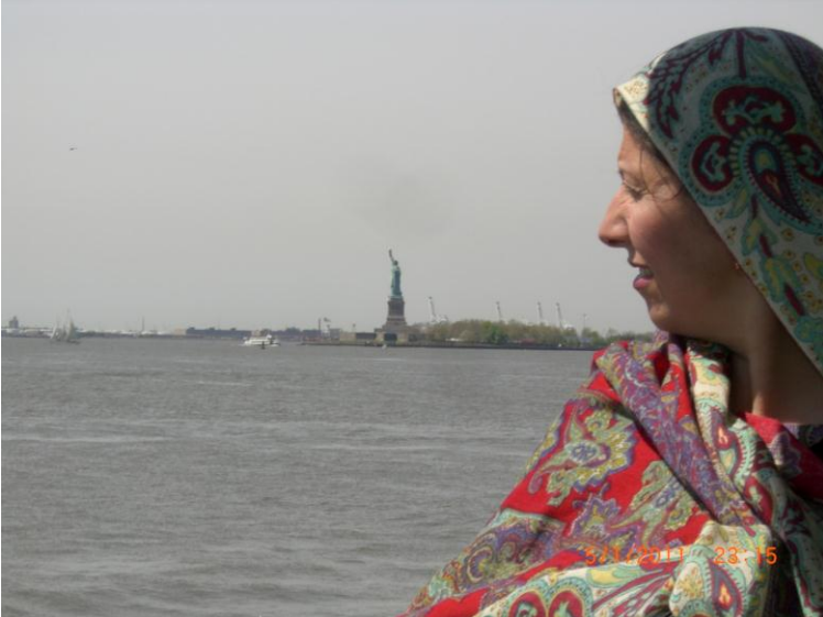
يو بل عکس د سمندر د غاړې