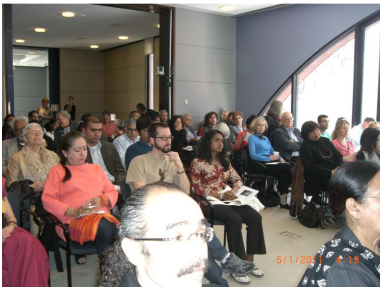
د نیو یارک د دستوري یو بل عکس