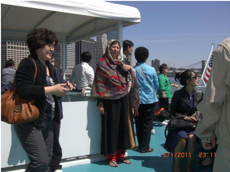
د نیویارک د بنسار ننداره د کشتی د اخري منزل نه