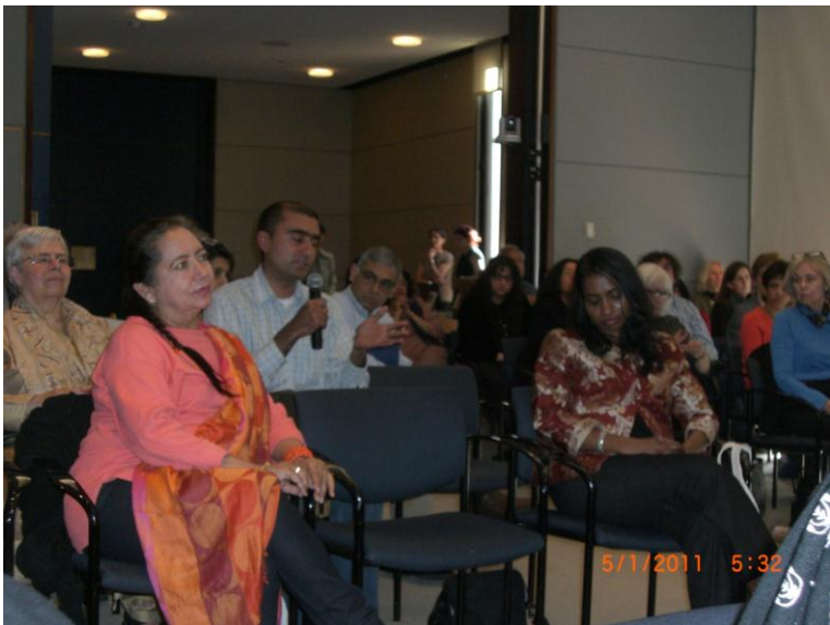
د غونډې نور گډونوال د پوښتنو پر مهال