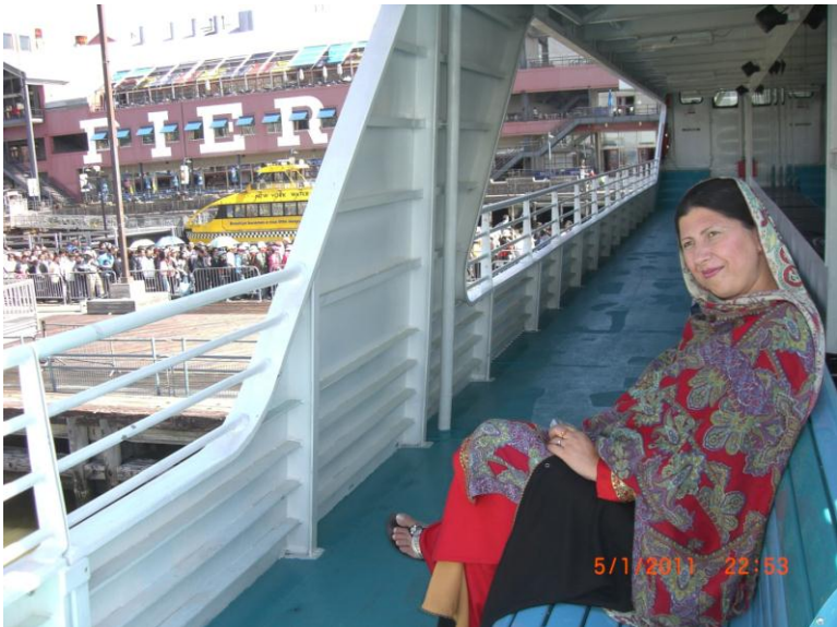
د کبنتی په اخري منزل کی د ناستی پر مهال