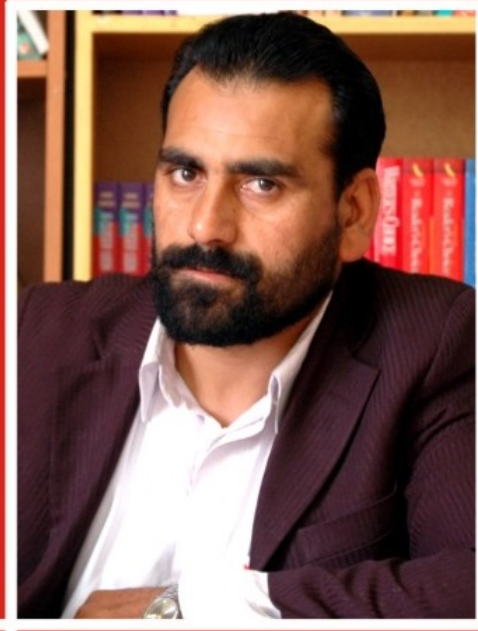
قاضي محمد حسن حقيار