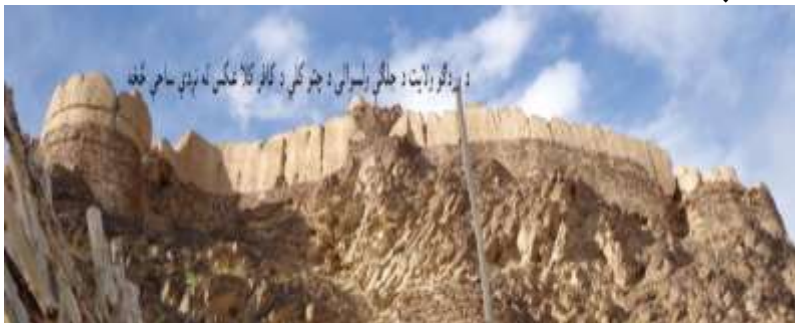
عکاس: محسنسيم رسا د اطلاعاتو او فرهنگ رياست د فرهنگي ميراثونو د ساتنې مدير

وټاکي، دا چې خلک ورته د کافر کلا نوم کاروي بنایي علت يې دا وي چې د اسلامي دين له را تگ څخه وړاندې ودانه شوې وي دا کافر کلا د يوې لويې نظامي اډې بڼه لري چې د لوړې او خطرناکې غونډې پر سر داسې قوي او لوی لوی دېوالونه راتاو شوي په نوموړو دېوالونو کې لوی لوی برجونه د نظامي پوستو په شان ودان شوي دي چې په ليدو يې خلک هېرانېږي.