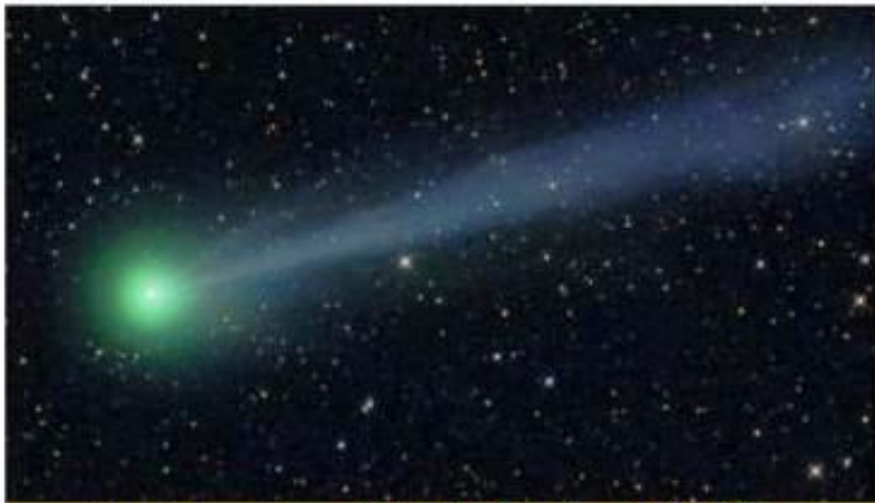
« وَالنَّجْمِ إِذَا هَوَىٰ * مَا ضَلَّ صَاحِبُكُمْ وَمَا غَوَىٰ . » (النجم، ۵۳ / ۱ - ۲)