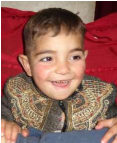
ڀالي ڪوچني ومان ته