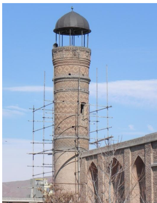
عکس بالا مربوط به مناره سمت چپ بنا می باشد

رسامی بالا به هیچ وجه نمی تواند از روی کنونی تهیه شده باشد چون تفاوت زیادی با وضع فعلی دارد . شاید مربوط به قبل از تخریب مسجد توسط عثمانی های مسلمان باشد ! شاید هم مربوط به قبل از زلزله سال 1193 ه باشد ! شاید هم مربوط به قبل از بازسازی به وسیله مترجم کنسولگری شوروی باشد ! در این چند ساله فقط این موضوع را خوانده بودیم که مترجم مرمت کار بنا یا معمار باشد ! البته اینجا ایران است و هر اتفاقی ممکن است پیش بیاید .