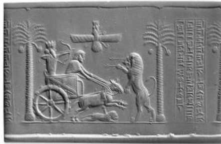
مهر مشکوک داریوش هخامنشی

مُهر استوانه‌ای عقیق و مشهور و سالم داریوش هخامنشی دقیقاً در چنین شرایط محیرالعقولی در مصر پیدا شده است. شرایطی که علاوه بر همه عجیب و غریب بودن‌هایش، حتی شخص کاشف و محل کشف آن نیز ناشناخته و مجهول مانده و هیچگونه اطلاعات دقیقی از جزئیات آن داده نشده است. در عموم کتاب‌ها و نیز در وبسایت موزه بریتانیا (محل نگهداری این مهر) چنین آمده که: «گفته شده در یک مقبره در ناحیه تیس در مصر پیدا شده است». اما بیان نشده که این حرف را چه کسی گفته؟ چه کسی آنرا کشف کرده و در کدام مقبره و در کجای آن مقبره و در طی کدام عملیات کاوش؟ و چرا هیچگونه اطلاعاتی در این باره عرضه نشده و چنین خواسته‌اند تا همگان کورکورانه و به صرف اعتماد بیجا به اشخاص و نهادها و موزه‌ها این ادعاها را بپذیرند؟