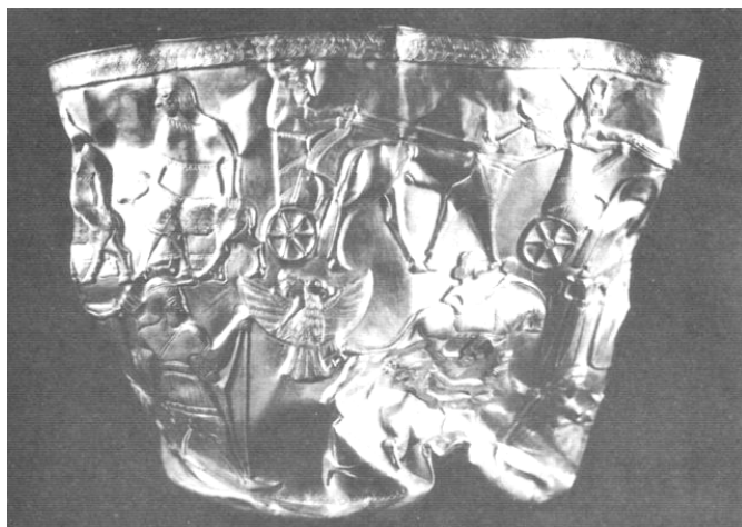
جام طلائی تقلبی منسوب به تپه حسنلو، نقده

نگارنده بر این گمان است که دست مرموزی پشت چنین اخباری خوابیده است. دستی که همچون دست «دوست‌نما» و سفیدشده گرگ در فکر حمله به فرهنگ و تمدن کشوری است که همچون بره‌ای بینوا از مادر به دور افتاده است. و همچنین دست‌های فروشندگان آثار عتیقه قلابی که سعی می‌کنند با همراه کردن عکس اشیای موردنظر خود در دل اینگونه اخبار، بازار بهتری برای خود دست و پا کنند.