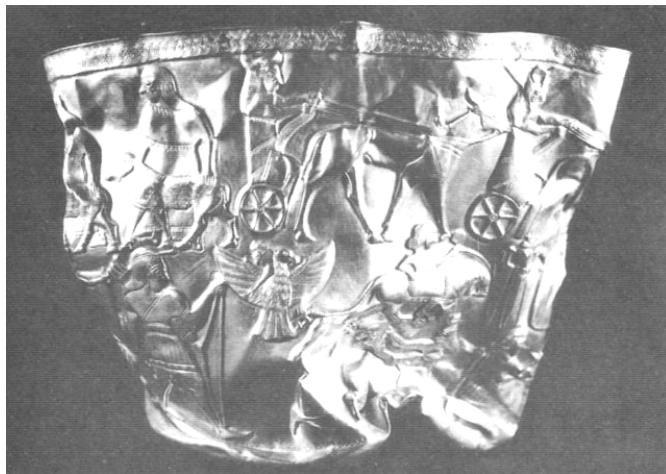
جام طلائی تقلبی منسوب به تپه حسنلو، نقده

نگارنده بر این گمان است که دست مرموزی پشت چنین اخباری خوابیده است. دستی که همچون دست «دوست‌نما» و سفیدشده گرگ در فکر حمله به فرهنگ و تمدن کشوری است که همچون بره‌ای بینوا از مادر به دور افتاده است. و همچنین دست‌های فروشندگان آثار عتیقه قلابی که سعی می‌کنند با همراه کردن عکس اشیای موردنظر خود در دل اینگونه اخبار، بازار بهتری برای خود دست و پا کنند.