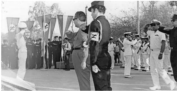
تجمع شائبه برانگیز حزب پان ایرانیست در آبادان

سخن می‌گویند». همانطور که عده دیگری نیز بجای «ترک» و «زبان ترکی» از لفظ «آذری» و «زبان آذری» استفاده می‌کنند که معنا و مفهومی بکلی متفاوت دارند. در حقوق بین‌الملل امروز و در تعاریف نژادپرستی و تبعیض نژادی، به اینگونه سخنان و رویکردها «هویت‌زدایی» می‌گویند و آنرا مصداق «جنایت علیه بشریت» بشمار می‌آورند.