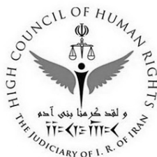
قوه قضائیه جمهوری اسلامی ایران ستاد حقوق بشر