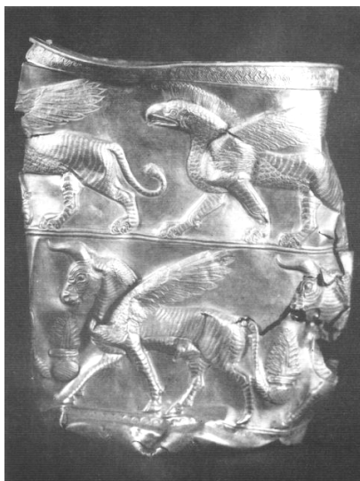
یکی از جام‌های طلایی تقلبی منسوب به چراغعلی‌تپه (با نام ساختگی مارلیک)، رودبار گیلان

دروغین و تاریخ‌سازان و نشریاتی که واقعیت‌ها را فدای جلب توجه مخاطب می‌کنند، می‌سازند و می‌پرورند.