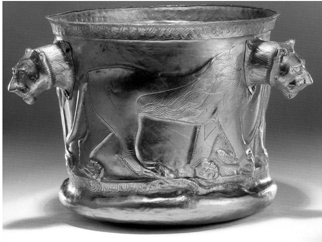
جام طلائی تقلبی منتسب به کلاردشت مازندران

تقلبی کشف بقایای ارتش کمبوجیه در مصر) چگونه حیثیت ما و باستان‌شناسی ما را مضحکه و مسخره جهانیان می‌کند؟ آیا می‌دانند که همگان ما را به چشم موجودات حقیر و نیازمند توجهی می‌نگرند که داشته‌های اصیل و گرانقدر خود را رها کرده و به دنبال موهومات افتاده‌اند؟