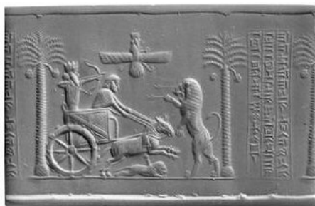
مهر مشکوک داریوش هخامنشی

مُهر استوانه‌ای عقیق و مشهور و سالم داریوش هخامنشی دقیقاً در چنین شرایط محیرالعقولی در مصر پیدا شده است. شرایطی که علاوه بر همه عجیب و غریب بودن‌هایش، حتی شخص کاشف و محل کشف آن نیز ناشناخته و مجهول مانده و هیچگونه اطلاعات دقیقی از جزئیات آن داده نشده است. در عموم کتاب‌ها و نیز در وبسایت موزه بریتانیا (محل نگهداری این مهر) چنین آمده که: «گفته شده در یک مقبره در ناحیه تیس در مصر پیدا شده است». اما بیان نشده که این حرف را چه کسی گفته؟ چه کسی آنرا کشف کرده و در کدام مقبره و در کجای آن مقبره و در طی کدام عملیات کاوش؟ و چرا هیچگونه اطلاعاتی در این باره عرضه نشده و چنین خواسته‌اند تا همگان کورکورانه و به صرف اعتماد بیجا به اشخاص و نهادها و موزه‌ها این ادعاها را بپذیرند؟