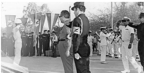
تجمع شائبه برانگیز حزب پان ایرانیست در آبادان

سخن می‌گویند». همانطور که عده دیگری نیز بجای «ترک» و «زبان ترکی» از لفظ «آذری» و «زبان آذری» استفاده می‌کنند که معنا و مفهومی بکلی متفاوت دارند. در حقوق بین‌الملل امروز و در تعاریف نژادپرستی و تبعیض نژادی، به اینگونه سخنان و رویکردها «هویت‌زدایی» می‌گویند و آنرا مصداق «جنایت علیه بشریت» بشمار می‌آورند.