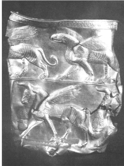
یکی از جام‌های طلایی تقلبی منسوب به چراغعلی‌تپه (با نام ساختگی مارلیک)، رودبار گیلان

دروغین و تاریخ‌سازان و نشریاتی که واقعیت‌ها را فدای جلب توجه مخاطب می‌کنند، می‌سازند و می‌پرورند.