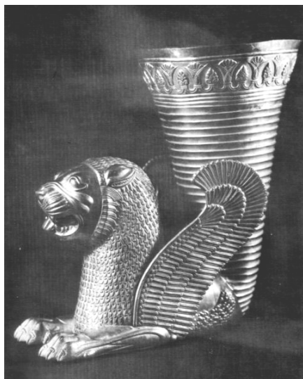
ساغر/ ریتون تقلبی منسوب به خشیارشا و عصر هخامنشی (آرم فعلی بانک پاسارگاد)

مفیدی برای خود تبدیل کنند. گسترش چنین شیوه‌ای می‌تواند به مرور زمان آسیب‌هایی جدی به آیین و فرهنگ ایرانی وارد کند.