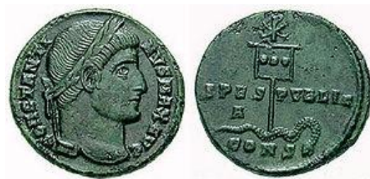
تصویر ۴. نقش لا باروم در پشت سکه‌ی کنستانتین اول

تصویر ۳. تابوتی از قرن چهارم میلادی با نمادهای مسیحی. نشانه‌ی داخل حلقه‌ی گل با یک خط تیره‌ی قائم I (حرف اول Ιησούς=عیسی در زبان یونانی) و نماد شبیه X (نماینده‌ی حرف یونانی خی، حرف اول Χριστος=مسیح در زبان یونانی) ایجاد شده است.