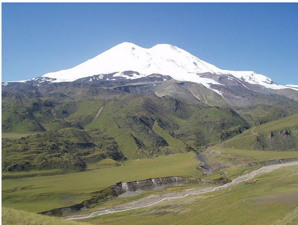
تصویر ۵. کوه البروس