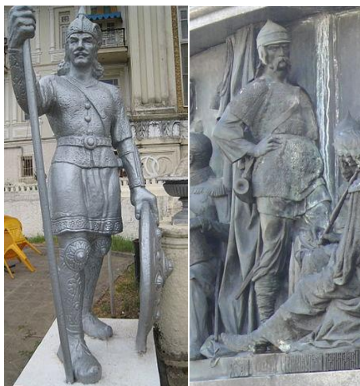
تصویر ۶. از راست به چپ، مجسمه‌ی شاهزاده سویاتوسلاو Sviatoslav در نووگراد و مجسمه‌ی اسفندیار در رامسر

https://upload.wikimedia.org/wikipedia/commons/3/35/%D0%A1%D0%B2%D1%8F%D1%82%D0%BE%D1%81%D0%BB%D0%B0%D0%B2_%D0%86%D0%B3%D0%BE%D1%80%D0%B5%D0%B2%D0%B8%D1%87_%E2%80%94%D0%BC%D0%BE%D0%BD%D0%B5%D1%82%D0%B0.jpg