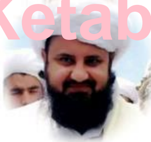
فیسوک غلام حضرت غلام