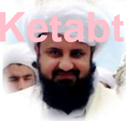
فيسبوك غلام حضرت غلام