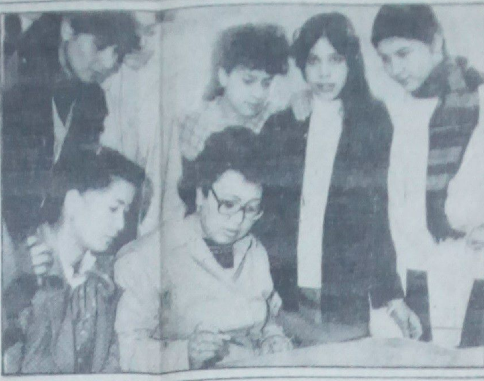
دو سطرې سياسي کليمنه... د دو سطرې سياسي کليمنه...