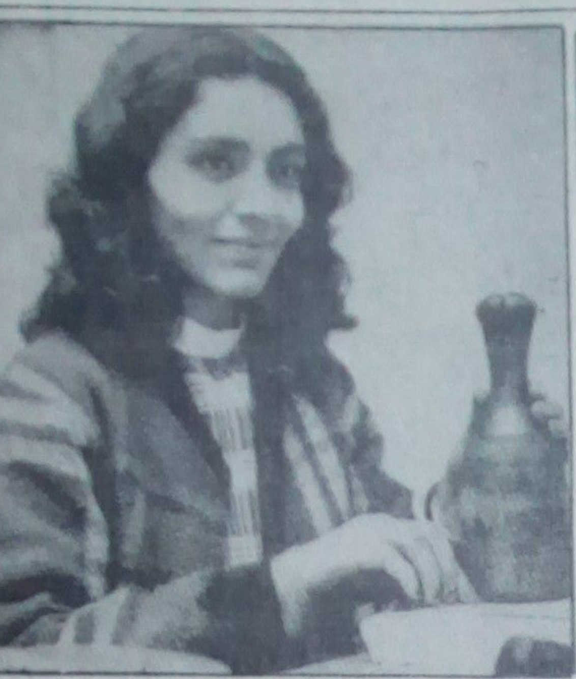
د دو سطرې سياسي کليمنه... د دو سطرې سياسي کليمنه...