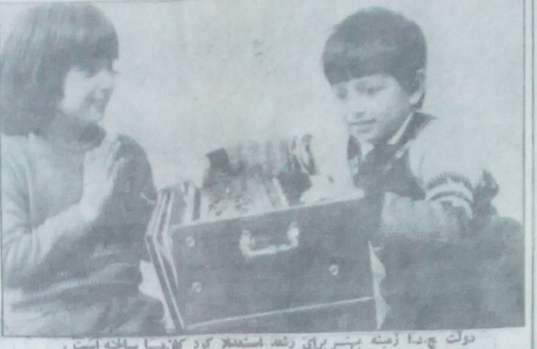
دولت چ.دا زمینه پیشرو برای رشد استفاده کرد کلمه میا ساخته است. دو عکس: افلاک کودستان وزیر ابر خان، عکاسی پایه خان

(گستره مهر) نام فلسی است بر او ن صبا منته منی که از سوی اداره فلسیای هنری و منته لیه گردیده و شام ۵ حوت از طریق تلویزیون پیشی گردید. این فلم که تقریبا از قطع آن آغاز میشود و پیشی این پیشی آن بر فلش یک حساس (رجعت بگفتند) استوار است. یک روال نا ظفی و انگیزنده دارد که همه فلم در محور قرار داد ن شخصیت مرکزی فلم هویت مییابد. با آنکه پیام فلم در رابطه با امر مصالحه از زشتی های فراوانی دارد و لسی بر وجودت کا سنی های در فلم گستره مهر را اند کسی