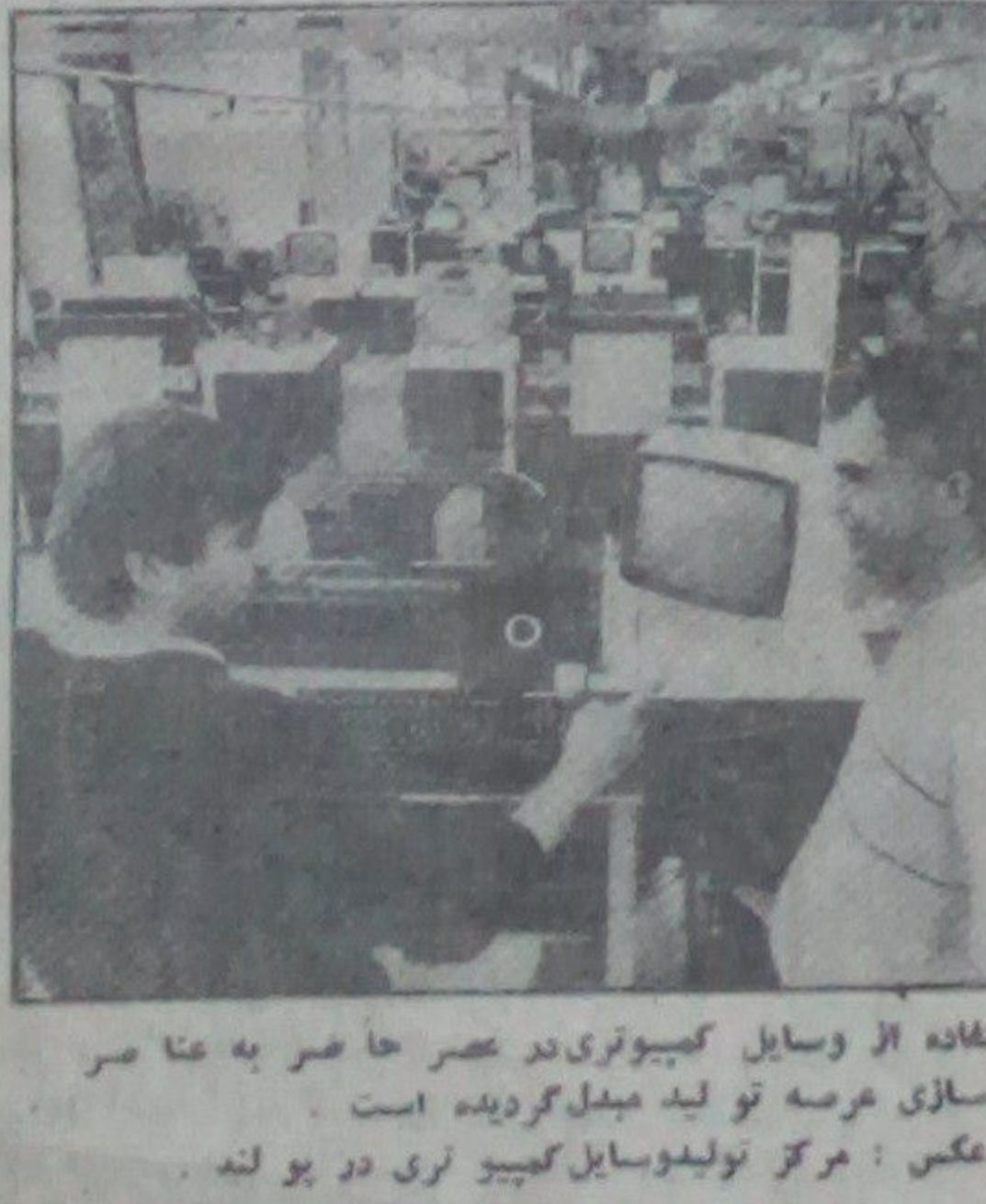
استفاده از وسایل کمپیوتری در عصر حاضر به عا صر نو سازی عرصه تولید مبدل گردیده است. دو عکس: مرکز تولید وسایل کمپیوتری در یو لنه

سد ها محصل از جبل بوستون و کالج در همد ایالات متحده امریکا در اعتراض علیه حمایت اداره ریگر از ضد انقلاب نیکاراگوا پرورد به انحصار نمایان دست زدند.