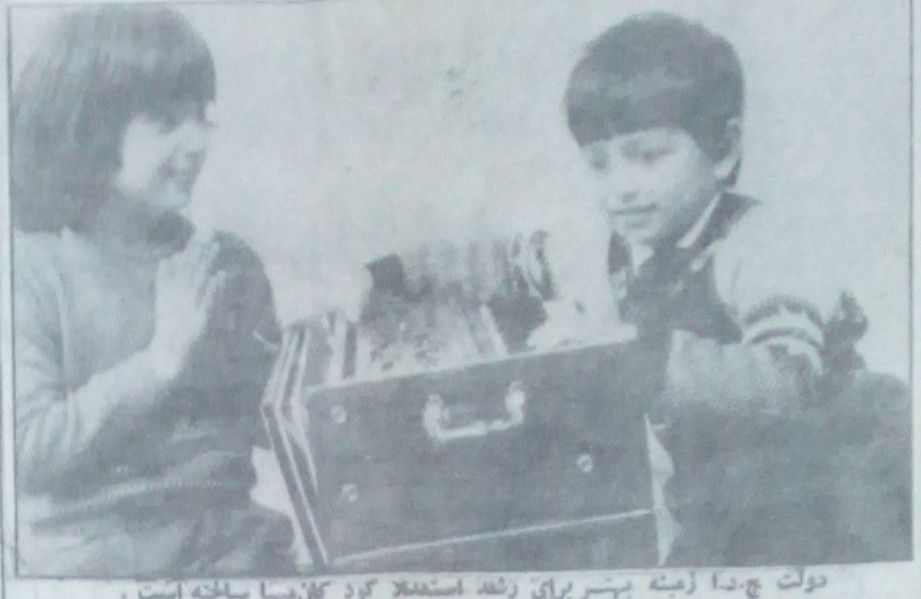
دولت چ.دا زمینه پیشرو برای رشد استفاده کرد کلمه‌ها ساخته است. دو عکس: افشار کوهستان وزیر آذربایجان، عکاسی پایه خان

این فیلم به کارگردانی ناصر گیتی‌نژاد و بازیگرانی چون رضا یزدانی، کیوان سلطانی و... در ۱۹ روز شش روز شوت گردیده است. این فیلم که تقریباً از مقطع تولد تا شش سالگی کودکی را نشان می‌دهد. داستان آن در مورد یک خانواده فقیر است که در پی تلاش برای بهبود وضعیت زندگی خود با مشکلات فراوانی مواجه می‌شوند. فیلم به زیبایی و حساسیت در تصویربرداری و بازیگری به تصویر کشیده شده است. به نظر می‌رسد که این فیلم می‌تواند به عنوان یک اثر ارزشمند در سینمای ما به حساب آید.