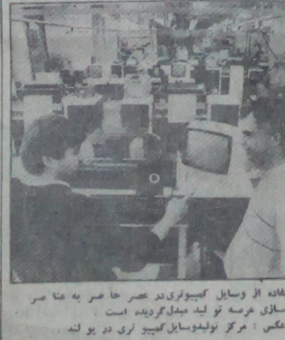
استفاده از وسایل کمپیوتری در عصر حاضر به عا صر نو سازی عرصه تولید مبدل گردیده است. دو عکس: مرکز تولید وسایل کمپیوتری در یو لنه

سد ها محصل از جبل بوستون و کالج در عهد ایالات متحده امریکا در اعتراض علیه حمایت اداره ریگر از ضد انقلاب نیکاراگوا پرورد به انحصار نمایر دست زدند.