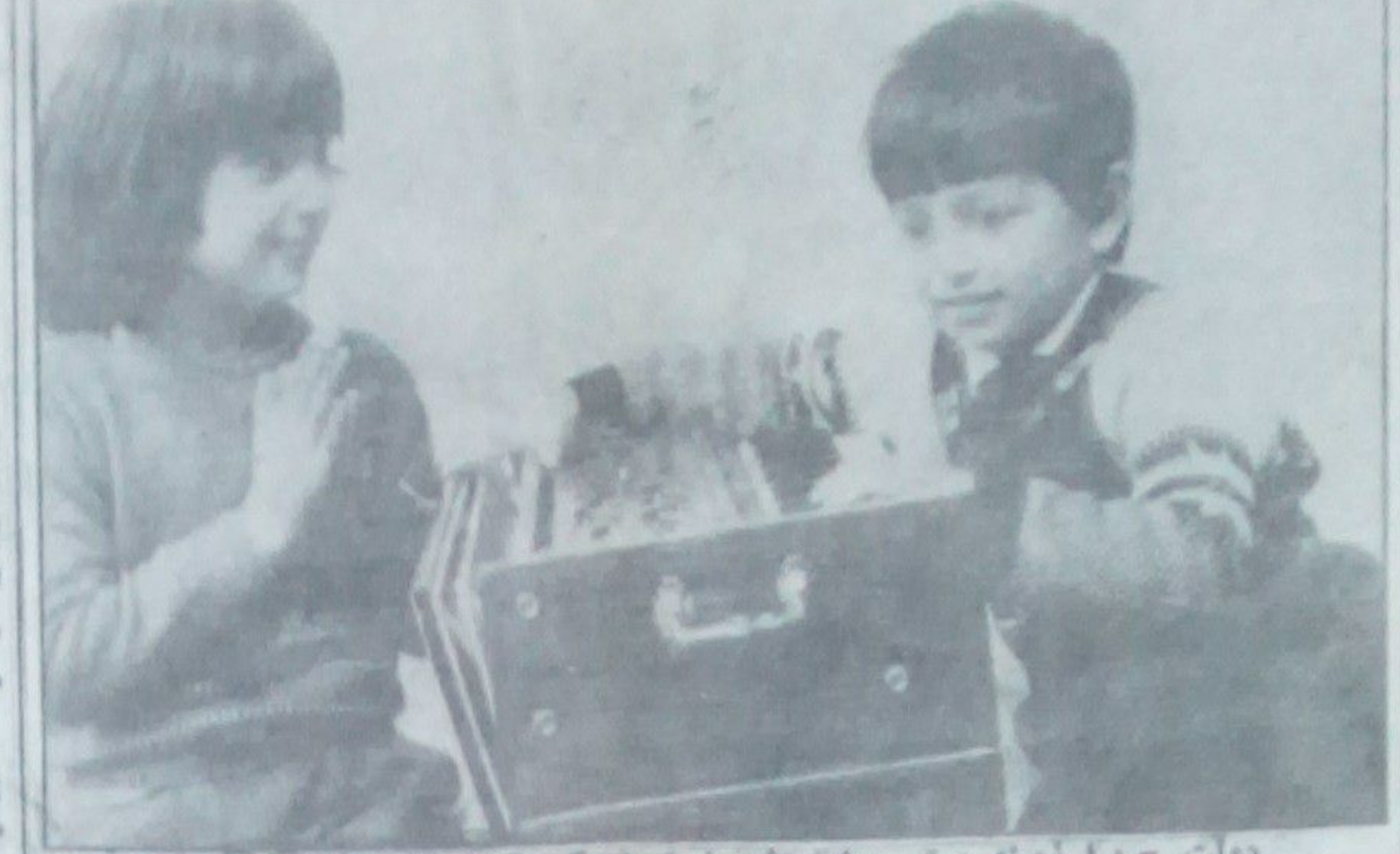
دولت چ.دا زمینه پیشرو برای رشد استفاده کرد کل میا ساخته است - دو عکس: افلاک کودکان وزیر ایگری خان عکاسی پایه خان

در گستره مهر) نام فلم است پیرامون ن صاعه ملی که از سوی اداره فلسفای هنری و مستند تهیه گردیده و شام ۵ حوت از طریق تلویزیون پیشی گردید این فلم که تقریبا از قطع این آغاز میشود و پیشی این پیشی آن بر فلش یک حساس (رجعت بنگلستان) استوار است - یک روال نا ظنی و انگیزنده دارد که همه فلم در محور قرار دادن شخصیت مرکزی فلم صوبت میباید - با آنکه بیام فلم در رابطه با امر مصالحه از زشتی های فراوانی دارد و لسی بر جودیت کا سنی های در فلم گستره مهر را اند کسی