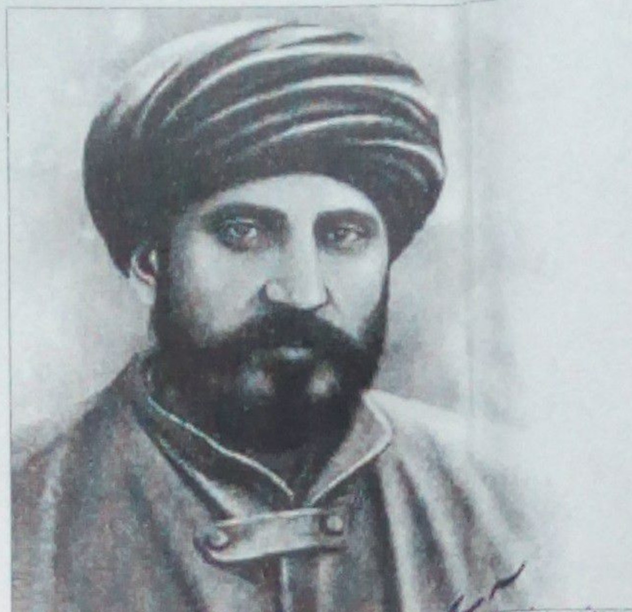
د ختيځ ستوري علامه سيد جمال الدين افغان

او د دې ژبو د مولانا محمد امین خوکیانی له خوا؛ ژباړل شو او وروسته چاپ ته ورکړل شو، چې وروسته بیا څو څوڅوې نور هم چاپ شوي دي دغه ډول سید جمال الدین افغان علمي او ادبي لیکنې په انگریزي او عربي ژبو د صباخاتقین په نامه جریده کې هم