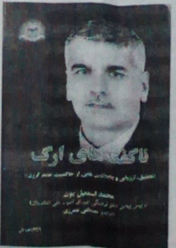
ناگفته های ارگ

چقدر بود؟ چهره های تاثیر گذار در ارگ کی ها بودند؟ پول ایران را چه کسی، برای چه کسانی میبرد؟ سطح صلاحیت حامد کوزی در حکومت تا کدام سرحد بود؟ اثرات طالبان و ائتلاف شمال در جنگ و صلح، چه قدر بود؟ نوظبه قتل حامد کوزی را چه کسانی طرح ریزی کرده بود؟ آیا کوزی با اقبال یا به تدبیر حکومت میکرد؟ وی قانونی را چه کسانی قایل کرده بود؟ چه کسانی به حساب پنجاه هزار عمل عرفانوی انجام داده است؟ نیز شامل صفحات این کتاب میباشد، تماماً مابین فوق که از آن تذکر به عمل آمد منجبت اسناد معتبر درآینده به