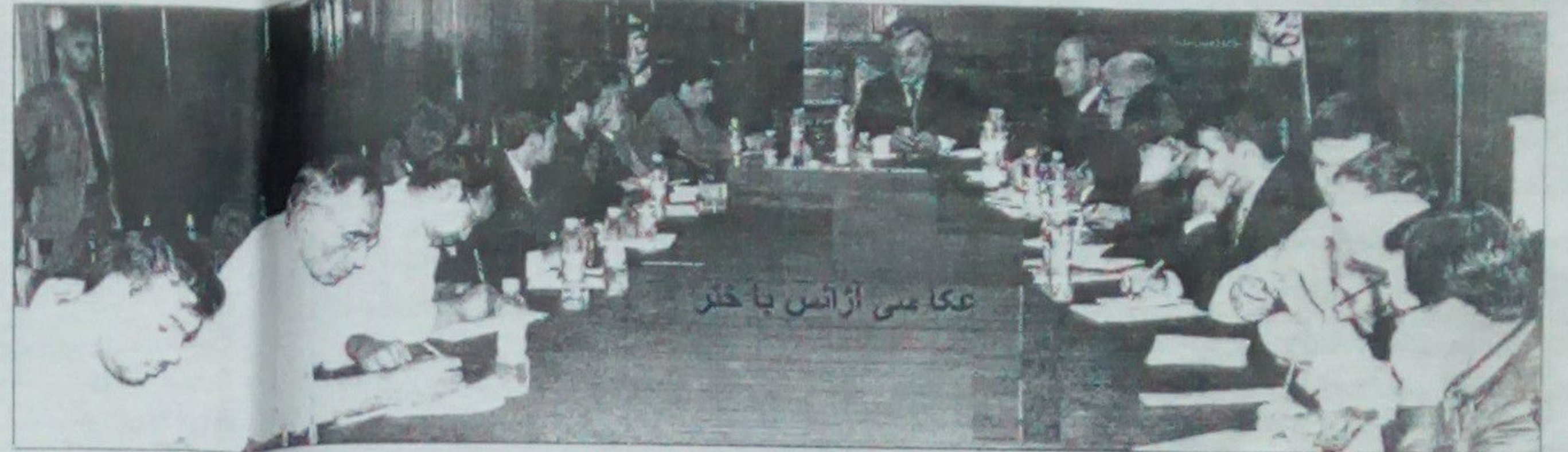
عکاسی از آئین با خیر