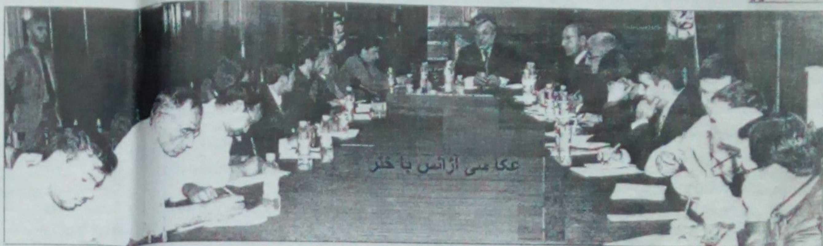
عکاسی از ایتار معلولان