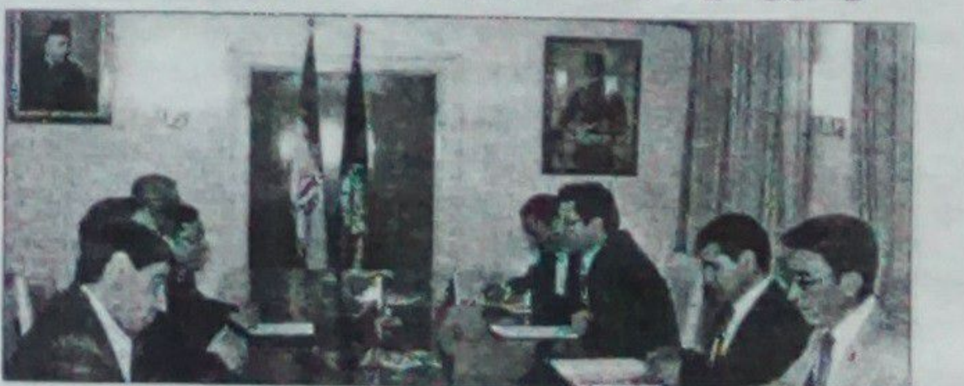
افغانستان، مشکلات مهاجرین افغان در ایران، تمدید ویزه اقامت افغان های شامل طرح ساماندهی، تشویش و نگرانی افغانستان از بابت اعزام مهاجرین افغان مقیم ایران به جنگ سوریه، عفو و تخفیف مجازات افغان های زندانی در ایران، برگزاری نشست کمیسیون مشترک امور فونسل میان دو کشور، اجرایی شدن موافقتنامه های انتقال محبوسین، سرتاد مجرمین و معاضدت