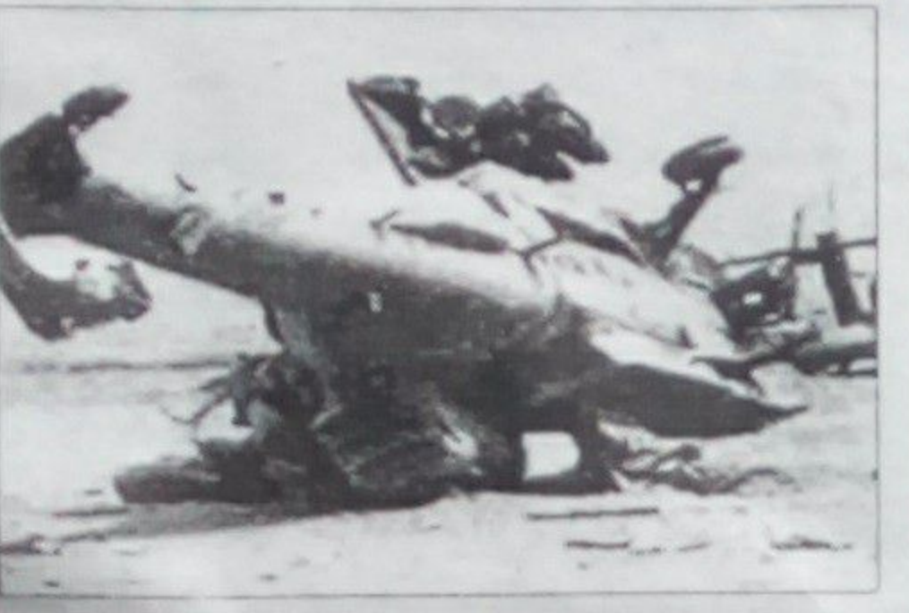
در اثر سقوط یک هلیکوپتر در منطقه سایبریای روسیه حداقل زنده تن هلاک شدند.

به گزارش آژانس باختر به نقل از خبرگزاری رویترز هلیکوپتر یاد شده از نوع i-m هژده بوده که در منطقه ساخا سایبریای با بیست و هشت سرنشین سقوط کرد. این هلیکوپتر متعلق به خطوط هوایی پولاار ایرلاینز بوده که پس از سقوط دچار حریق شده است. کمیسیون هوانوردی غیر نظامی روسیه که این خبر را اعلام کرد گزارش داده است که از بیست و هشت سرنشین این هلیکوپتریست و پنج تن آنان مسافر و سه نفر دیگر عمده آن بودند.