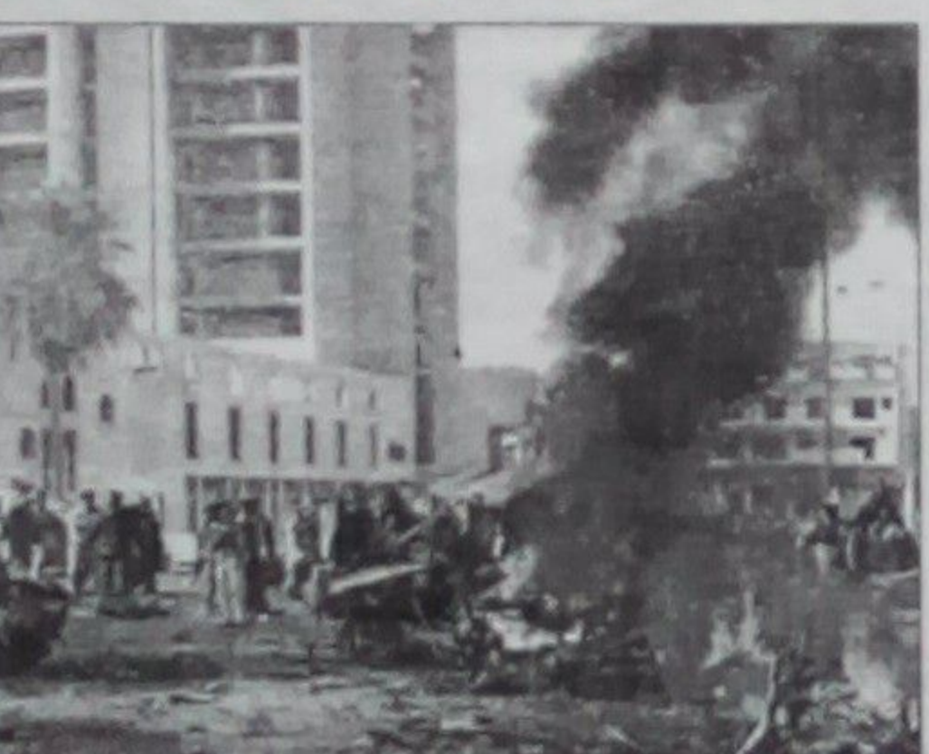
در نتیجه چندین حمله در شمال بغداد پایتخت عراق حداقل چهل و یک نفر کشته شدند.

عراق بیش از دو هزار و پنجمصد نفر کشته شده که باعث تکرانی ها از اوج گیری جنگ دو باره در آن کشور شده است. تازه ترین خشونت ها در عراق نشان میدهد که این کشور درگیر اعتراضات میان سی و شعبه و تشنج در امتداد راه باریک طرف شمال عراق و بن بست طولانی سیاسی قرار گرفته است. خشونت ها و حمله های اخیر در عراق چهل و یک تن را بکام مرگ فرو برد که این نشان دهنده افزایش چشمگیر خشونت ها در چند ماه اخیر بوده است.