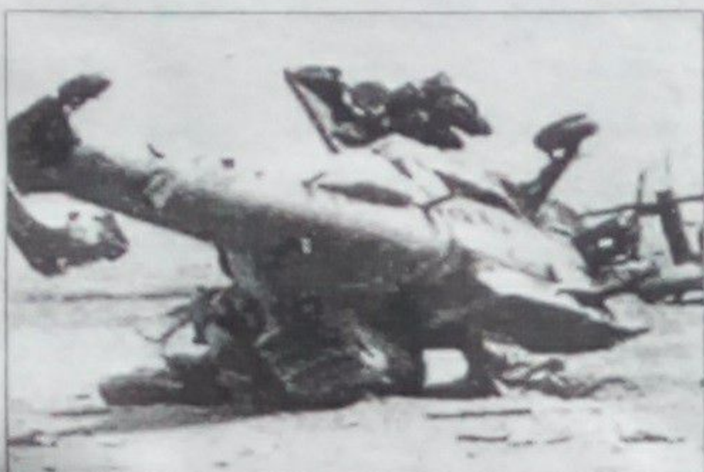
در اثر سقوط یک هلیکوپتر در منطقه سایبریای روسیه حداقل نژده تن هلاک شدند.

به گزارش آژانس باختر به نقل از خبرگزاری رویترز هلیکوپتر یاد شده از نوع i-m هژده بوده که در منطقه ساخا سایبریای با بیست و هشت سرنشین سقوط کرد. این هلیکوپتر متعلق به خطوط هوایی پولار ایرلینز بوده که پس از سقوط دچار حریق شده است. کمیسیون هوانوردی غیر نظامی روسیه که این خبر را اعلام کرد گزارش داده است که از بیست و هشت سرنشین این هلیکوپتریست و پنج تن آنان مسافر و سه نفر دیگر عمه آن بودند. رویترز گزارش داد که یک کودک از جمله نجات یافته‌گان این سانحه است.