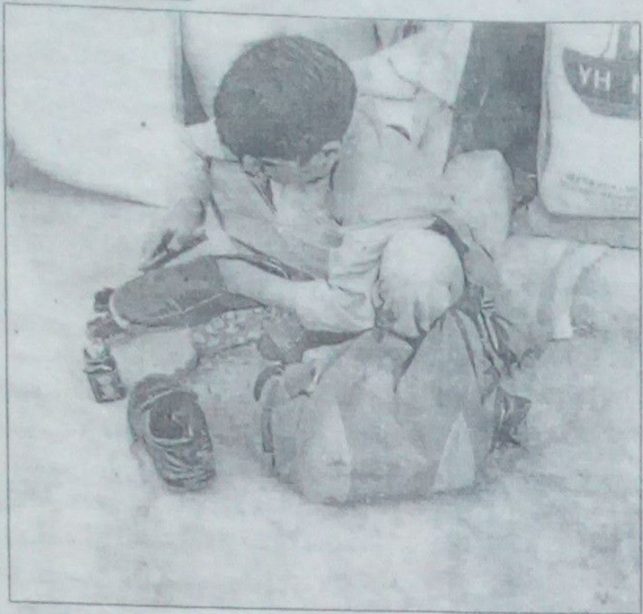
تهیه کننده: یوسف یوسنی