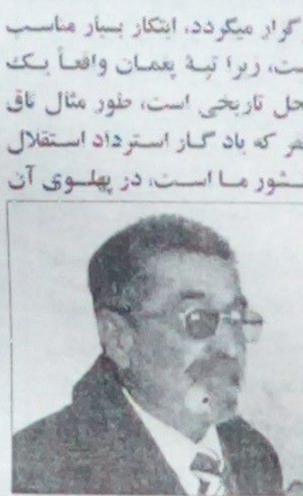
راز بر یوال

حرکه های ملی ما به رهبری شاه ایمان الله خان غازی نیز در پیمان دایر گردیده است. بناء برگزاری جشن نوروز در پیمان به سطح کشور های حوزه نوروز بک انتخاب به جا و بک ابتکار خوب دولت افغانستان است.