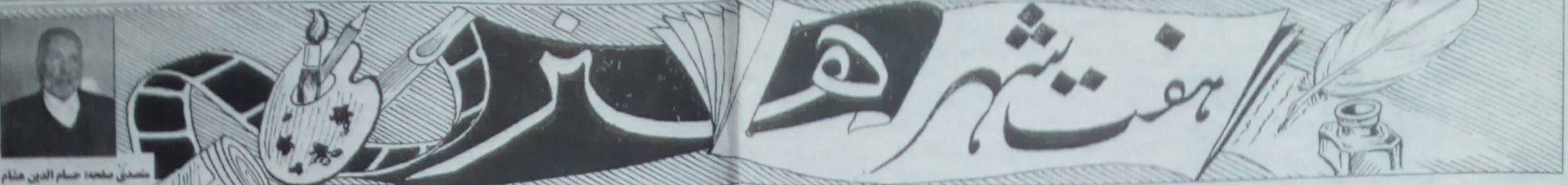
مستند تلخه: صام الدين هنام