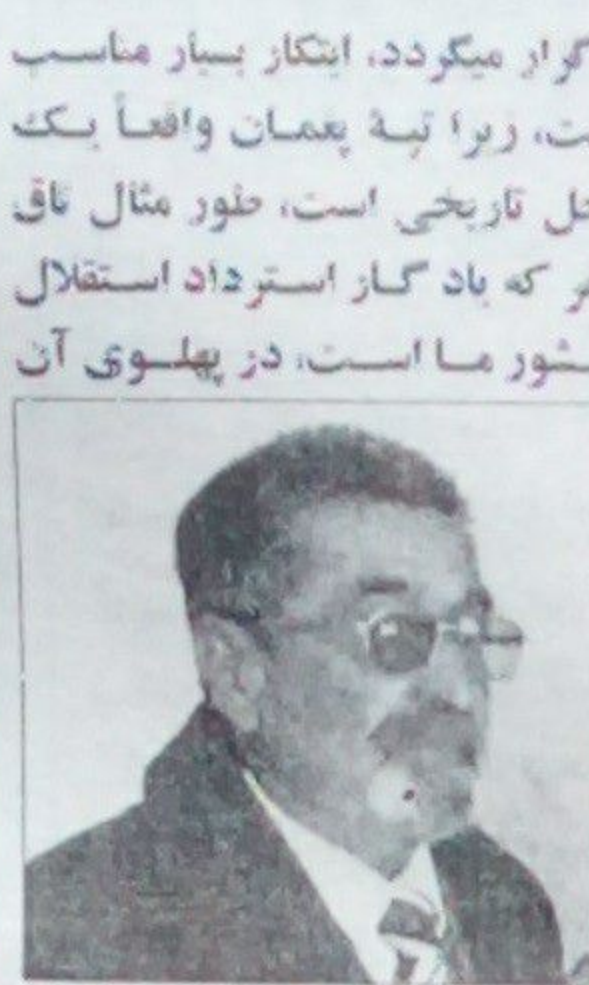
راز بر یوال

حرکه های ملی ما به رهبری شاه ایمان الله خان غازی نیز در پیمان دایر گردیده است. بناء برگزاری جشن نوروز در پیمان به سطح کشور های حوزه نوروز بک انتخاب به جا و بک ابتکار خوب دولت افغانستان است.