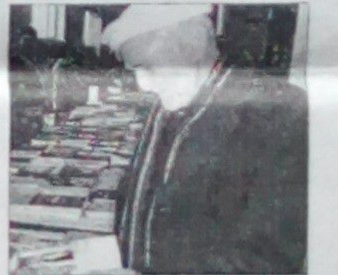
سمع الله تاره

در این نمایشگاه تعداد زیادی از ناشران خصوصی غرفه ها را ایجاد نموده و کتابهایی را که چاپ کرده اند در معرض نمایش گذاشته اند تا مردم از این کتابها