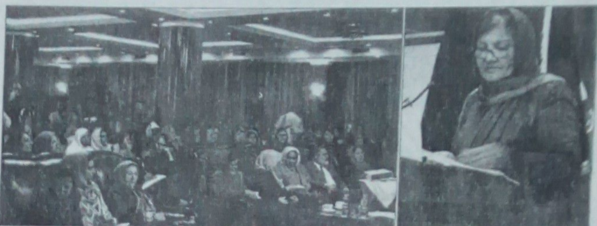
امور، کمیسیون های امور زنان، مشاوران جرگه، ولسی جرگه و مسولین عالی رتبه وزارت خانه ها و روسا و مدیران حقوق ریاست های امور زنان و ولایات کشور اشتراک ورزیده بودند.

وزارت امور زنان به افتخار روز مادر کنفرانس علمی را تحت عنوان «زنان، ایثار، صلح و اعتماد سازی» برگزار کرد. حضور سال روان در هفتاد کابل ستار تدویر نمود در این کنفرانس هیئت رهبری وزارت امور زنان، اعضای ریاست عمومی اداره امور اجتماعی و سیاسی سهم فعال داشته و اراده ما ایست که این سهم گیری افزایش یابد. به تعقیب دبیر نظری وزیر امور زنان با ابراز مراتب تبریکی و تهنیت به مناسبت روز مادر و توضیح جایگاه اساسی و قانون مدنی زنان افغان در امور اجتماعی و سیاسی سهم فعال داشته و اراده ما ایست که این سهم گیری افزایش یابد. به تعقیب دبیر نظری وزیر امور زنان با ابراز مراتب تبریکی و تهنیت به مناسبت روز مادر و توضیح جایگاه اساسی و قانون مدنی زنان افغان در امور اجتماعی و سیاسی سهم فعال داشته و اراده ما ایست که این سهم گیری افزایش یابد.