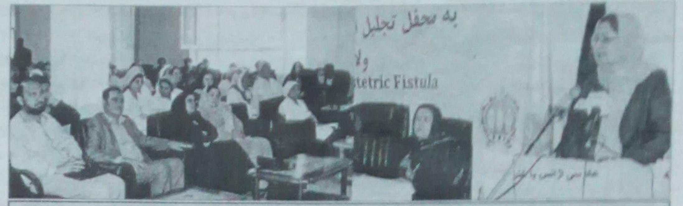
د عامې روغتيا وزيره ډاکټره لريا د ليل غونډې نه د وينا پر مهال

د ولادي فيستولا د نه منځه وړلو لپاره ورځ وروستې پوهنځي جوړ کړي او د اميدواره کېدو په اړه د حقوقي پوهاوي اړتيا ته ځان پوهاوي کولای شي. د ولادي فيستولا د نه منځه وړلو لپاره ورځ وروستې پوهنځي جوړ کړي او د اميدواره کېدو په اړه د حقوقي پوهاوي اړتيا ته ځان پوهاوي کولای شي.