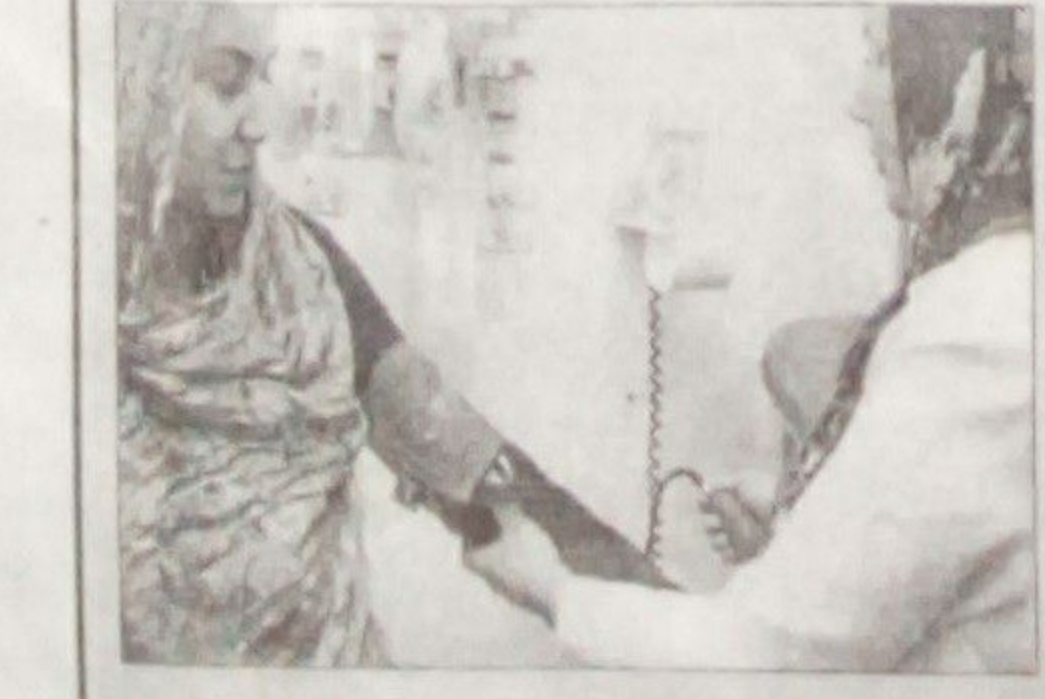
بواسطه سیکولوم و کوشش شود از معاینه مهلی با دست جلوگیری گردد. اگر سن حمل بین ۲۲ الی ۵ ص

تعریف لیر: تقلصات درد های ولادی، که باعث تغییرات اناتومیک در عنق رحم میگردد. توسعه و نرم شدن عبارات از لیر است. تعریف لیر قبل از وقت شروع درد های منظم رحمی قبل از هفته ۳۷ حاملگی که باعث تغییرات اناتومیک در عنق رحم (توسع و نرم شدن) میگردد و گاهی با پاره شدن کیسه آمنیون همراه میباشد. • ارزیابی جنین، گراف قلب جنین برای ارزیابی فعالیت رحم و حالت جنین و التراسوند • معاینه لابراتواری معاینه روتین ادرار باید نزد تمام مریضان مصاب به لیر قبل از وقت اجرا گردد. معاینات دیگر را نظر به دریافت ها توصیه نمایید. تشخیص: تاریخچه دقیق تقلصات درد های ولادی. اعراض اتان طرق بولی و آفات دیگر، تب، تاریخچه لیر قبل از وقت قبلی، استفاده دخابات و لیکاز مایه آمنیوتیک. معاینه فیزیکی: ✓ شامل تعین سن حمل و اندازه رحم و معاینه عنق رحم بواسطه سیکولوم معقم میباشد. کوشش شود تا از معاینه با دست جلوگیری گردد. ✓ موجودیت درد های رحمی منظم به فواصل ۱-۵ دقیقه و دوام ۲۰-۳۰ ثانیه همراه با تغییرات در عنق قرار جنین را تثبیت نموده و در صورتی که قرار طولانی باشد جیب ریچر داده شود و ولادت نارمل را اجازه دهد. ولادت طفل دومی ۵ ص