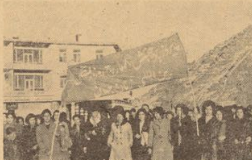
زنان با گرمی و شور انقلابی، روز همبستگی زنان یعنی هشتم مارچ را استقبال می‌نمایند

حافظه تاریخ مشحون از فدا - کاری‌های زنان - مملو از تمنیات و آرزوهای هستی‌ساز آنها - سرشار از فراز و نشیب‌ها - قربانی‌ها و خودگذاری‌های بی همتنای زنان است . زنان پیکر جدانا شدنی جوامع بشری بوده و در آهنگ تحولات اجتماعی سهم مینمایند . این زنان اند که علی‌الرغم دشواری‌ها و مشکلات