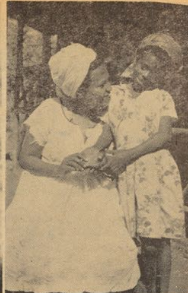
امروز جهان بشری تبعیض انسانها را مبنی بر اختلاف نژاد، لسان، رنگ و غیره نمی‌شناسد