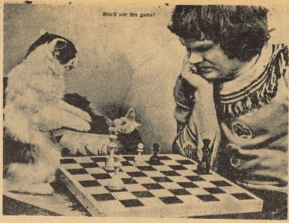
شطرنج یکی از بازی های خیلی دوست داشتنی است درین عکس یک جوان علاقمند به شطرنج میخواهد حرکت دانه ها را بیک لیشک بیاموزاند .

• بدین ترتیب که سبب را خوب سسته و تراش نموده و به اطفال داده شود ، سبب یک میوه فوق العاده مفید می باشد . میگویند هر روز یکدانه سبب بخورید تا سالم و صحتمند باشید .