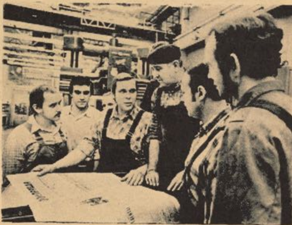
اتحادیه های کارگری در جوامع سو سیالستی خود در مورد طرق بهتر و مثمرتر کار و حل مشکلاتشان تصمیم می گیرند .

جهت عمده در نهضت بین المللی اتحادیه کارگری بر اساس شکل و میتودی که از آن در دفاع از منافع