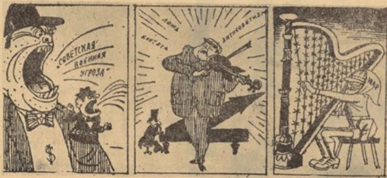
هما هنگسی ساز همونیزم با امپریالیزم

زیرا که این نوع آرد ها هفتاد الي ۸۰ فیصد آرد خالص را دارا می باشند مواد سلولوز در سیوس ویا قشر گندم موجود بوده زمانیکه اطفال به تشوشات ویتامین خصوصا گروه