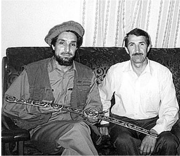
احمد شاه مسعود او د روسي څارگری (کې.جي.بي) ډگروال رينات تيمبروويچ امينوف، د ۱۹۹۸ ز کال د جولای میاشت.