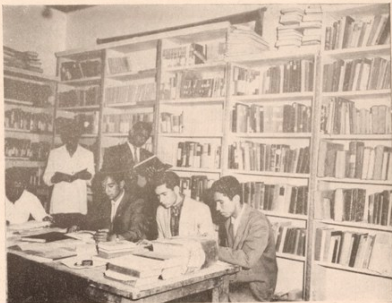
یسک تعداد محصلین پوهنځی در کتابخانه پوهنځی سرگرم مطالعه میباشند.

عی، دین، ننگون زلحاط تشکیر سک ازین و... لسانی می باش ماوراء السلسالی صفحه (۱۸۱۶)