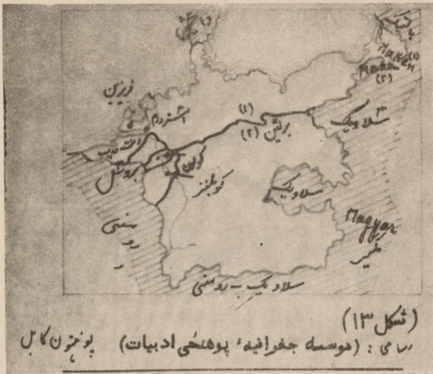
(شکل ۱۳) راسی: (موسسه جغرافیه، پوهنهی ادبیات) پونترن کابل

از گفتار فوق بر می‌آید که در سه لهجه یاد شده در اخیر، این صدا همان صوت ژرمانیک نخستین و هالندی میانه نیست، بلکه ساختمان این دو کلمه تغییر نیافته و تا کنون فونیم سیلابی آنها با هم مطابقت میدارد. معیناً، از ملاحظه نقشه بر می‌آید که این واول را در سه ناحیه وسیع در کلمه mous بصورت [u:] در کلمه hous بشکل [y:] بدینگونه [mu:shy;s] تلفظ میکنند. درین ناحیه‌ها روابط ساختمانی این دو کلمه تغییر یافته است، یعنی از لحاظ فونیم سیلابی تطابق نمیدارند.