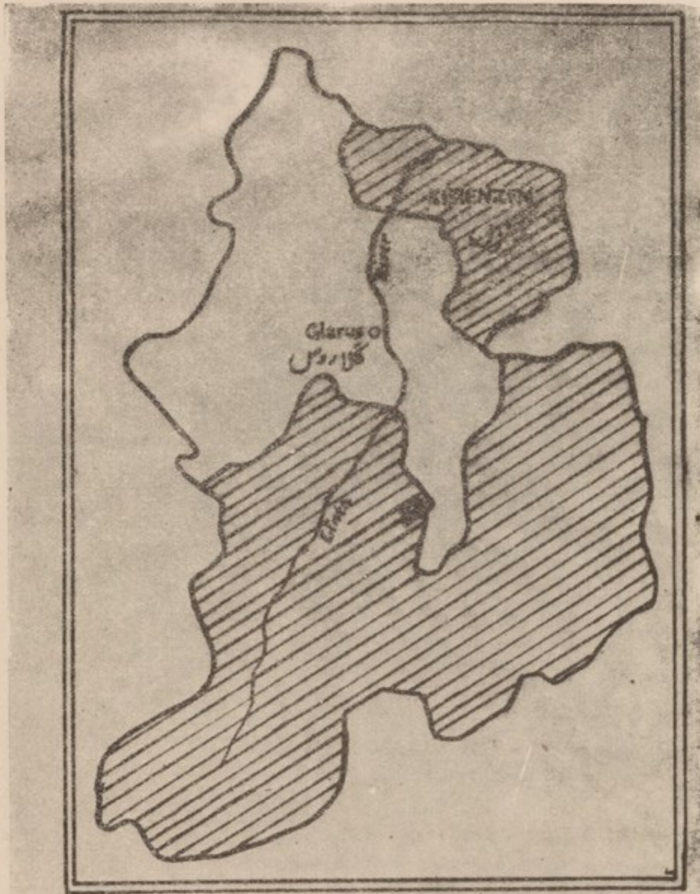
(شکل ۷) رسمای: (مؤسسه جغرافیة پوهنشی ادبیات)

واضح است که باید نقشه یا اطلس لهجی با چنان تفصیلاتی مزین باشد که حقایق یا تفصیل مبدأ اشکال لسانی را مانند نقشه‌های مرتبه Fischer و Hagg و Klocke ایضاح کند. انلسهای