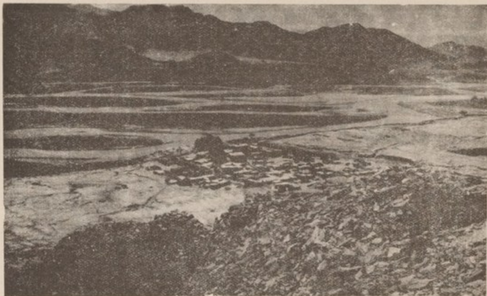
اسلامپور: دره کتر، دهکده و استحکامات در دامنه کوه

به یک معماری دفاعی اشاره میکند، چنانچه استنباط میگردد از اسلام پور از میان دره و از بالای کوتل راه باستانی ای که در اینجا بذریعه استحکامات حفاظت می شد، موجود بوده است. واضحاً این راه که با امتداد پیکر کوه کشیده شده در زمان سابق از راه کنار دریا که با امتداد یک ساحل نشیب دار یا از میان با طاقی می گذشت، ترجیح داده شده بود. مشاهده این راه ارتباطی به نظریه ترینکلر (۱) که اسکندر بسوی گنوهمراره دریا را مستقیماً تعقیب نکرد بلکه در بعضی حصص راه میان کوه هاراپیش گرفته بود، دست آویزی می بخشید. سلسله استحکامات کوهی درهء نور در حصهء اسلام پور و پیشتر جانب گنوه قرون بعد از لشکر کشی اسکندر تعلق دارد، اما احتمال دارد که بنیاد آن در زمان اسکندر گذاشته شده باشد.