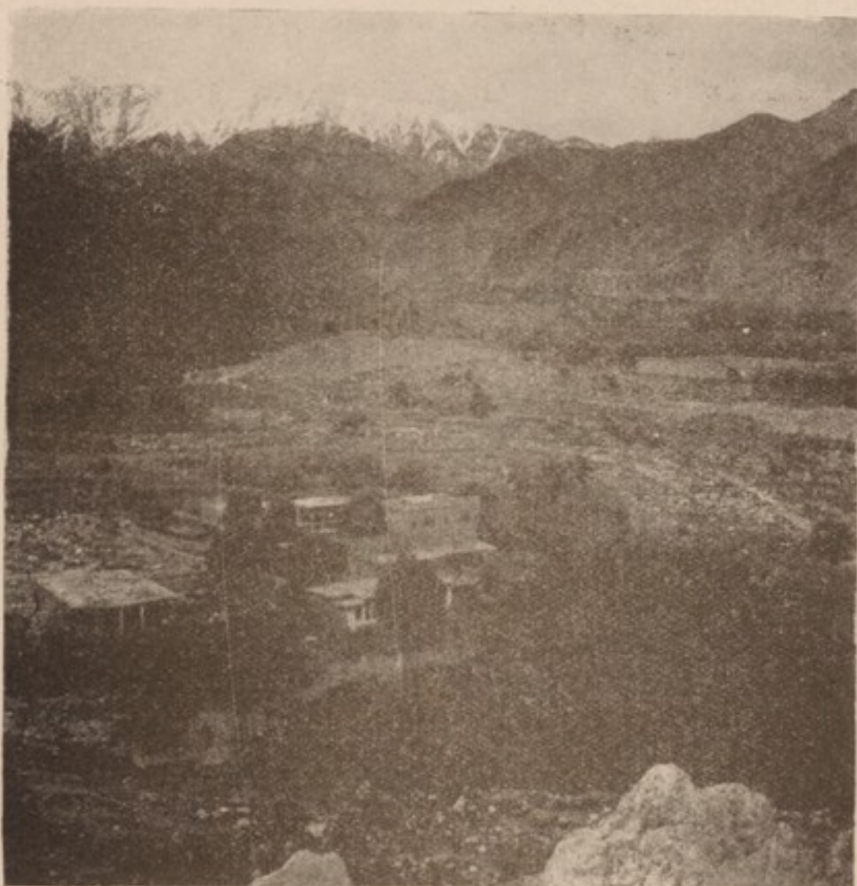
دره نور :

میشوند) سیستمی از دره‌های بسیار منشعب بسوی کنور می‌رود. از فراز بمبهه کوت در قلب کوه هامنطقهء برزخی جانب نورستان امتداد یافته است. هر قدر که انسان طرف قسمت‌های علیای دره هابسری شمال بلند رود، بهمان اندازه بامردمان موخر مایسی و کبودچشم، که لباس و عادات مخصوصی دارند، برمی‌خورد. ایشان گروه پهای متفرق و پاشانی اند که در اینجا از قشونکشی‌های بزرگت باقیمانده در مناطقی که رجعت کرده‌اند زندگی میکنند. باید کلمهء درهء نور را توضیح نمود. معنی آن بزبان فارسی معلوم است (مانند نورستان = سرزمین نور)، و بزبان پښتو طوری که میگویند «درهء میان صخره‌ها» میباشد. احتمال می‌رود که این نام باخواجه نوره که یکی از فاتحین اسلامی بوده است، رابطه داشته باشد. و بالاخره بقرار روایتی نوح با کشتی خویش بالای یکی ازین کوه‌های بلند پیا ده شده است. در حصهء شیوه از سرک درهء کنور راهی جدا شده که از طریق قریهء بزرگت املا