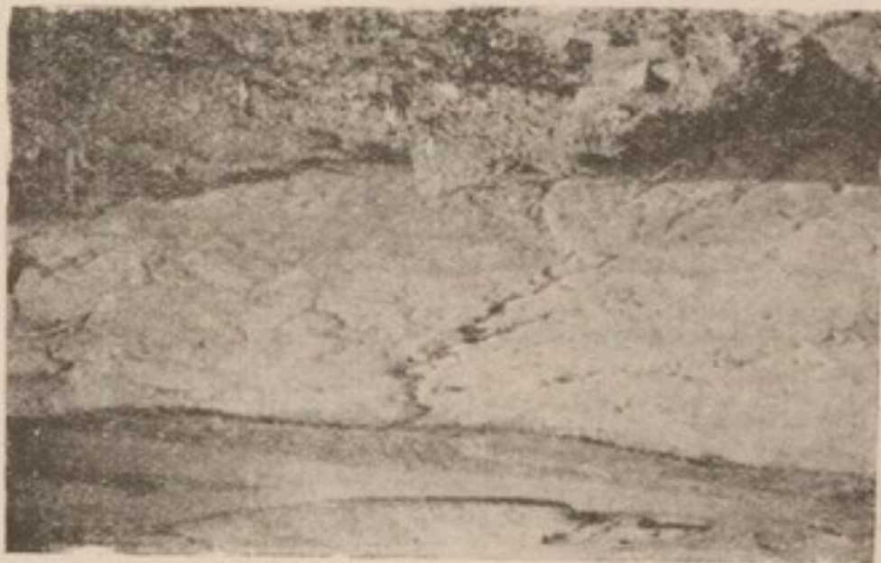
اسلامپور: دره کمر و استحکامات کوهی

فوشیر (۲) در طی سفرهای مطالعاتی خویش درین قلعه نیز اقامت کرده و خرابه های معبد را، که در آنزمان باین اندازه از بین نرفته بود، معاینه نمود. نامبرده حدس زده است که این معبد بنای بسیار بلندی با جسامت ۵۰ متر مکعب بوده که در آن سنگها بصورت ممتازی طبقه بطبقه کار شده بود. از بالای کوه هاییکه دیوارهای استحکامات وجود دارد سفالین های سرخ معموری متعلق بدورهء اخیر کوشانی بکثرت یافت می شود در جوار خرابه هاییکه در دره واقع است پارچهء شکسته ای از يك ظرف سفالین؛ روکش مینایی را که متعلق بدورهء قبل از اسلام است، نیز پیدا کردم.