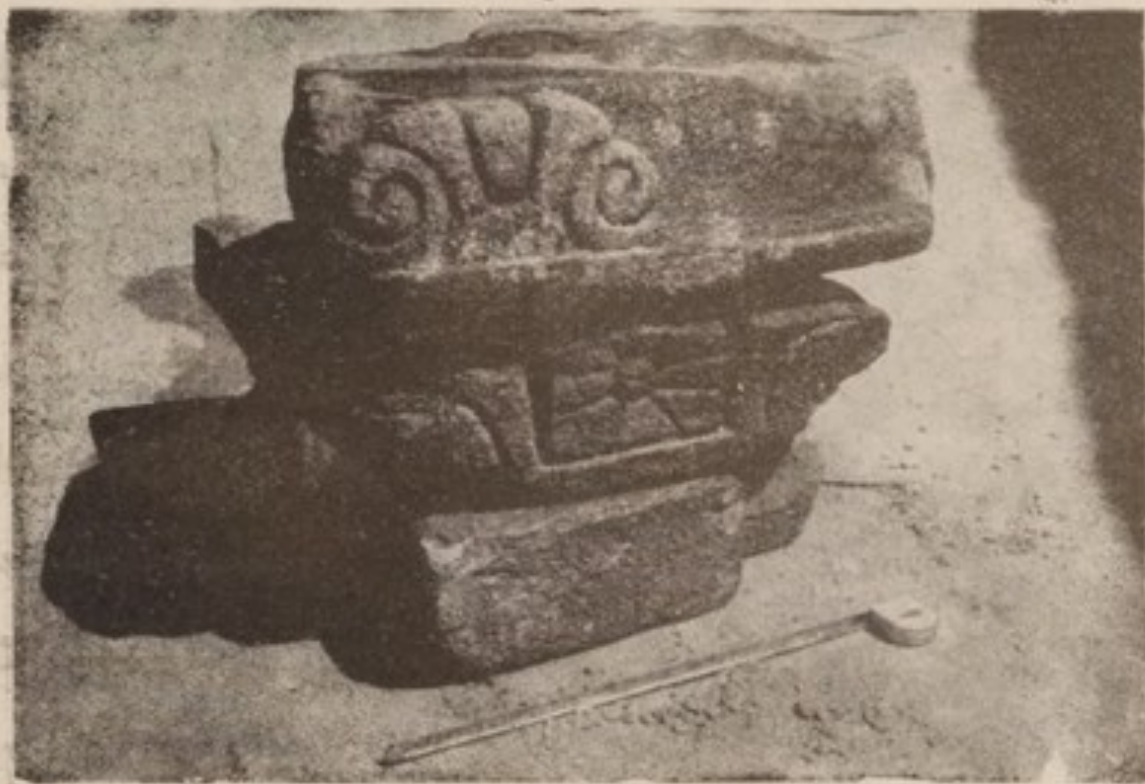
اسلامپور: سنگهای کنده کاری شده از یک عبادتگاه باستانی