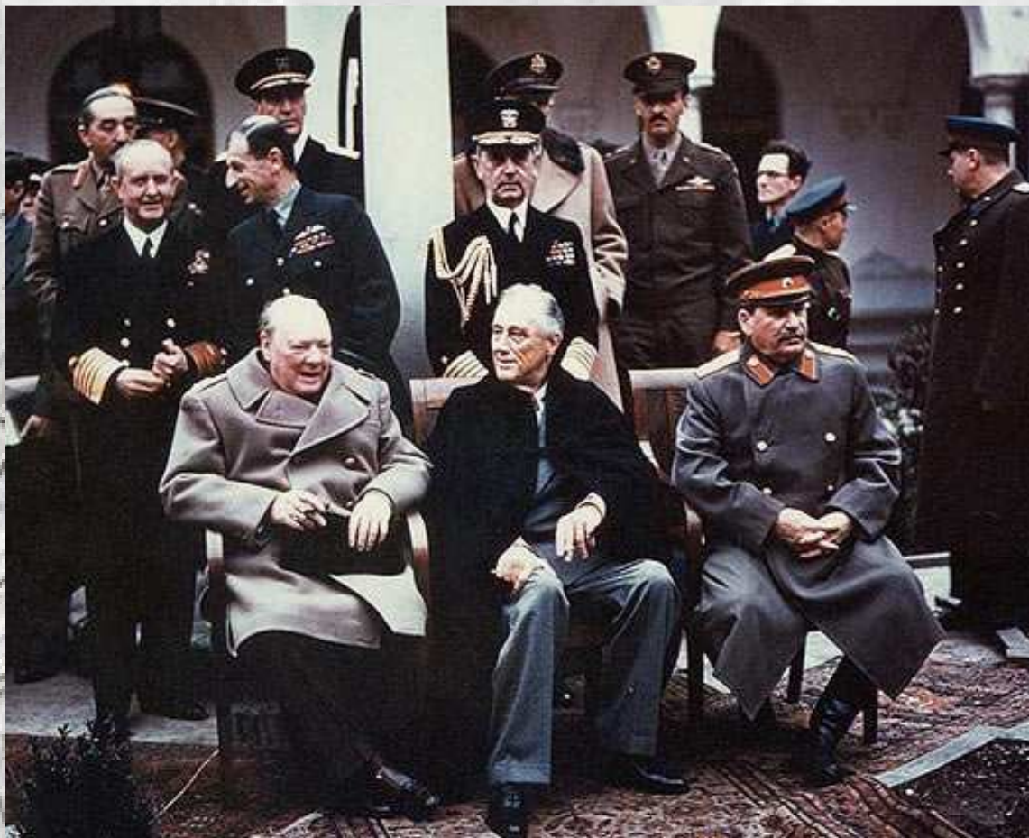
کنفرانس تهران - از راست به چپ: ژوزف استالین - فرانکلین دلانو روزولت - وینستون چرچیل

در پایان کنفرانس تهران که در آبان سال ۱۳۲۰ در تهران تشکیل شد، طرفین تعهد کردند نیروهای نظامی خود را ظرف ۶ ماه از ایران خارج کنند. دولت شوروی قبل از خاتمه جنگ در صدد به دست آوردن امتیاز استخراج نفت شمال در دریای شمال برآمد، اما چون با تصویب قانون منع اعطای امتیاز نفت به خارجیان در مجلس شورای ملی، از دریافت این امتیاز محروم شد، بنای مخالفت و ناسازگاری با دولت ایران را گذاشت و پس از خاتمه جنگ مقدمات شورش مسلحانه را در آذربایجان فراهم ساخت. نیروهای شوروی از حرکت واحدهای اعزامی ارتش برای سرکوبی این شورش جلوگیری کردند و موجبات تسلط فرقه دمکرات را بر آذربایجان و سپس در کردستان را فراهم ساختند. در اردیبهشت ۱۳۲۴، حکیم الملک، نخست وزیر شد ولی به سرعت جای خود را به محسن صدر (صدر الاشراف) داد.