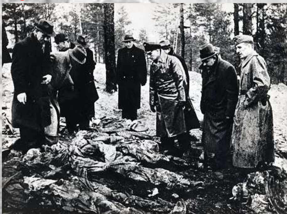
کشف اجساد سربازان لهستانی توسط آلمانی ها - جنگل کاتین

اکنون دیدگاه رسمی در روسیه این است که این اتحاد جماهیر شوروی بود که اروپا را آزاد کرد. روس ها بر این نکته تاکید می کنند که میلیون ها شهروند روس خود را در اثر مقابله با ارتش هیتلر از دست دادند و تنها مقصر جنگ را متوجه آلمان نازی می دانند. در قطعنامه شورای امنیت و همکاری اروپا که در ماه ژوئیه به تصویب رسید، این مساله ارائه شده بود که روسیه در مورد جنگ جهانی دوم نیز مقصر است. برای برخی کشورهایی که سال ها قبل جزو شوروی سابق بودند، مانند لهستان و کشورهای حوزه بالتیک، نقش روسیه در این جنگ چندان مثبت نبود. این کشورها به شوروی اشاره می کنند که با ورودش به جنگ، راه را برای حاکمیت ایدئولوژی کمونیستی برای بیش از نیم قرن در این کشورها مساعد کرد. روسیه نهاد دولتی جدیدی برای مقابله با جعل تاریخ روسیه بنیان نهاد. روسیه که امروز استالین را جنایتکار تاریخ می بیند؛ سعی بر برائت جویی از اتهامات دارد اما تاکنون نتوانسته خاطرات جنایتهای تلخ گذشته را که بر مردم اروپا روا داشته را از ذهن مردم اروپا و به خصوص مردم لهستان و آلمان پاک کند.