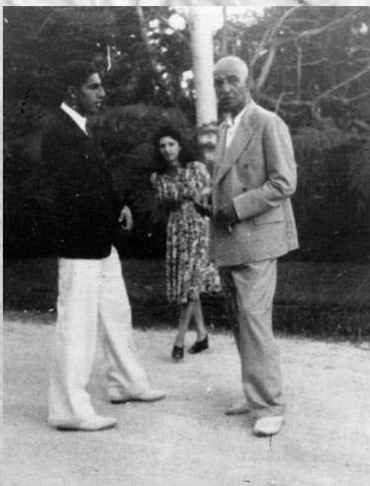
رضاشاه در تبعید، سال ۱۳۲۲

اشغال ایران محدود به قوای انگلیسی و شوروی نبود. پس از ورود آمریکا به جنگ، عده ای از نظامیان آن کشور نیز وارد ایران شدند، اما استقلال و تمامیت ارضی ایران، نخست با امضای یک پیمان سه جانبه بین ایران، انگلیس و شوروی در بهمن ۱۳۲۰ و سپس با صدور اعلامیه ای که در پایان کنفرانس سران متفقین، فرانکلین دلانو روزولت، ژوزف ستالین و وینستون چرچیل در تهران منتشر شد، تضمین گردید.