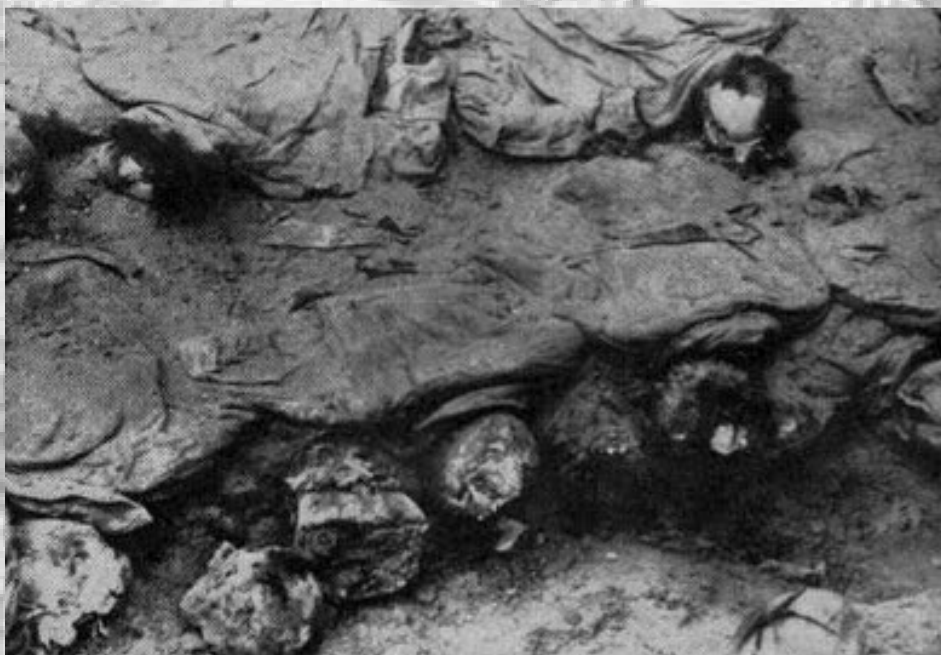
قتل عام سربازان لهستانی توسط ارتش استالین - به اجساد توجه کنید که به شدت بر روی یکدیگر فشرده شده اند، نشانگر بی رحمی و وحشیگری ارتش سرخ