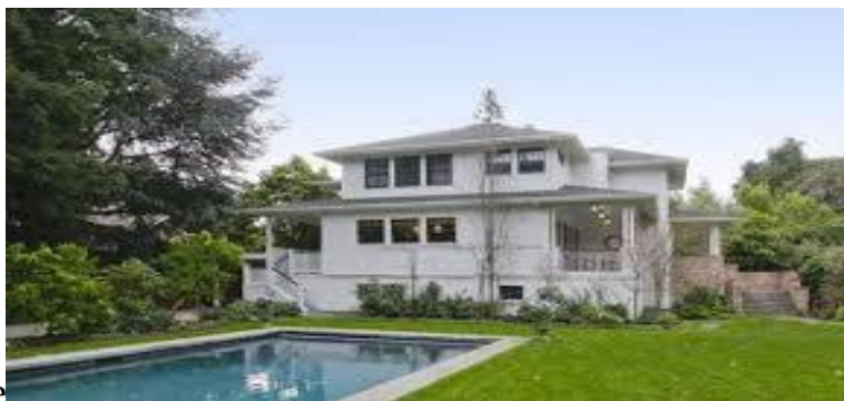
Mark Zuckerberg home

فروفایلونه جوړوې. په افغانستان دننه زما په شمول د فیسبوک کاروونکو شمیر (۴۰۰۰۹۲۴) خلورمیلیونه و نهسوه خلرویشته ده چې دا شمیر ورځ تر بلې زیاتېږي... د فیسبوک مشر مارک زکبرگ د امریکا، کالیفورنیا ایالت په پالوالتو سیمه کې په ۵۰۰۰ مربع فوټه ځای (کور) کې ژوند کوي او مارک په ۲۰۱۱ کې د کریسنټ پارک تر څنګ د خپل ګاونډي کور په ۷ میلیونه ډالرو کې پیږود کړ.