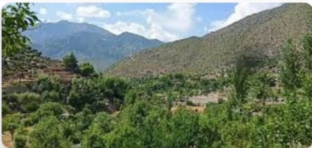
د کونړ سيند

د کونړ سيند د امو سيند څخه وروسته په افغانستان کې دوهم مقام لري دا سيند د ختيځ هندوکش په سويل کې د بروغيل غاښی د (۴۰۰۰) متره لوړوالي څخه سرچينه اخلي او د کامې په ثمرخيلو کې د کابل سيند سره يوځای کيږي دا سيند د کابل سيند پورې تقريباً (۲۷۰) ميله اوږدوالي لري دا سيند په تاريخي اسنادو کې د [راسا] په نوم شهرت لري دې سيند د کونړ په اقليم د پام وړ اغيز کړی ده په کرنه او د سيمي په خړوبولو کې ترې کار اخيستل کيږي په کونړ سيند