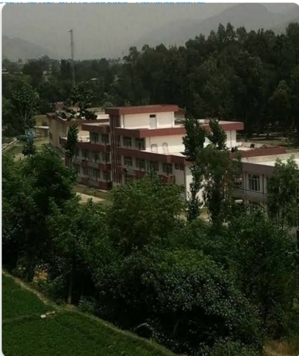
د سيد جمالدين پوهنتون