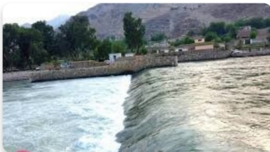
پیچ دری سیند

کی سره زرهم شته چی زرکشان یی ترې راوباسي د دې سیند لوی مرستیالان د پیچ سیند او د لنډي سیند مرستیالان دی د کونړ سیند باندی د برېښنا (۳) بندونه جوړېږی (۱) سره تاق بند چی (۲۵۰۰) میگا واټه برېښنا تولیدوی (۲) مناکی برېښنا بند (۲,۵) میگا واټه برېښنا تولیدوی (۳) څاکی برېښنا بند له دی څخه د څاکی برېښنا بند په کار پیل کړی دی او ښار ته برېښنا ورکوی د مناکی برېښنا بند هم جوړ شوی خو تر اوسه د سره تاق بند په جوړولو کار نه دی پیل شوی. دا چی د کونړ سیند په زیات رفتار سره مخ په ښکته روان دی د کښتی چلولو لپاره مناسب نه دی د کونړ خلک زیاتره د چینی اوبو څخه کار اخلی خو په هوارو ساحو کی خلک له کوهیانو څخه کار اخلی .