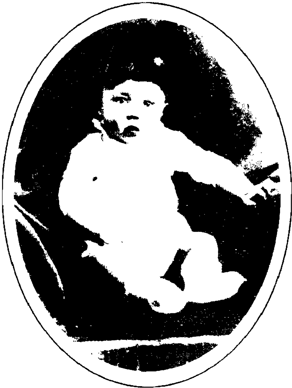
هیتلر در زمان کودکی