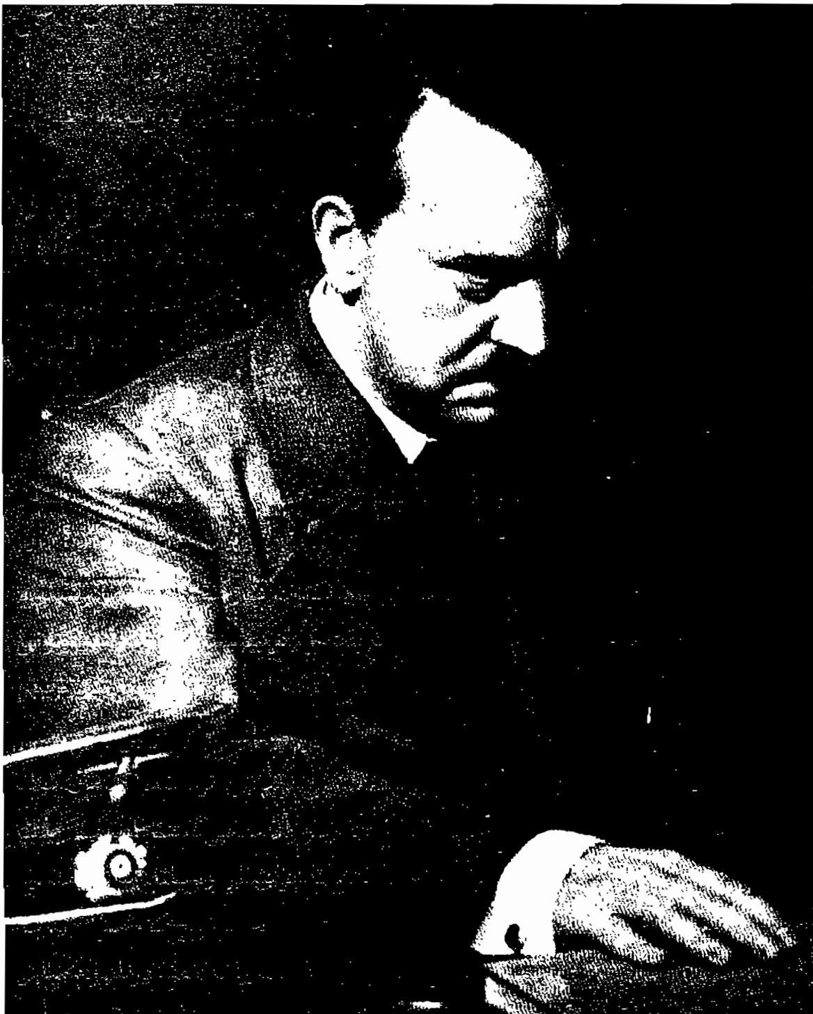
مجسمه ای از هیتلر در حال سوگند