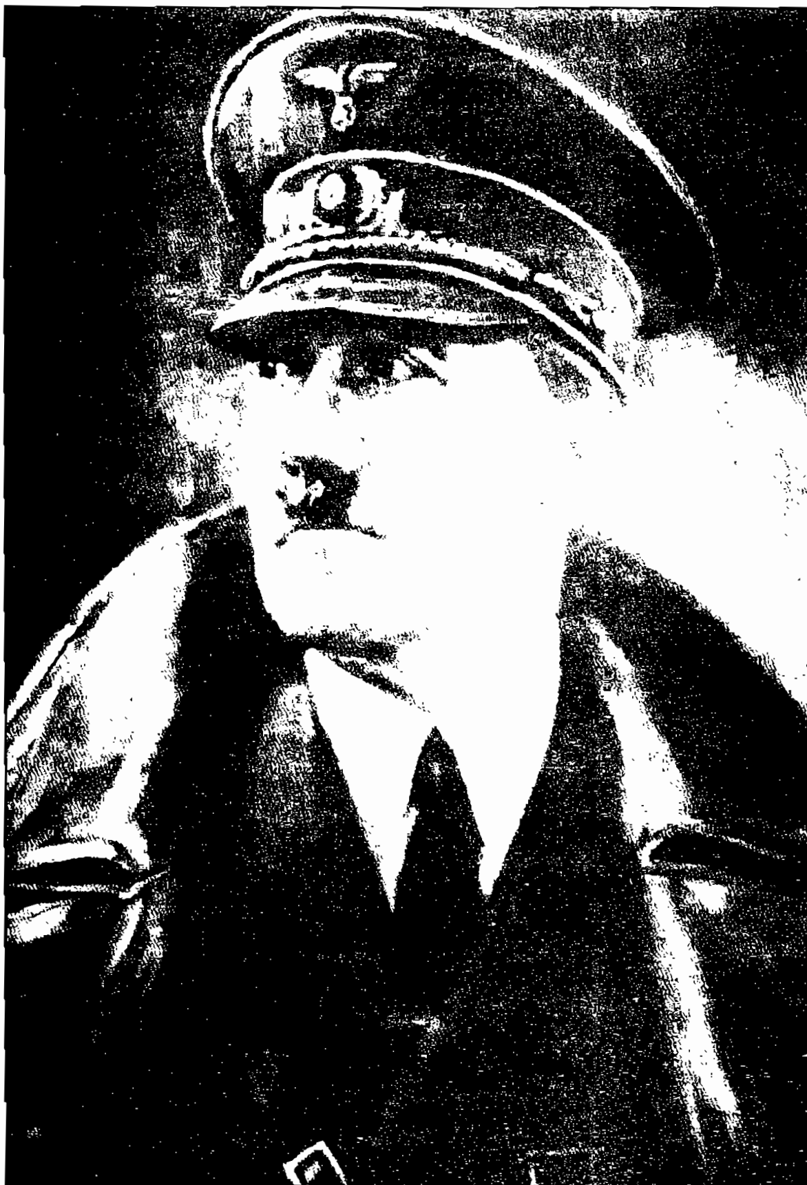
نقاشی ماندگار از دیکتاتور قرن