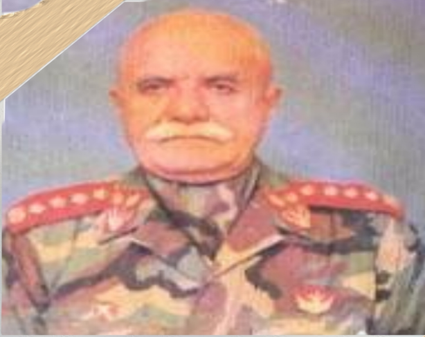
جنرال رحمت اللہ صافی