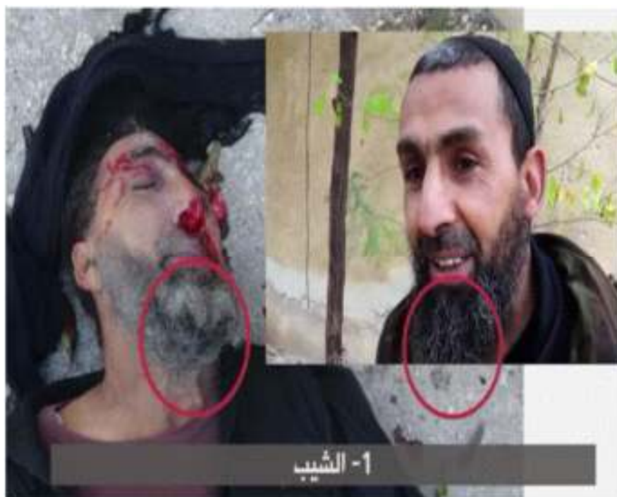
د مقتول د پيرې ويښتان سپين دي خو د تونسي ويښتان تور دي.