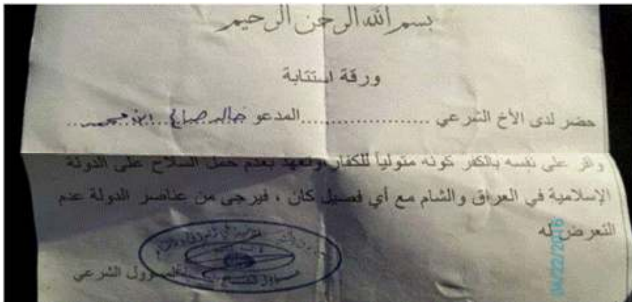
د پورتنی مضمون ژباړه:

د داعش په دين کې يواځې هغه وخت يو مسلمان د دوی له وحشت او ظلم څخه نجات موندلی شي چې د دوی په وړاندې په خپل کفر اعتراف وکړي. د صکوک الغفران په نوم هغه پاڼې اوکورې چې داعش يې په هغه خلکو تقسيموي چې دوی ته تسليميږي او يا په خپل کور اوسيدل غواړي.