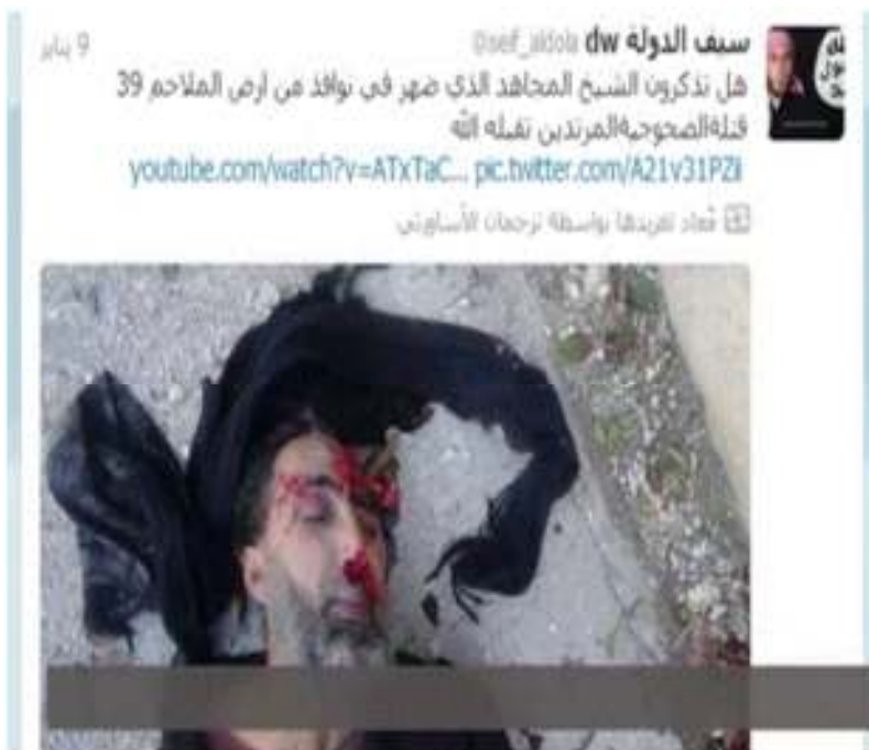
نوموري دا کس مهاجر بللی او د ده وژونکي پي مرتدين بللي.