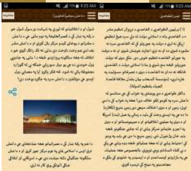
د کتاب د نشر و لوحق له ټولو مسلمانانو سره خوندي ده