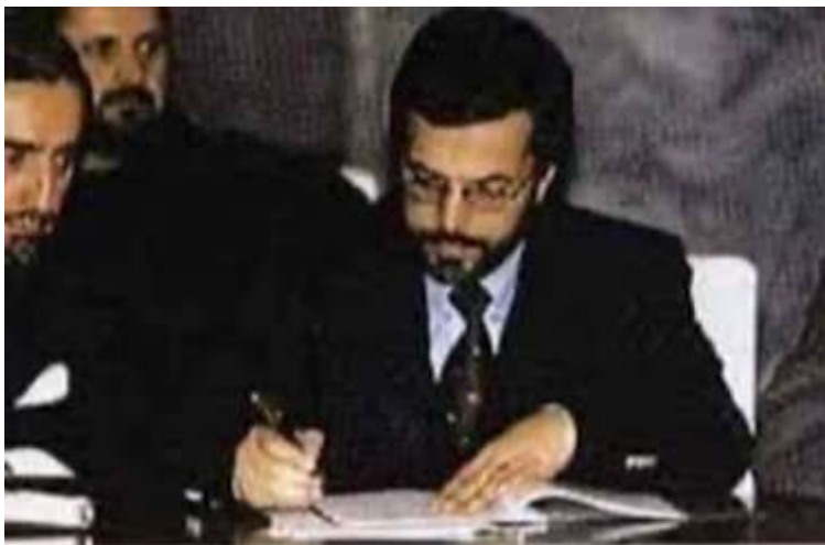
Der Innenminister Junus Kanuni (Bildmitte) unterstützt im Beisein von Außenminister Abdullah Abdullah und Verteidigungsminister Kasim Fahim (rechts) den Vertrag zur Zusammenarbeit der Streitkräfte auf dem Gebiet Afghanistans.

مجاهدینو او یو شمېر نورو فسادګرو یو ګډه ترکیب رامنځته کړ او دې ته یې د ((ملي وحدت)) د حکومت نوم ورکړ. د دې حکومت مشر اشرف غني بیا خپل واک ته دوامه تېری و، چې له کوم دقت او ځنډ پرته یې له امریکا سره امنیتي تړون لاسلیک کړ