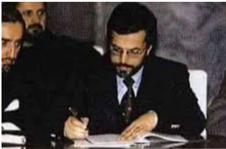
Der Innenminister Junus Kanuni (Bildmitte) unterstützt im Beisein von Außenminister Abdullah Abdullah und Verteidigungsminister Kasim Fahim (rechts) den Vertrag zur Entsendung von Streitkräften auf dem Gebiet Afghanistans.

مجاهدینو او یو شمېر نورو فسادګرو یو ګډه ترکیب رامنځته کړ او دې ته یې د ((ملي وحدت)) د حکومت نوم ورکړ. د دې حکومت مشر اشرف غني بیا خپل واک ته دوامه تېری و، چې له کوم دقت او ځنډ پرته یې له امریکا سره امنیتي تړون لاسلیک کړ