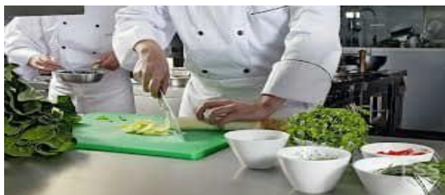
انځور- ( 16 )، غذا چمتو کونکي.

۴- عادتونه: د غذایي موادو د برابرولو په ځایونو کې باید له ټوخي اوپرنجی ، د خوړلو له بسته کولو څخه د مخه په هغی کې له لاس وهنی او د غذا برابرولو په ځایونو کې له سگرت څکولو څخه ډډه وشي.