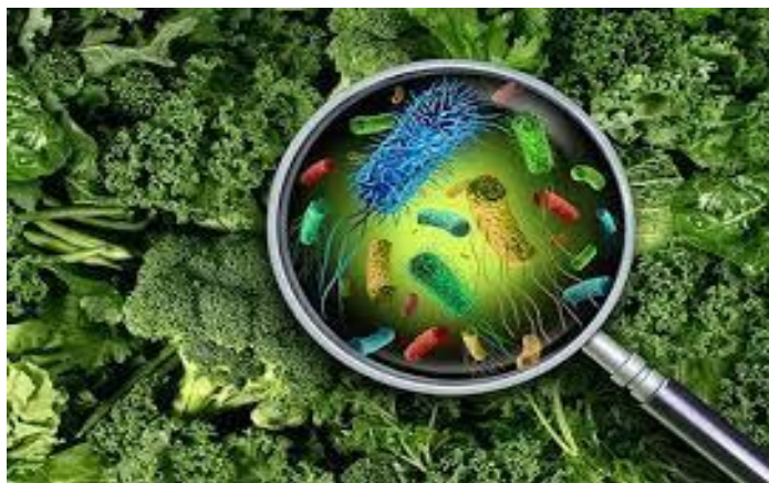
انځور- ( 6 ) ، په خوړو کې مختلف مايکرو اورگانيزمونه.

د خوړو څخه پيدا شوي ناروغی خورا عام دي او دا اړينه ده چې د دې ناروغیو د مخنيوي لپاره لاملونه او لارې وپيژنی ترڅو د دې ناروغیو له امله رامینځته شوي رنځ څخه ځان لرې وساتی. نو، راضي چې د دې ناروغیو د مخنيوي لپاره لارښوونې وپيژنو