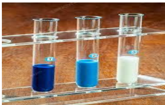
انخور - ( 8 )، د میتلین بلو تست.

له دي وجي دغه تست د ډیرو ملوثو شوو شیدو د پیژندلو په اړه ښه معلومات ورکوي او په شیدو کې د بکتریاوو د مسقیمی شمیرني (Direct count) په پرتله لږ وخت او کم مصرف ته اړتیا لري.