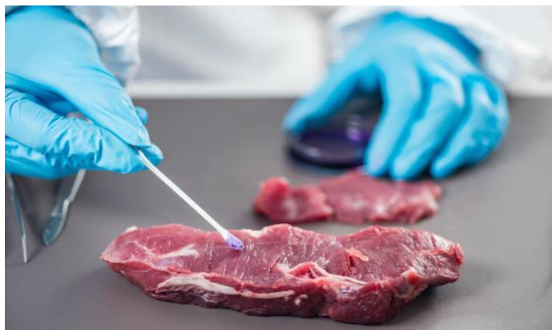
انځور- ( 11 )، د ښي غوښي يوه نمونه.

د ښي غوښي ځانگړتياوي دا دي چې بايد نه خاسفه گلابي او نه تيزه بانجاني شين رنگه وي، په لمس سره شخه او ربرينه نه وي همدارنگه ډيره پسته نه وي او بد بوی ونلري.