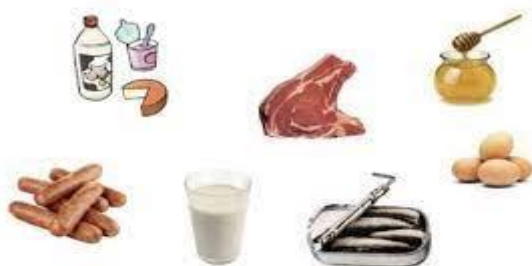
انځور- (2) ، د خوړو حيواني سرچينه .

ته راغلي توليدونه هم خوړل کېږي. د بيلگي په توگه شيدي د ډېرو کورنيو ژويو نه ترلاسه کېږي ، هر څوک يې څښي او په فارمونو کې د شيديو نه نور شيان لکه پنېر او کوچ هم لاسته راځي، مرغان او چرگان هگۍ اچوي، او دا بيا بل داسي خواړه دي چې د ژويو نه لاسته راځي. نه ترلاسه کېږي ، هر څوک يې څښي او په فارمونو کې د شيديو نه نور شيان لکه پنېر او کوچ هم لاسته راځي، مرغان او چرگان هگۍ اچوي، او دا بيا بل داسي خواړه دي چې د ژويو نه لاسته راځي.