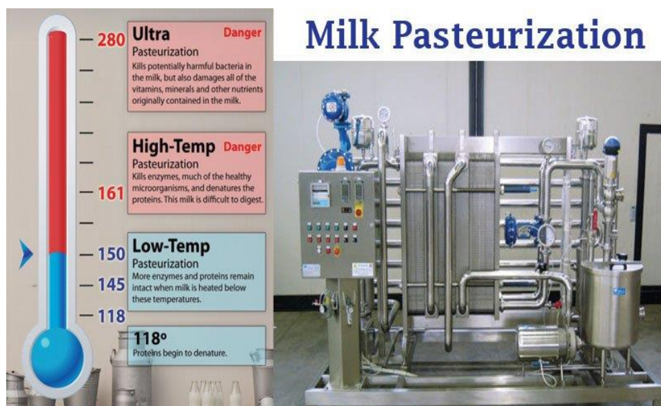
انځور- (9)، د شیدو پستورایزه کول.

۳- د UHT میتود: چي د Ultra-High Temperature Method میتود په نوم هم یادیږي ، په دي میتود کي شیدو ته په ۲ پړاونو کي په ګړندی ډول تر ۱۲۵ درجي سانتي ګرید د څو ثانیو لپاره حرارت ورکول کیږي، او وروسته په ګړندی ډول یخي او په بوتلونو کی اچول کیږي.