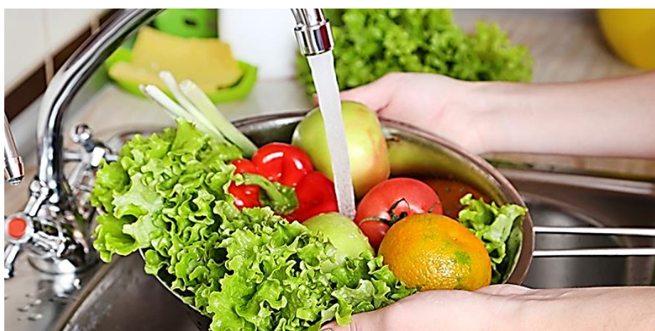
انځور- ( 14 ) ، د سبزیجاتو او میوو پاک پریمنځل.

میوی او سبزیجات هم د پتوجنیکو بکتریالو او پرازیتونو (پروتوزوا، چنجی) د خپریدو عمده منبع تشکیلوي. دا انتانات هغه وخت په سبزیجاتو کي موندل کیږي چي د بدرفتونو د موادو څخه د آبیاری یا تقویه په منظور کار اخیستل کیږي. هغه سبزیجات چي د سلاتي په ډول خام خورل کیږي زیات خطرناکه او د ناروغیو سبب گرځي، ځکه نو خلکو ته باید پوهایي ورکول شي تر څو هغه سبزیجات چي اومه خورل کیږي د خورلو نه مخکي ښه و مینځي. هغه سبزیجات چي پخیري د دي خطر څخه خلاص دی.