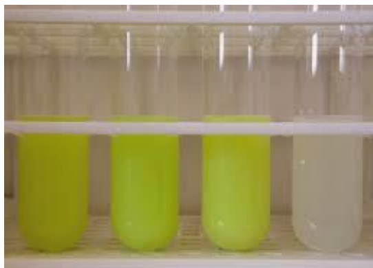
انځور- (10) ، د فوسفناز ټسټ.

۱- فوسفناز ټسټ: د دغه ټسټ څخه د Pasteurization د اغیزو د پیژندلو لپاره په پیرو ځایونو کی کار اخستل کیږي. دا ټسټ په دي نسبت ولاړ دی چې په خامو شیدو کی د Phosphatase په نوم یو انزایم شتون لري او دغه انزایم په هغه اندازه تودوخه او موده کی چې د Pasteurization لپاره اړین دي له منځه ځي. د Phosphatase انزایم په ۶۰ درجه سانتی گریډ تودوخه کی د ۳۰ دقیقو په موده کی په بشپړ ډول له منځه ځي. په دي لحاظ دغه ټسټ د ناکافي Pasteurization شویو شیدو یا هم په Pasteurized شویو شیدو کی د علاوه شویو خامو شیدو د پیژندلو لپاره په کار وړل کیږي.