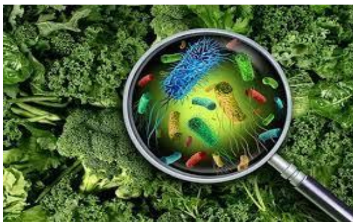
انځور- (6) ، په خوړو کې مختلف مایکرو اورګانیزمونه.

د خوړو څخه پیدا شوي ناروغی خورا عام دي او دا اړینه ده چې د دې ناروغیو د مخنیوي لپاره لاملونه او لارې وپېژنی ترڅو د دې ناروغیو له امله رامینځته شوي رنځ څخه ځان لرې وساتی. نو، راضي چې د دې ناروغیو د مخنیوي لپاره لارښوونې وپېژنو