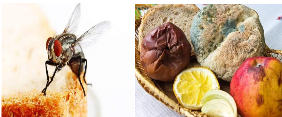
انځور- ( 19 )، د خوراكي توکو زهری کیدل.

دویم ډول هغه دي چې په خوراكي توکو باندې کیمیاوي مواد تولیدوي چې د خوراكي توکو د زهرجن کیدو سبب ګرځي . هرکله چې دا خوراكي توکي وخورل شي نو د زړه بدوالی ، کانګي کول او اسهال مینځ ته راوړي . بعضي وخت پښتورګي د کاره غورځوي او خبره تر مرګه پورې رسیري .