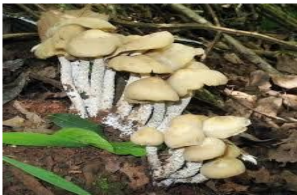
انځور- ( 21 )، زهري مرخيري.

مرخيريو يو ډول نبات دی چي بعضي نوعي زهري مواد لري . د زهرجنو مرخيريو تر خورلودوه ساعته وروسته دتسمم گيلي پيليري . چي کله نا کله پنځه سندرومونه رامینځته کوي .