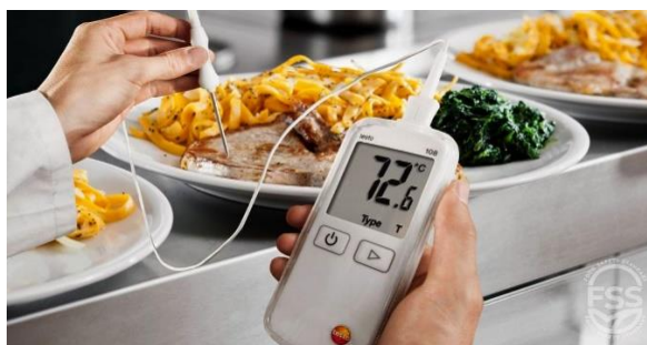
انځور- ( 17 )، د غذا سم پخول.

هغه بکتریاګانې چې د خړو دتسم د ناروغۍ سبب ګرځي د کوتې په تودوخه کې ډېر په چټکۍ سره تکثیر کوي نو باید خواړه هیڅکله په کوټه کې ونه ساتل شي. کوشش وشي چې په یخ ځای کې وساتل شي