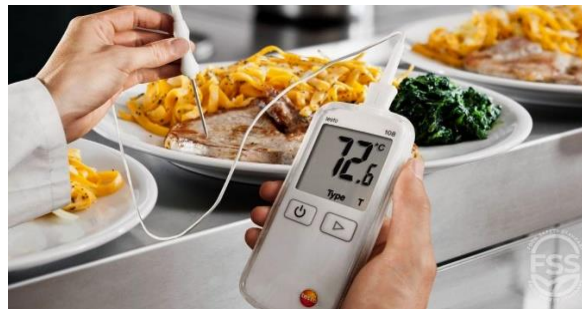
انځور- ( 17 )، د غذا سم پخول.

هغه بکتریاګانې چې د خړو دتسمم د ناروغۍ سبب ګرځي د کوتې په تودوخه کې ډېر په چټکۍ سره تکثیر کوي نو باید خواړه هیڅکله په کوټه کې ونه ساتل شي. کوشش وشي چې په یخ ځای کې وساتل شي