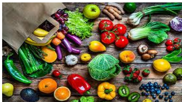
انځور- (1) ، د نباتاتو څخه لاسته راغلي خواره.

انسانان د بوټو ډېری برخې د خوړو په توګه کاروي. په دې کې د بوټو نژدې دوه زره بېلابېل توکمونې د خوړو لپاره کرل کېږي ، او ډېری یې زمونږ د ورځنیو چارو خواره دي چې د بېلابېلو فصلونو نه لاس ته راځي.