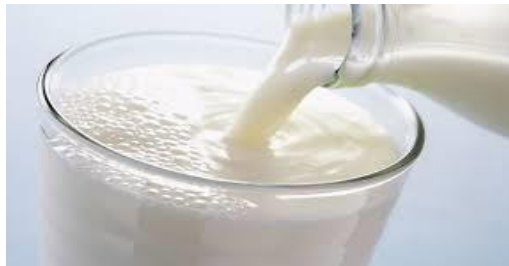
انخور- (7). پاکي شيدوي.

د شيدو بيخطر توب معمولا د شيدو د بکتریاوو په اندازه پوري اړه لري. د شيدو په بيخطر توب کي تر هر څه لمړی د حيوان روغتيا ارزښت لري، ځکه د روغ حيوان شدي ډير کم ميکرواورگانيزمونه لري چي ناروغی نشي توليدولای. په دوهم قدم کي د شيدو راغونډول ارزښت لري، ځکه د شيدو لوشلو پړوخت بايد د حيوان تيونه پاک او پټ وي او هم حيوان په پاک ځای کي ژوند وکړي. هغه اوبه چي د شيدو سره گډپيری بايد پاکي او د ميکروبيونو څخه عاري وي. د شيدو راغونډونکی او لوشونکی بايد ساری ناروغی ونلري او د شيدو لوشلو تر مخه بايد خپل لاسونه تر څنگلو ومينځی. که امکان ولري بايد د شيدو لوشونکی ماشين څخه گټه واخستل شي. تر لوشلو وروسته بايد سمدستي شيدوي يخي او ۱۰ درجي د سانتي گريد کي وساتل شي تر څو د بکتریاوو د تکثر مخه ونیول شي. همدا راز د شيدو په پاک ساتلو کي ټول هغه لوبني چي شيدوي پکښي انتقاليري بايد پاک وي. د دي لپاره چي مطمئن اوسو چي شيدوي پاکي دي نو د يو تست څخه چي د Methylene Blue Reduction Test په نوم ياديري گټه اخيستل کيري.