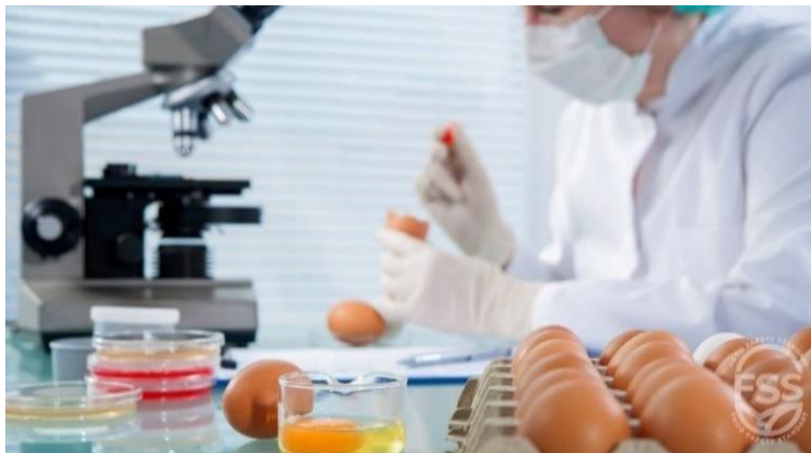
انځور- ( 13 )، د هګی څخه نمونه اخيستل.

ځيني فارم داران چې توليد د لګښت له حد څخه ډير لري نو غواړي چې يوه اندازه هګی ذخيره کړي ؛ نو د پاستوريز کولو له ميتود څخه کار اخلي ، په دی ميتود کې هګی د پينځو ثانيو لپاره په جوشو اوبو کې ايښودل کيږي . او وورسته يې بيا بيرته سروی ، چې بيا په يخچال يا سره خونه کې ساتل کيږي ، په دی طريقي سره يو پورتنی پور د هګی د سپين کلکيږي او د هګی منځ ته د مايکرو ازګانيزمونو د ننوتلو مخنيوی کوی . د پاستوريز کولو په طريقه کې هګی د دري دقيقو لپاره په (۵،۶۲) درجو تودو اوبو کې ايښودل کيږي ، يا په (۶۴) درجو کې د دوه دقيقو لپاره ايښودل کيږي ، چې د هګی سطحې مايکرو اورګانيزمونه له منځه ځي خو البومين خپل کيفيت ساتی . معمولاً د هګیو پاستور کول وروسته تر وينځلو ترسره کيږي .