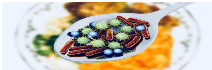
انځور- ( 20 )،مختلف پرازیتونه چې د خوړو زهري کیدو سبب گرځي.

دا پرازیت هم د غذا د زهرجن کیدو سبب گرځي . بالخصوص د اوبو د زهرجن کیدو سبب گرځي . دا پرازیت د حاد ناروغیو سبب گرځي چې په لویه پیمانه اوبلن نس ناستی ورسره وي دتفریح دوره یې د ۲-۴ هفتو پورې ده . د ناروغی دوام د ۳-۴ ورځو پورې دوام کوي . په هغو خلکو کې چې ضعیف معافیتي سیستم لري دا ناروغی تر ډیر وخت پورې پکې اوږدېدای شي . انتقال یې د غیرې صحي اوبو او ناپاکه خوړو په واسطه دی .