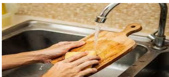
انځور- ( 15 )، د غذا جمتمو کولو مخکې او وروسته د لوبښ وينځل.

په منظم ډول د پخلي ټول توکي د کارولو د مخه او وروسته ومينځئ او پاک کړئ د پخلي لوبښي او وسایل لکه د کټ کولو تختې، چاقو او مکسر بايد د خوړو د سمبالولو په وخت کې په بشپړه توگه پاک شي. د بېلگې په توگه، د خام چرگ او سبزيجاتو د پرې کولو تر منځ يا بايد جلا جلا تخته وکارول شي يا په بشپړه توگه پاکه شي. که دا کار ونشي، د خام چرگ باکتريا به سبزيجات اخته کړي او د خوړو کراس ککړتيا به واقع شي.