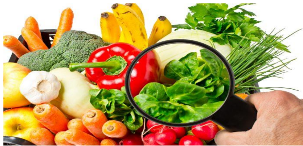
انخور- (4) ، د مختلفو خوراكي توکو حفظ الصحة.

پلورلو لپاره چمتو شي. د پروسس په جريان كې، خواړه د بيولوژيكي، فزيكي، كيمياوي، او د الرجي ككړتيا لپاره زيان منونكي دي. د خواړو د حفظ الصحي معيارونه په عمده ډول د خواړو بيولوژيكي ككړتيا مخنيوي لپاره شرايط، مقررات او پروسيجرونه پوښي چې د خواړو څخه رامینځته شوي ناروغيو لامل كيږي. دا اقدامات د خوړو د سم مدیریت، د پاكولو بشپړ فعالیتونو، د كراس ككړتيا مخنيوی، او داسې نور پورې اړه لري. پرته د موندلو وړتيا او په سمه توگه لیبیل كول د خوړو خونديتوب مدیریت برخه ده، مگر د خوړو د حفظ الصحي معيارونو كې اړين دي.