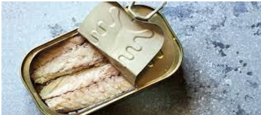
انځور- ( 12 )، کنسروا شوی کب.

کله چې کنسروا شوی (په قطی کې بند شوی) کب یا کنسروا شوي غوښه یا نور خواړه پلټی نو لاندې نکاتو ته باید پاملرنه وشي. قطی باید نوي، پاکه وي، سوری شوي نه وي او زنگ نه وي وهلی داسې نښې نښانې نلري چې د قطی خلاصونکي آلي په واسطه د قطی د خلاصیدو هڅه شوي وي. د قطی د خلاصیدو پر مهال باید د قطی د محتویاتو څخه هغه مهال استفاده ونشي چې په ترکیب کې یې د خنثی کیدو (Decomposition) نښې ولیدل شي.