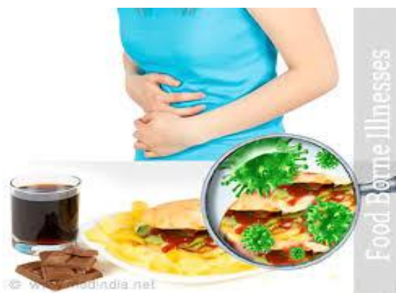
شکل 23 ، د خوړو څخه خپریدونکي ناروغی

د خوړو څخه خپریدونکي ناروغی چې د poisoning food په نامه سره هم یادیری هغه وخت منځ ته راځي چې یو څوک د مټابو خوړو او یا مایکروبیولوژیکی زهر و څخه استفاده وکړی. په معمول ډول سره پدی مایکرواورگانیزمونو کی بکتیریا ، پرازیتونه او وایرسونه شامل دی.