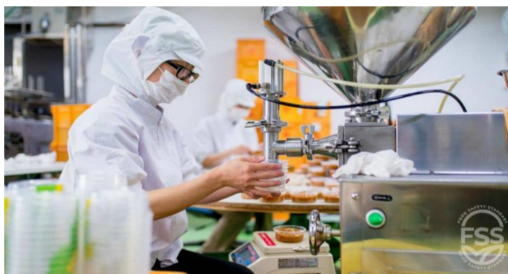
انځور- (3) ، د خوړو خوندي پرویس کول.

دلته لسگونه فکتورونه شتون لري چې کولی شي د خوړو خونديتوب له گواښ سره مخ کړي ، او هر یو یې باید په جلا توگه وڅیرل شي. د خوړو خونديتوب یو له اصلي اصولو څخه حفظ الصحة ده.