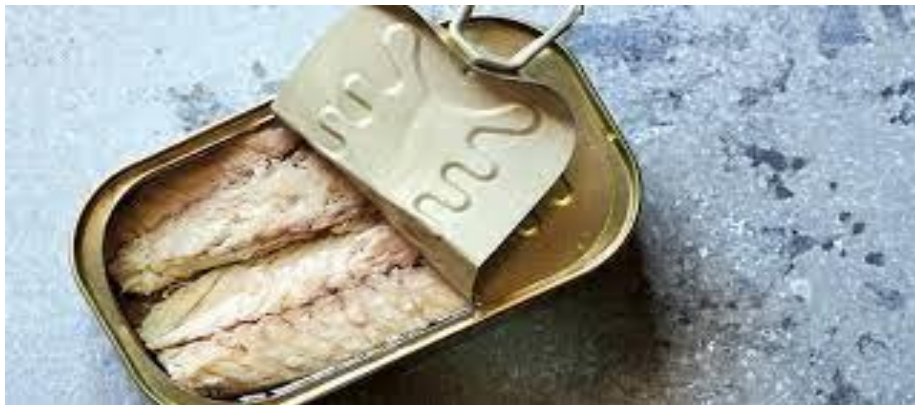
انځور- ( 12 )، کنسروا شوي کب.

کله چې کنسروا شوی (په قطی کې بند شوی) کب یا کنسروا شوي غوښه یا نور خواړه پلټی نو لاندې نکاتو ته باید پاملرنه وشي. قطی باید نوي، پاکه وي، سوری شوي نه وي او زنگ نه وي وهلی داسې نښې نښانې نلري چې د قطی خلاصونکي آلي په واسطه د قطی د خلاصیدو هڅه شوي وي. د قطی د خلاصیدو پر مهال باید د قطی د محتویاتو څخه هغه مهال استفاده ونشي چې په ترکیب کې یې د خنثی کیدو (Decomposition) نښې ولیدل شي.