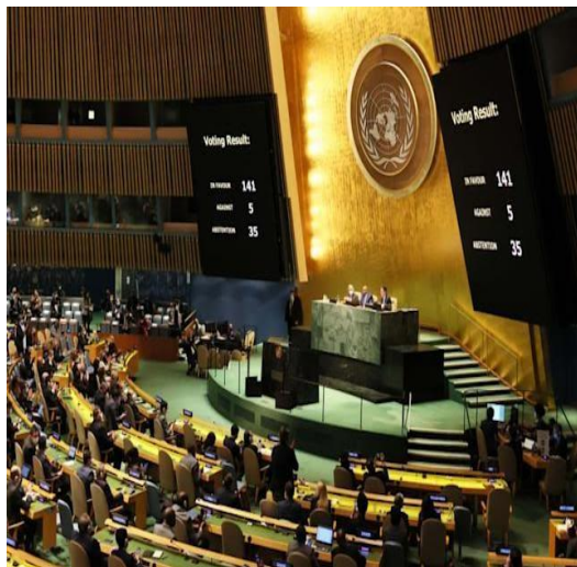
(۶) د اوکراین په وړاندې د روسیې یرغل ته د ملگرو ملتونو د عمومي اسمبلی رایې کړې په حال کې