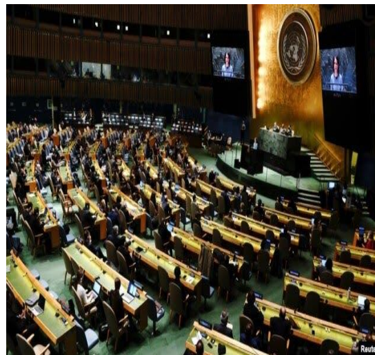
(۵) دملگرو متونو د عمومي اسمبلی مقر نیویارک امریکا