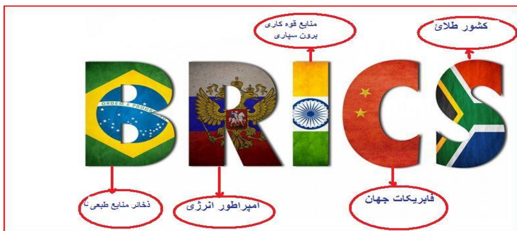
(۵) په عکس کې د عضوه هیوادونو یوه یوه مهمه ځانگړنه په سره خط کې تاو شوي