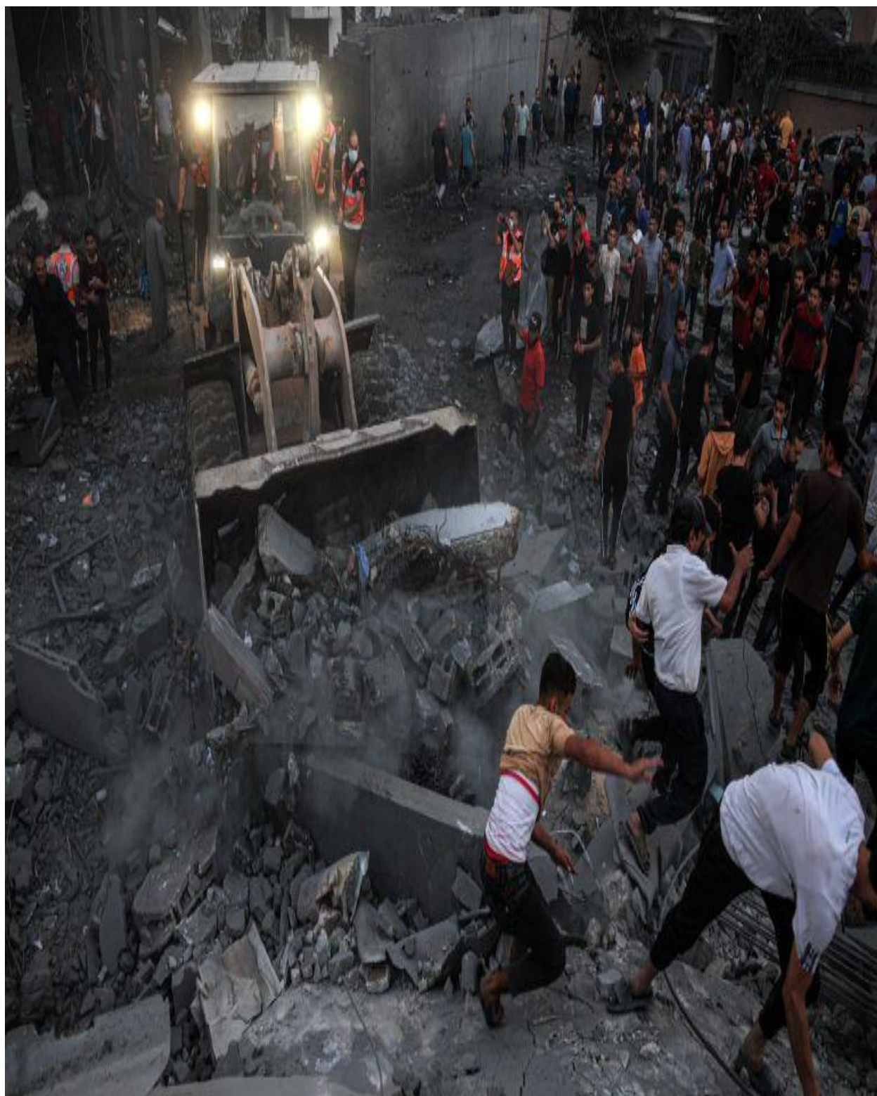
دغزي بناړ ويجاړی .