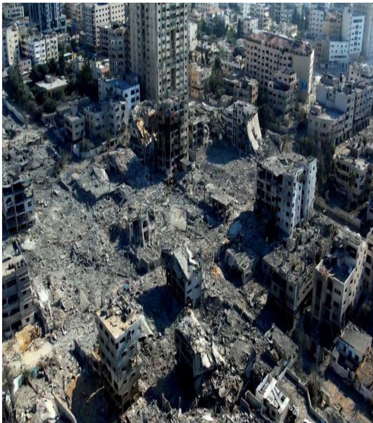
دغزی بنار ویجاری .