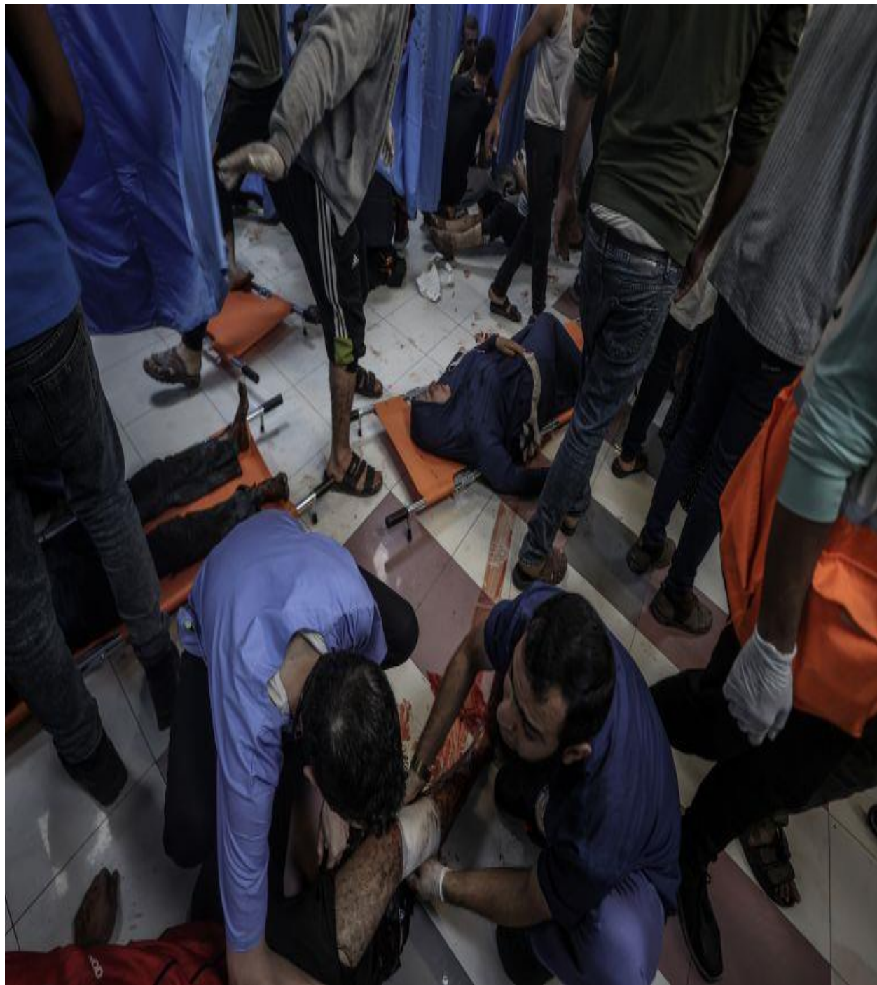
اسرائيلي بمباريه معمدانى روغتون كې 500 بيگناه فلسطينيان په شهادت ورسيدل .