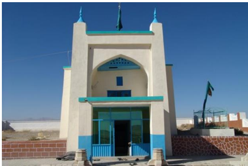
د پوی بهلول مقبره د غزني ولايت زور ښارکي