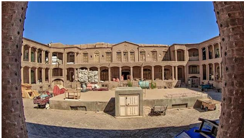
د هرات کاروان سراي انځور د مفکورې ورکولو په اړه

د صفویانو په دوره کې د کاروانسرایونو په منځ کې د شاه عباسي کراچ کاروانسرای دی چې د شاه سلیمان صفوي په وخت کې د ۱۰۷۸ او ۹۱۱۰ ترمنځ جوړ شوی و.