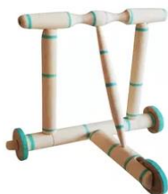
تصویری از پای روانک چوبی قدیمی

در خانه برادران و خواهر با او کمک مینمودند تا او راه رفتن را یاد گیرد.