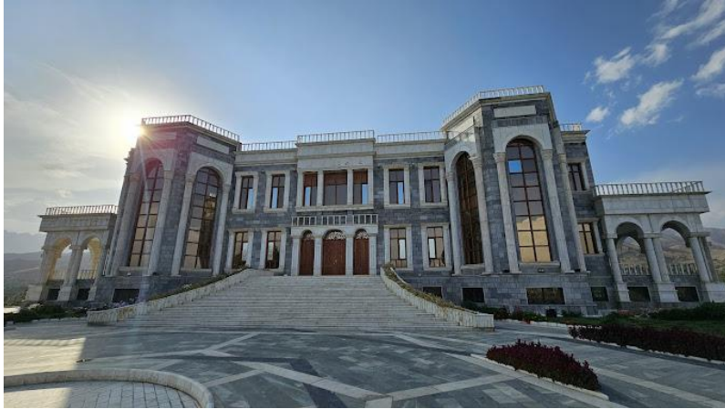
تصویری از قصر مرمین تپه پغمان