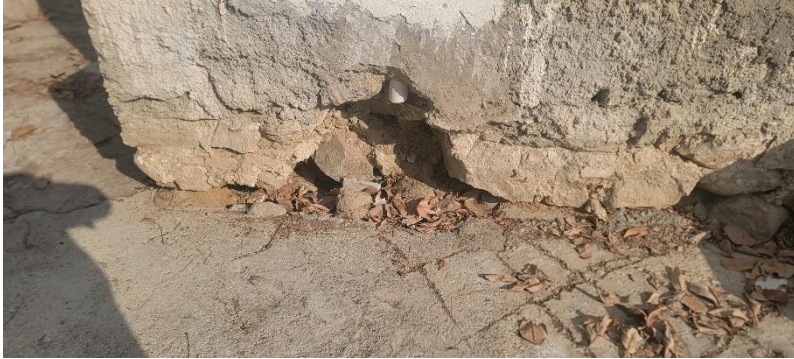
تصویر ریخته گی در قسمتی از تهداب ساختمان حرمسرا