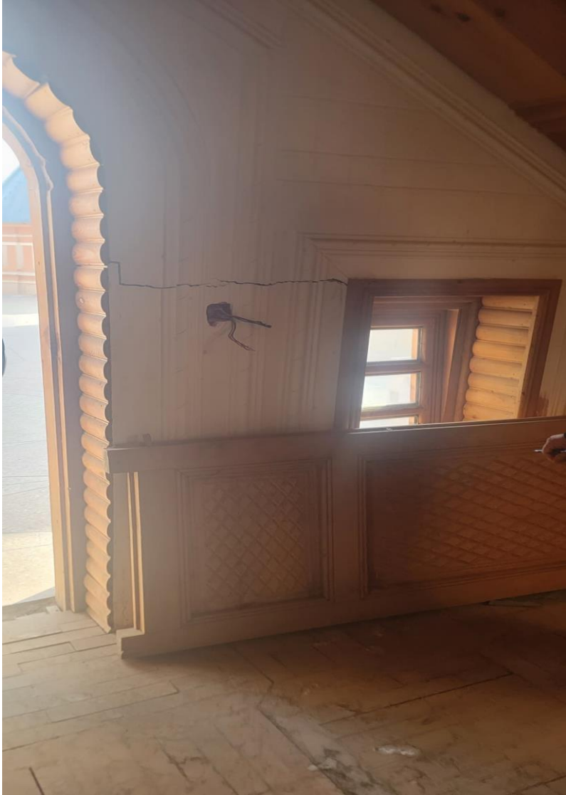
تصویری از ترک (درز) افقی در ساختمان حرمسرا