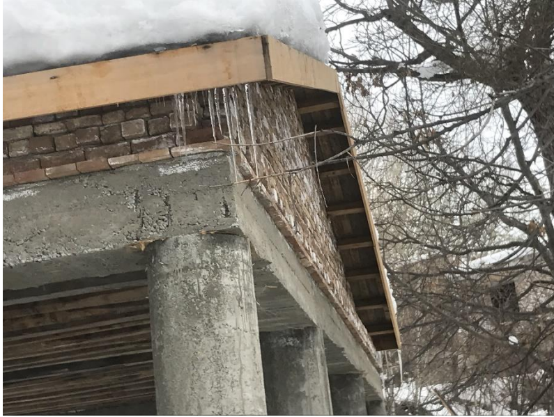
تصویری از چوب تره مستطیلی واقع بالا باغ پغمان