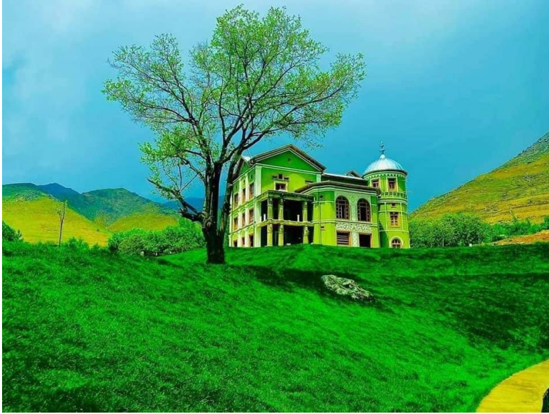
تصویری از بالا باغ پغمان