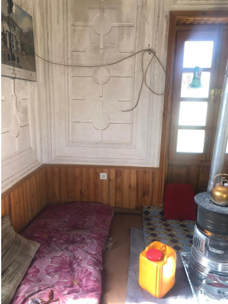
تصویری از قسمتی داخلی قصر تاجدار در بالاباغ بامان