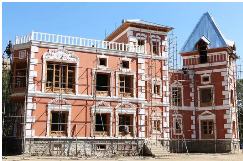
تصویری از قصر حرمسرا در بالاباغ پغمان

تزئین یا المنت کار شده در نماها یا رویکارهای ساختمان حرمسرای توجه هر بیننده را به خود جلب مینماید، رنگ سفید بدون تحرک و رنگ گرم نظر به اصول معماری در جای درست و مناسب آن کار گردیده است ولی چیزی که سبب کاهش در کشش و زیبایی در تزئین میگرد همانا مقیاس (سکیل) بزرگ و یاهم شکل (فارم) استفاده آن در جاهای غیر ضروری و یا استفاده بیش از حد در تزئین است.