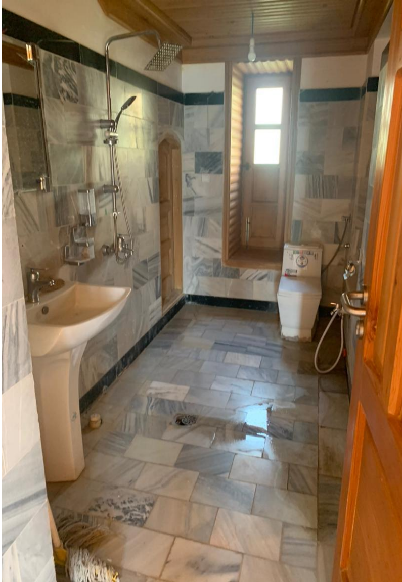
تصویری از ساختمان داخلی حمام و تشناب