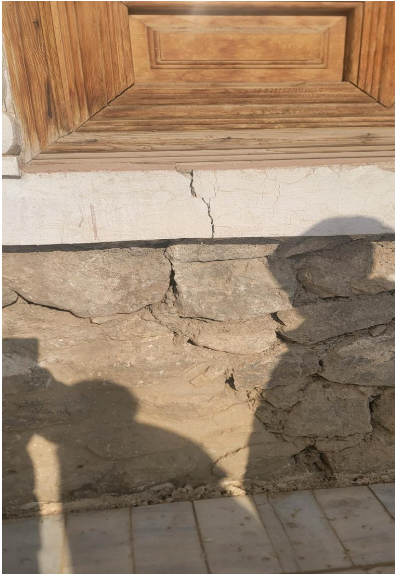
تصویری از ترک (درز) عمودی در ساختمان حرمسرا