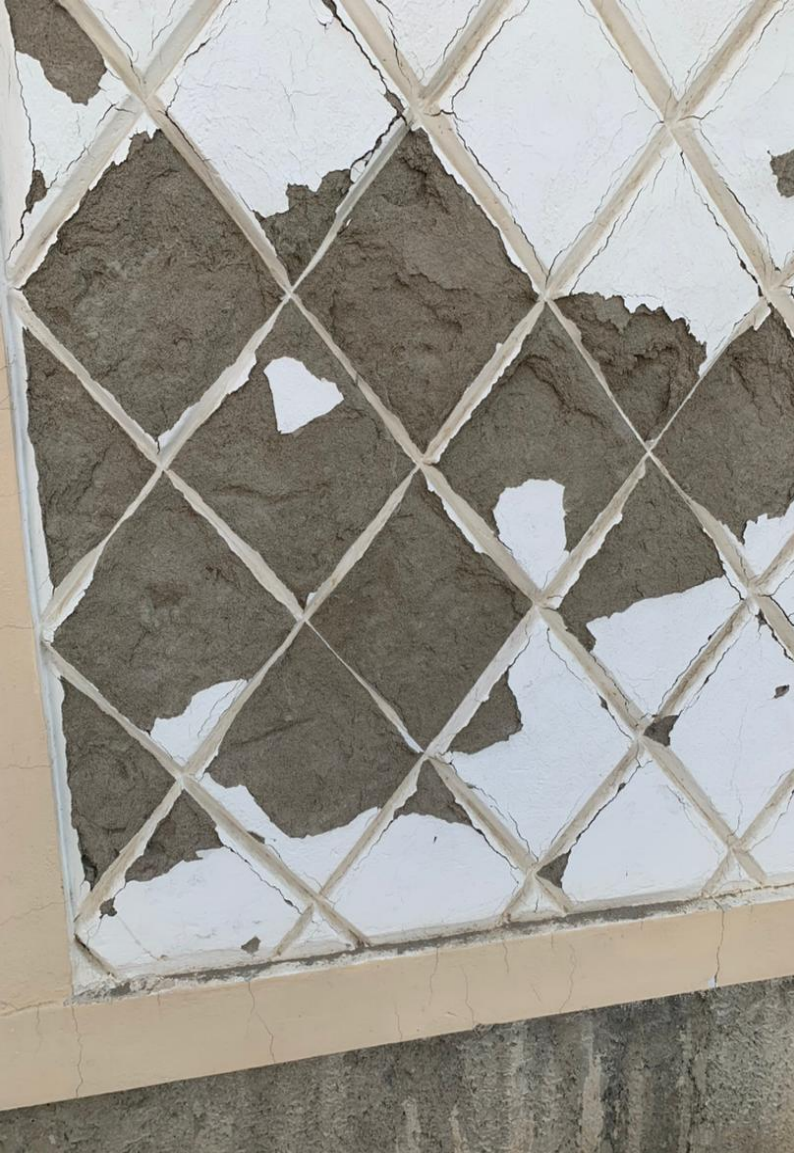
تصویری از ریخته گی پلستر تزئینی