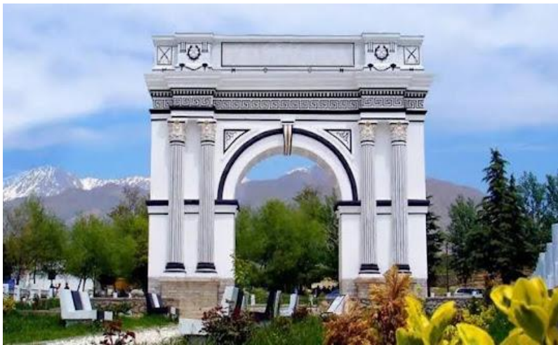
تصویری از تاق ظفر ولسوالی پغمان