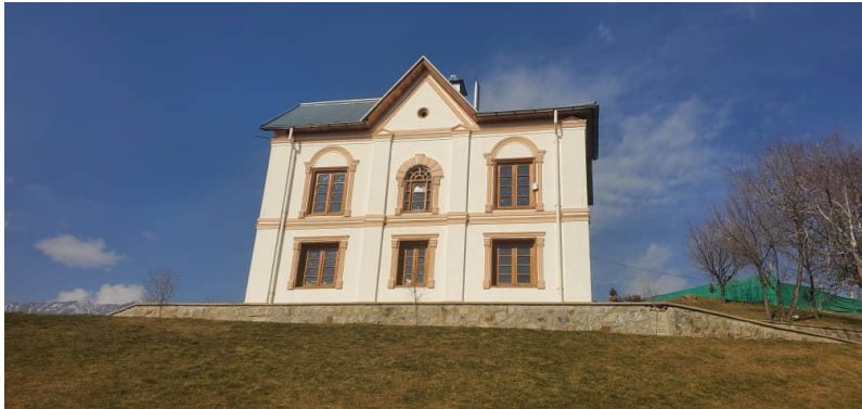
تصویری از پایان کار باز سازی بالا باغ پغمان