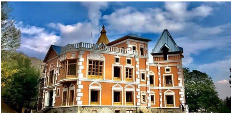
تصویری از قصر حرمسرا در بالاباغ پغمان