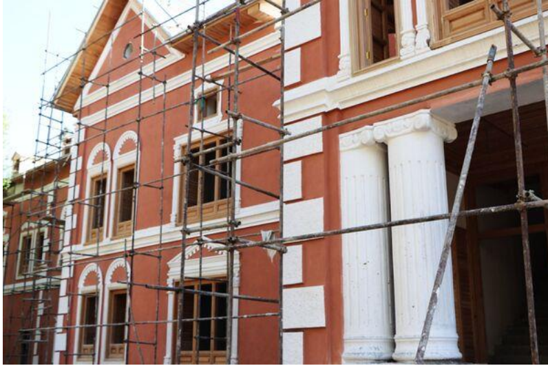
تصویری از قصر حرمسرا در بالاباغ پغمان