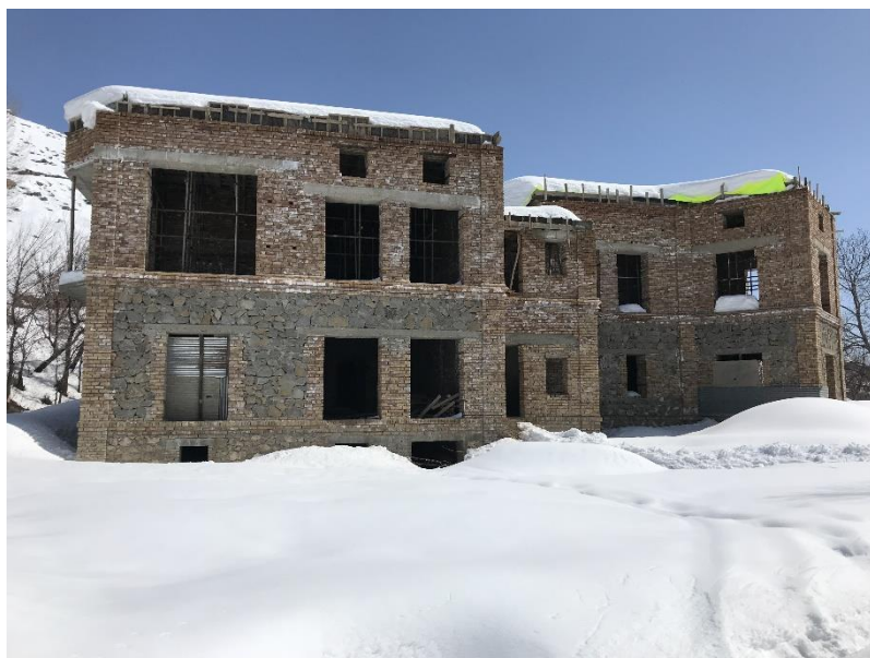
تصویری از قصر حرمسرا در جریان ساختمان

..... چیزیکه قابل یاد آوری درین قصر است همانا عدم تناسب و تطبیق دروازه ها و کلکین های رویکار آن است که اندازه های عرض و ارتفاع آن با هم یکسان نبوده و تا دقت نشود، تفکیک آن هم کاری آسان نیست، این نواقص جزیی که میتوان در وقت تطبیق اصلاح میشد، صرف توسط چشم معماران و انجنیران با تجربه قابل تفکیک است.