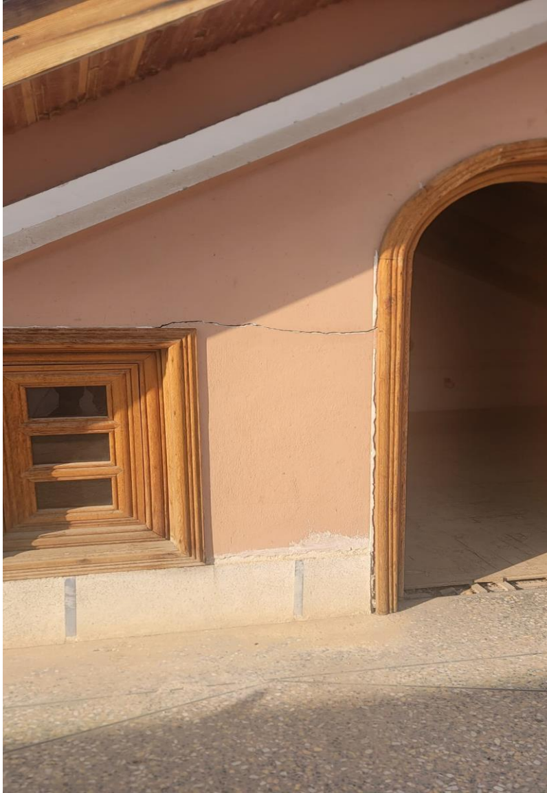
تصویری از ترک (درز) افقی در ساختمان حرمسرا