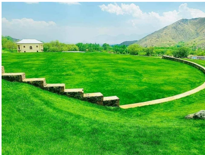
تصویری از بالا باغ پغمان