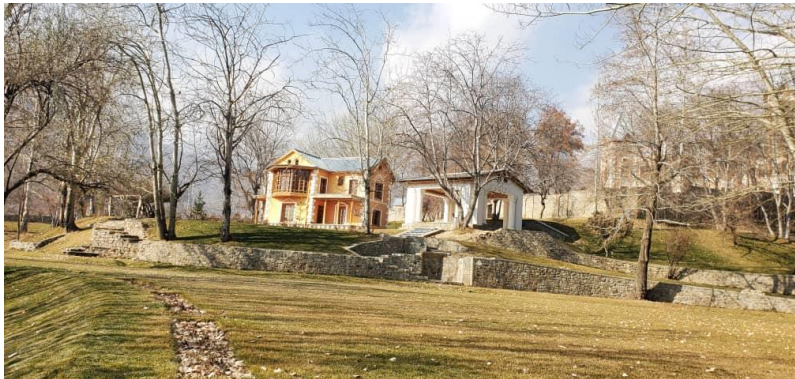
تصویری از پایان کار باز سازی بالا باغ پغمان