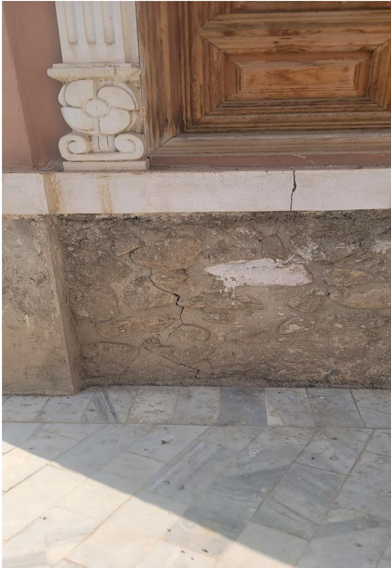
تصویری از ترک (درز) عمودی در ساختمان حرمسرا