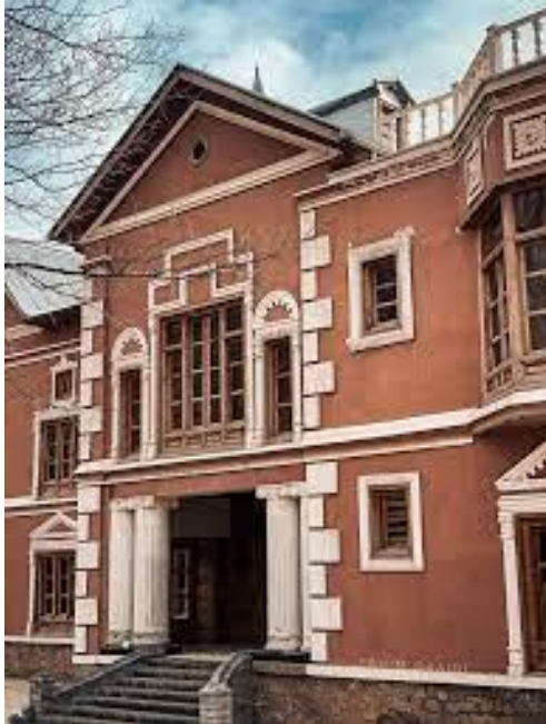
تصویری از قصر حرمسرا در بالاباغ بامغان