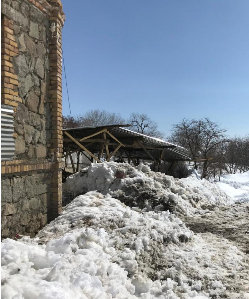
تصویری از قصر حرمسرا در جریان باز ساختمان