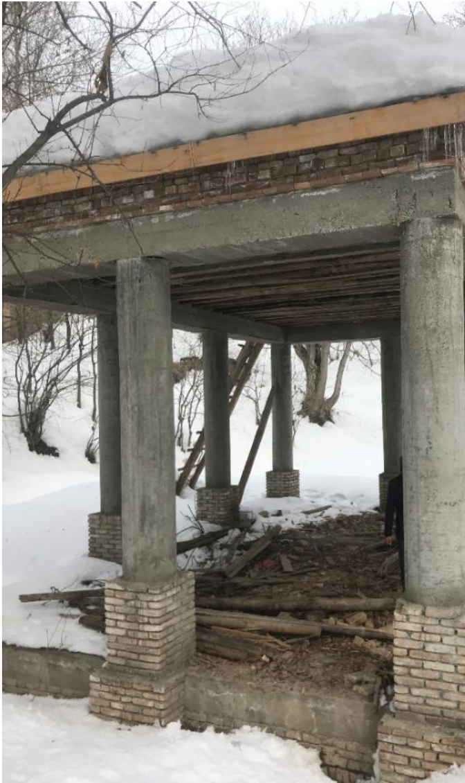
تصویری از چوب تره مستطیلی واقع بالا باغ پغمان