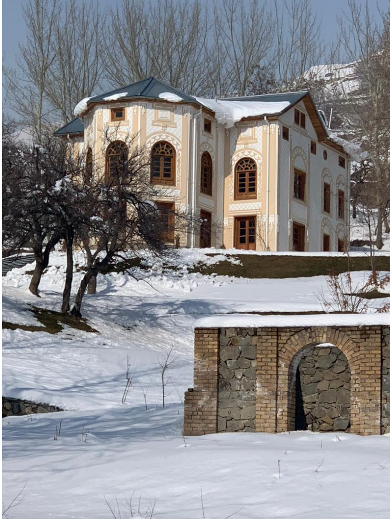
تصویری از جریان کار باز سازی بالا باغ پغمان