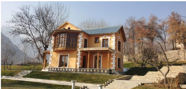
تصویری از پایان کار باز سازی بالا باغ پغمان