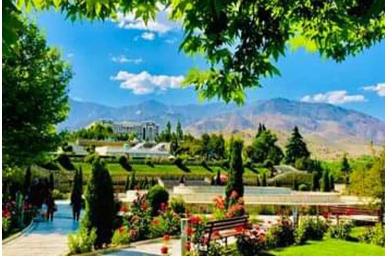
تصویری از تپه پغمان