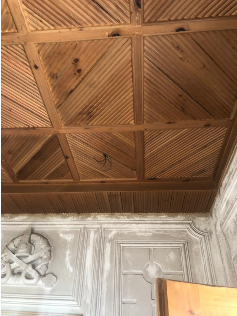
تصویری از سقف قصر تاجدار در بالاباغ پغمان