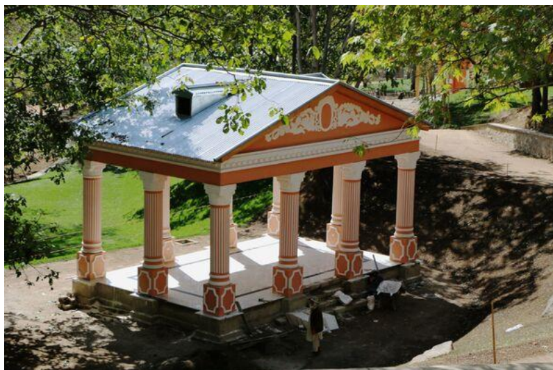
تصویری از چوب تره مستطیلی واقع بالا باغ پغمان