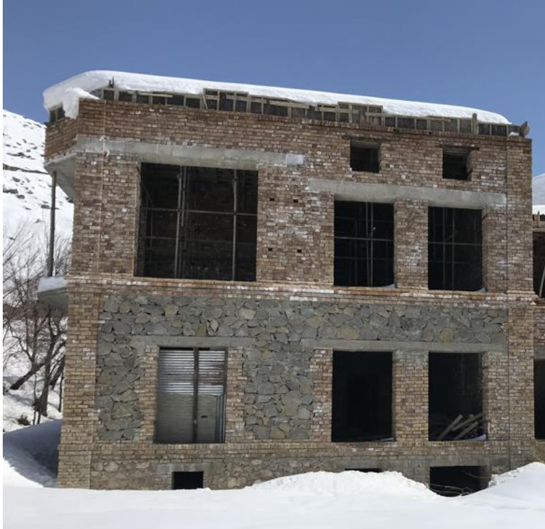
تصویری از قصر حرمسرا در جریان ساختمان