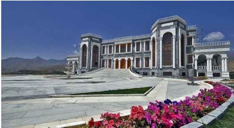
تصویری از قصر مرمین تپه پغمان

ناگفته نباید گذاشت که در فصل های بهار و تابستان خصوصاً جمعه ها مردم زیاد کابل و ولایات برای میله به این مناطق زیبا می روند. نکته ای که باید خاطر نشان کرد این است که اکثراً مردم کابل و ولایات برای میله (گردشگری) به دره پغمان می روند اما قریه هایی