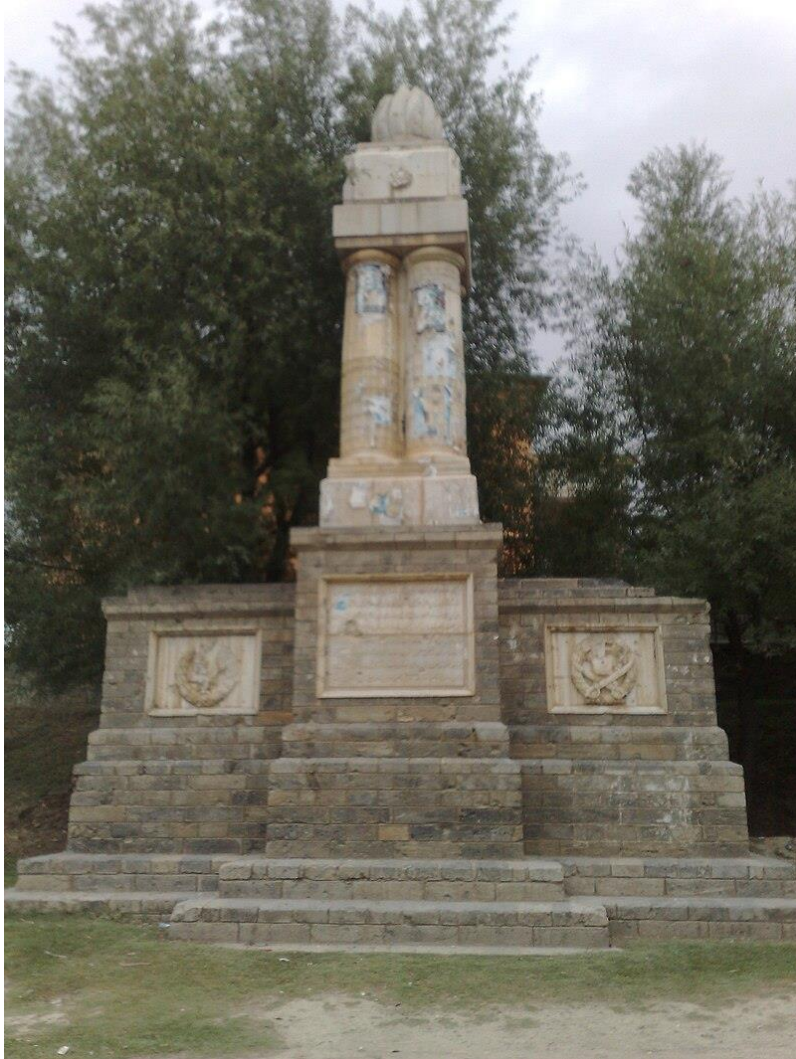
تصویری از بنای یادبود (مانومنت) در ولسوالی پغمان