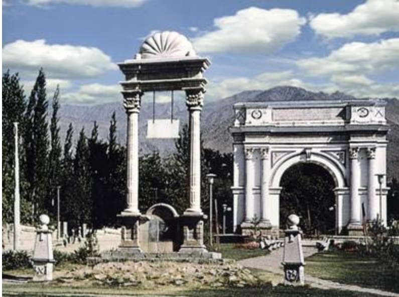
تصویری از تاق ظفر ولسوالی پغمان