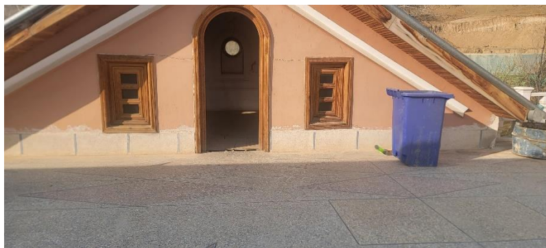
تصویری از ترک (درز) افقی در ساختمان حرمسرا

با تیم متخصصان دکتر فیکسیت که در زمینه راه حل های ضد آب و حفاظت از خانه آموزش دیده اند، یک تماس مشاوره سریع می تواند راه حلی برای جلوگیری از آسیب های قابل توجه، نفوذ آب و هزینه های ناخواسته باشد. امروز با پر کردن فرم زیر با دکتر فیکسیت تماس بگیرید. (۳)