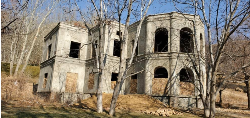
تصویری از جریان کار باز سازی بالا باغ پغمان

..... این امر باعث آن شده تا کارهای تزیینی غیر ضروری و یا هم با کیفیت پایین در رویکار ساختمان ها انجام و در انتخاب رنگ و قسمت برجستگی و فرورفتگی آن کار غیر معماری تخیلی انجام و از زیبایی آن کاسته شود.