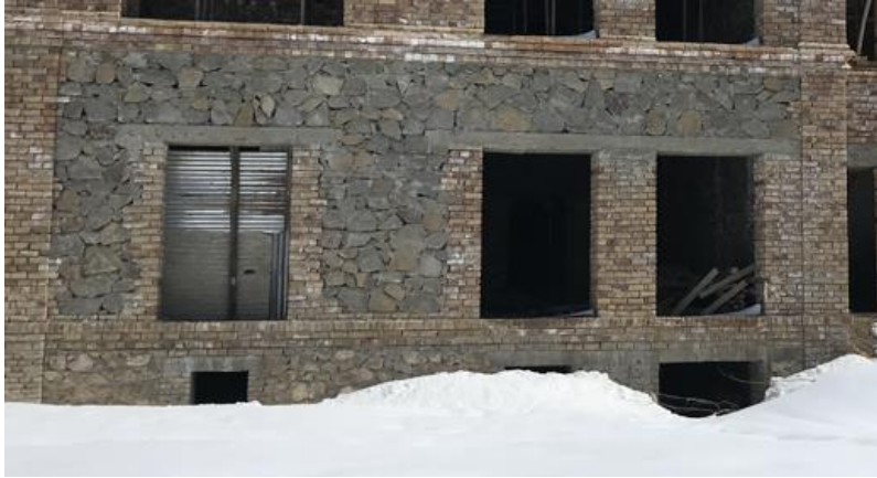
تصویری از قصر حرمسرا در جریان ساختمان