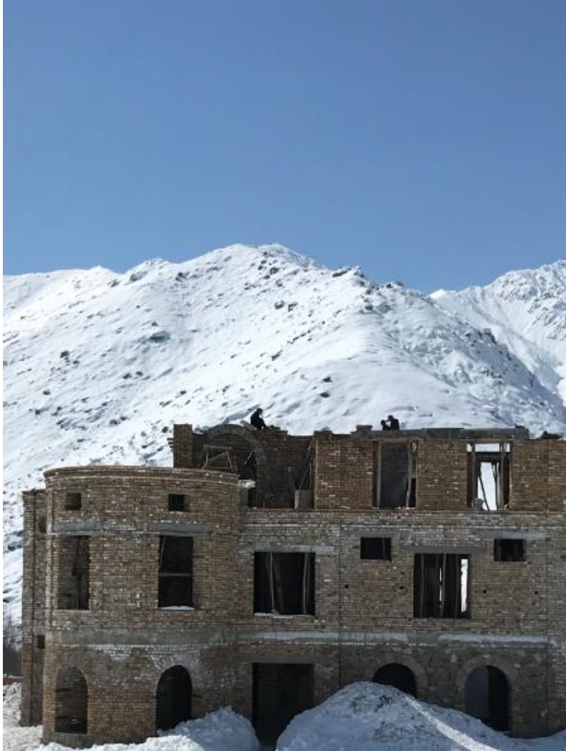
تصویری از قصر حرمسرا در جریان ساختمان