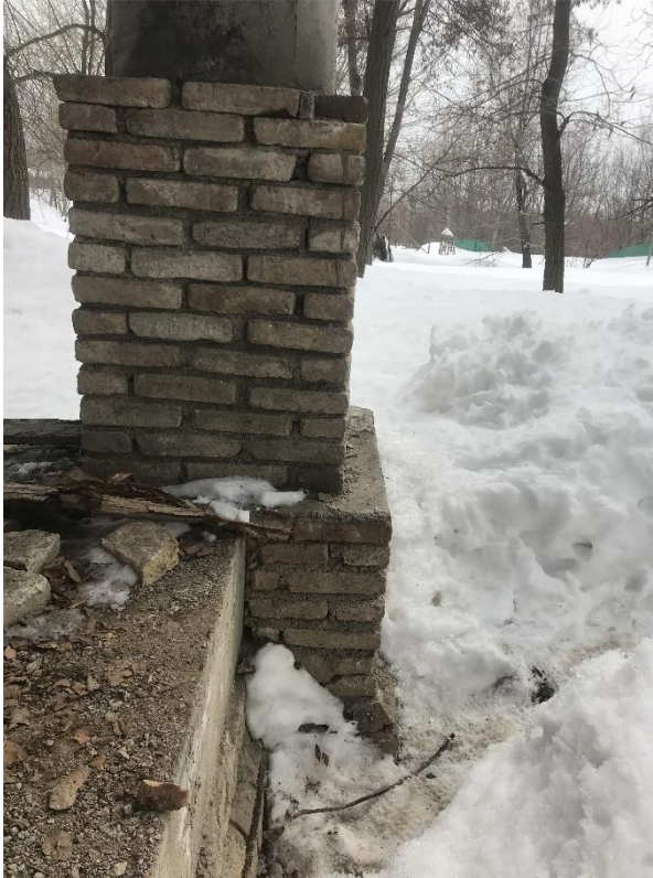
تصویری از چوب تره مستطیلی واقع بالا باغ پغمان