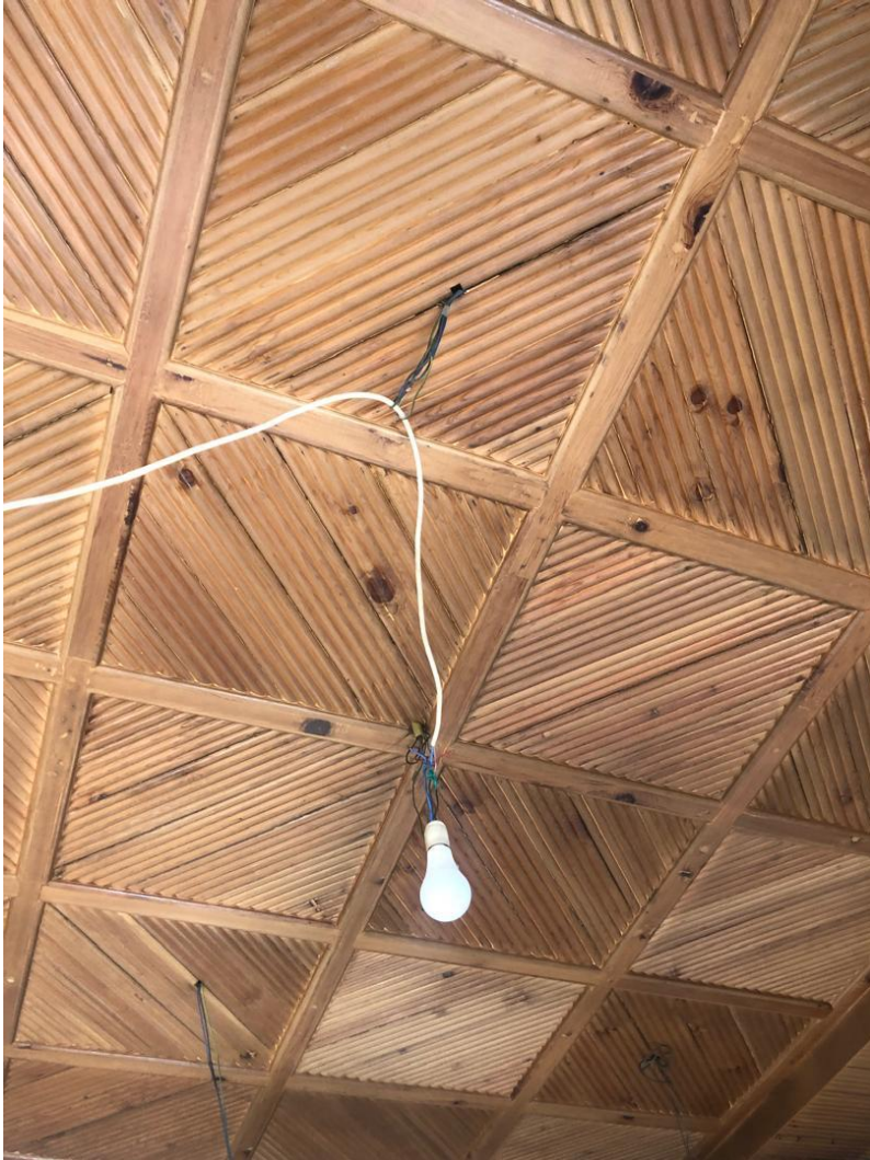
تصویری از مسطح سقف داخلی قصر تاجدار در بالاباغ پغمان