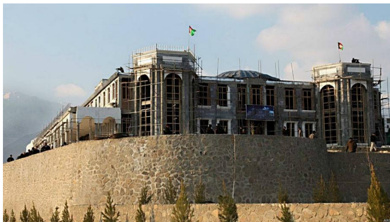
تصویری از قصر مرمین تپه پغمان

درهٔ پغمان در میان خود دو درهٔ کوچک دارد. نام یکی از آن‌ها درهٔ راست و دیگری درهٔ چپ است. دریای کابل از همین درهٔ پغمان سرچشمه می‌گیرد که در کتاب‌ها بنام درهٔ اونی پغمان ذکر شده‌است. در مرکز پغمان به فاصلهٔ سه (۳) کیلومتر دورتر، جوار قلعهٔ شیخ میر یک تپه قرار دارد که از آن تپه به نام تپهٔ پغمان یاد می‌شود و یک جای زیبا و تفریگاه فامیلی برای افغان‌هاست که در سال ۱۳۹۲ قصر مرمین بالای این تپه اعمار گردید تا جشن نوروز ۱۳۹۳ با اشتراک مهمانان زیادی از کشورهای حوزهٔ نوروز درین محل تجلیل گردد اما متأسفانه نظر به دلایل امنیتی در ارگ ریاست جمهوری برگزار گردید. (۱)