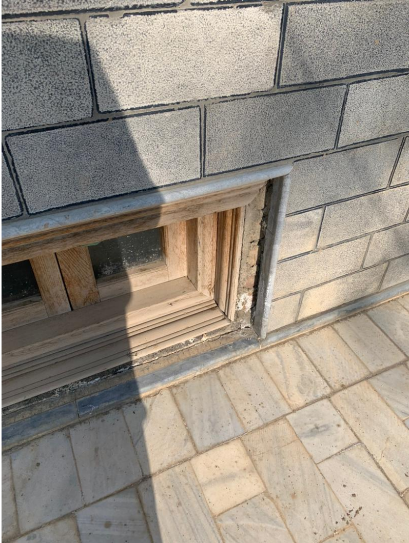
تصویری از نیمه کاری کلکین