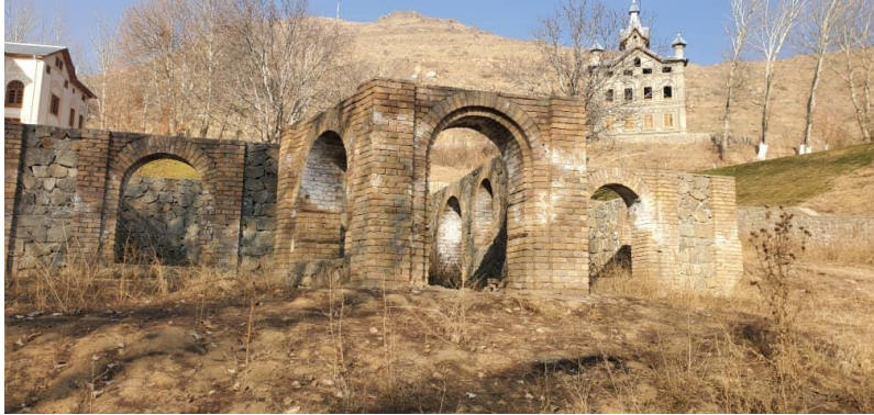
تصویری از جریان کار باز سازی بالا باغ پغمان