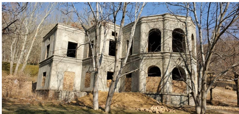
تصویری از جریان کار باز سازی بالا باغ پغمان

..... این امر باعث آن شده تا کارهای تزیینی غیر ضروری و یا هم با کیفیت پایین در رویکار ساختمان ها انجام و در انتخاب رنگ و قسمت برجستگی و فرورفتگی آن کار غیر معماری تخیلی انجام و از زیبایی آن کاسته شود.