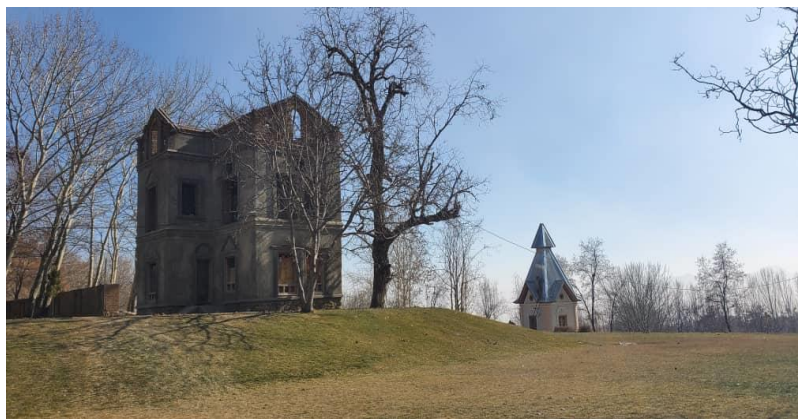
تصویری از قصر تاجدار در بالاباغ پغمان

با گذشت بیش یک ساعت از شروع آتش سوزی تیم آتش نشانی به محل نرسیده و مردم تلاش می کنند آتش سوزی را مهار کنند. این شهروند گفت که این بنای تاریخی به طور کامل در آتش سوخت. « (۴)