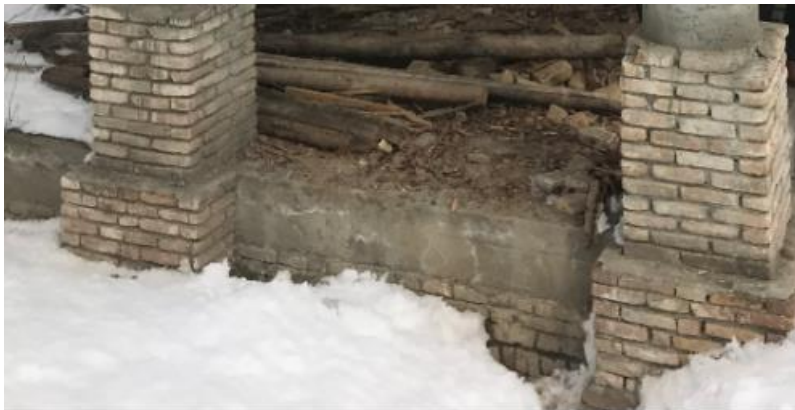
تصویری از چوب تره مستطیلی واقع بالا باغ پغمان