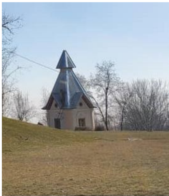
تصویری از قصر تاجدار در بالاباغ پغمان