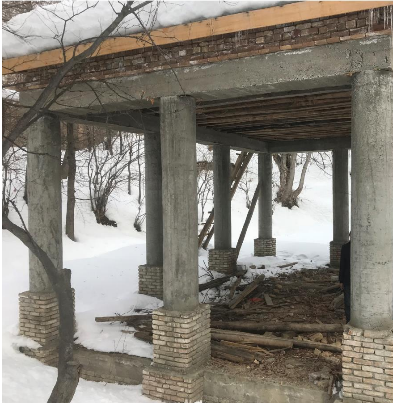
تصویری از چوب تره مستطیلی واقع بالا باغ پغمان