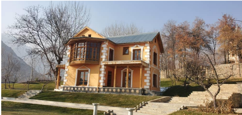
تصویری از پایان کار باز سازی بالا باغ پغمان