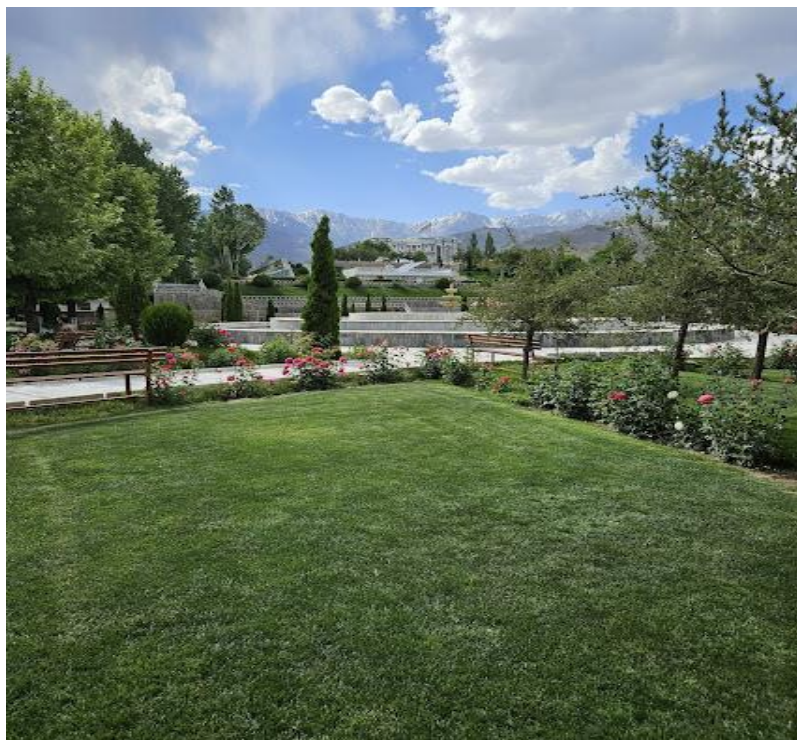
تصویری از تپه بالا باغ پغمان (پیش من کمتر بگو افسانه پاریس را زین جهان بی وفا گلگشت پغمانم بس است)

..... که در اطراف تپهٔ پغمان موقعیت دارند به طور عمده ساحاتی می باشند که فقط گردشگران همراه با فامیل شان اجازهٔ بازدید و سیاحت را به طور نادر دارند و هر شخصی در آن مناطق این اجازه را ندارند.