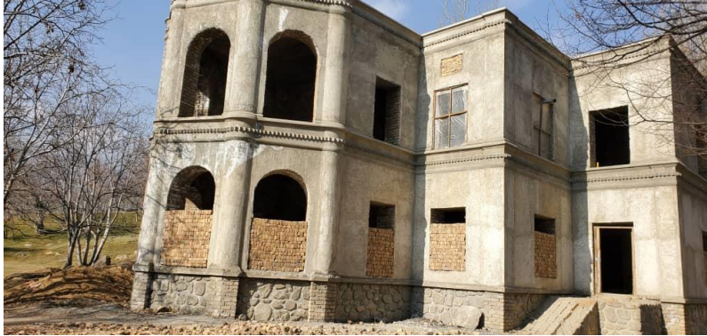
تصویری از جریان کار باز سازی بالا باغ پغمان