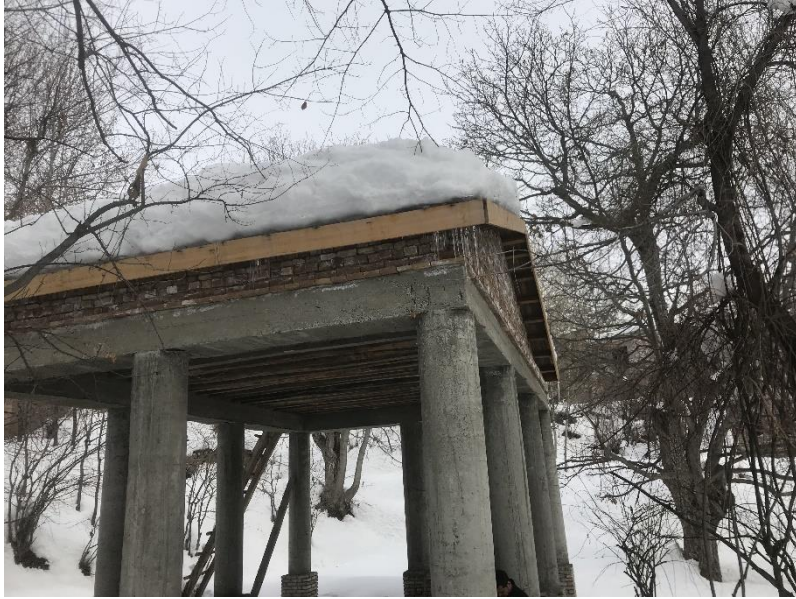
تصویری از چوب تره مستطیلی واقع بالا باغ پغمان