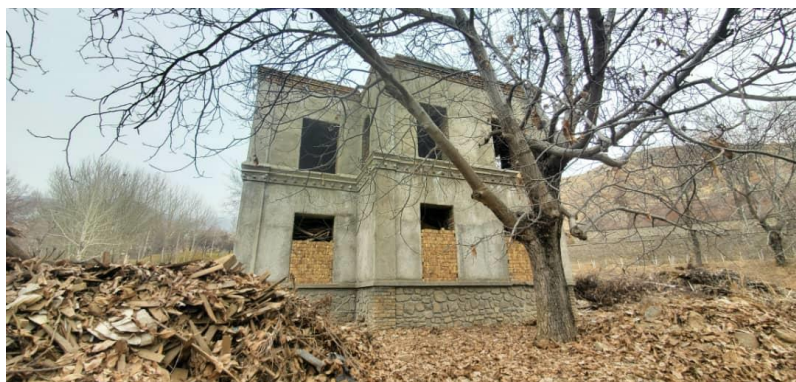
تصویری از جریان کار باز سازی بالا باغ پغمان