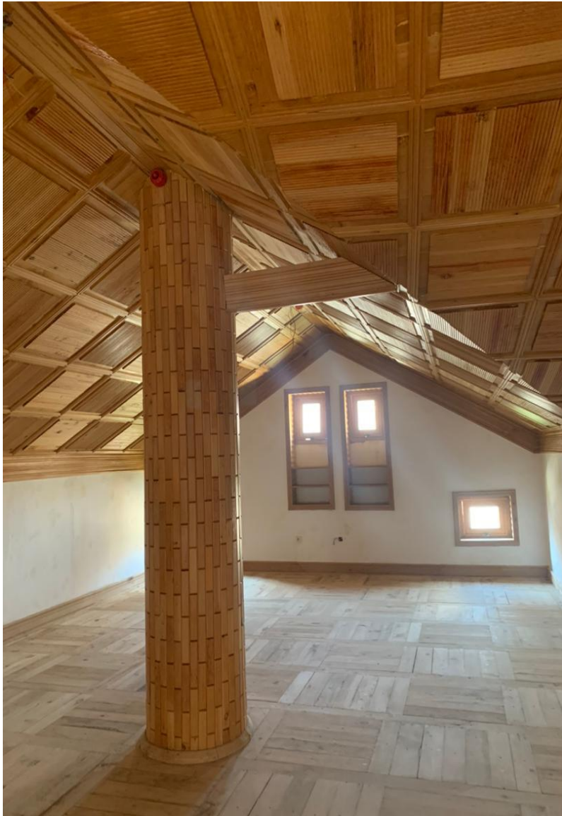
تصویری از ساختمان داخلی حمام و تشناب