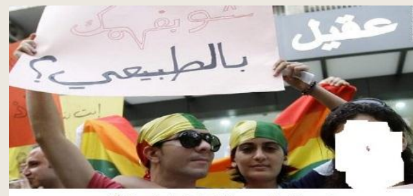
عربی متعلمین او محصلین او د همجنسبازي همظاهري