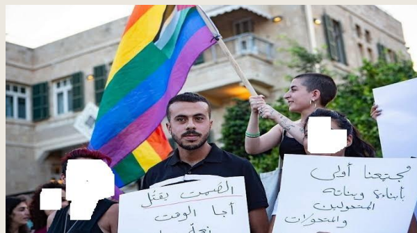
عربی محصلین او متعلمین او د همجنسبازي د حقوقو مظاهره