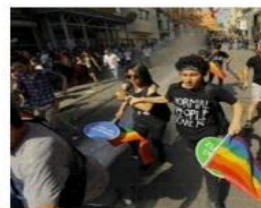
Turkey Has No Excuse to Ban Istan... hrw.org