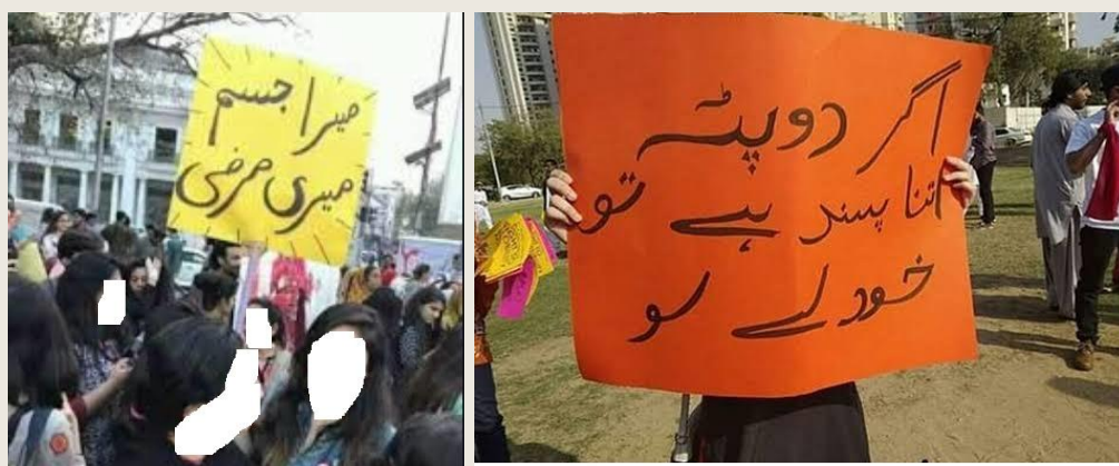
پاکستاني متعلميني انجوني د حجاب ضد مظاهره

کہ کوم چا د حجاب په ضد مظاهري کړي هغه به حتماً د کوم پوهنتون يا مکتب متعلمه يا محصله وي، لاندې تصويرونه د مثال په ډول وگورئ.