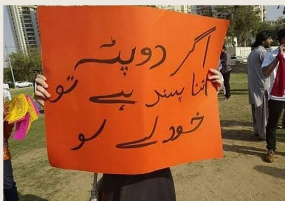
پاکستاني متعلميني انجوني د حجاب ضد مظاهره