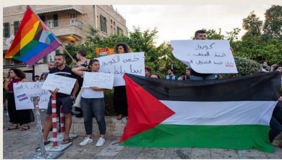
د فلسطین په وطنی او سیکولر نظام کی متعلمین او محصلین او د همجنسبازي مظاهري