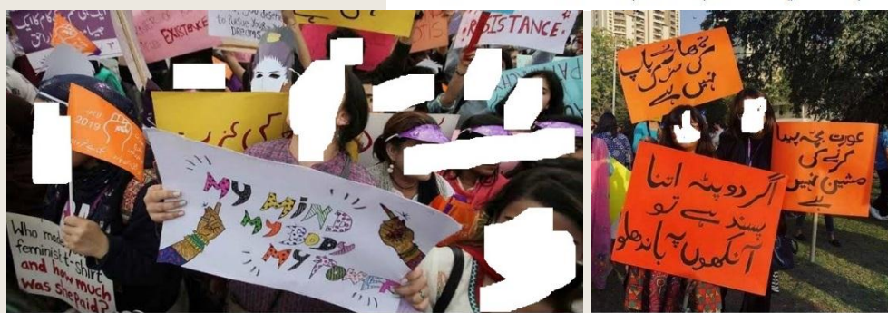
پاکستاني محصليني د حجاب ضد مظاهره

نو په پورته ډول سیکولر تعلیم په اسلامي امت کې د سیکولر ټولنيز او کفري ژوند لپاره متضمن گرځېدلی چې مونږ يې له شر څخه الله سبحانه و تعالی ته پناه وړو، پدې تعلیم کې د سیکولر ټولنيز ژوند نور اړخونه هم لکه سیکولر آزادیاڼې، کفري