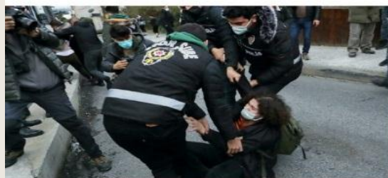
A woman scuffles with police officers as she waits in front of the Bogazici University in solidarity with students inside the campus who are protesting against the new rector and the arrest of two students, in Istanbul, Turkey February 1, 2021.