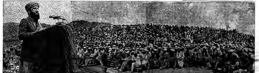
پاړني هم دروغ پرانگي را ديفرېسي - مېي - مېي - د ستگانگ لېباني غرب د مورد قضايبی افغانستان افشاني گروډ... (Caption text)

مطلوبترین و محرومترین طبقه کشور ما را تشکیل میدادند... هدف همت ملت ما حکومت اسلامی است... (Main article text)