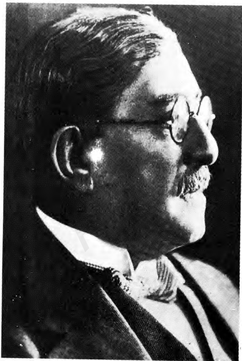
محمود طرزي عكس د افغانستان د ژورناليزم پلار د وري لمري نيټه ۱۲۴۳ - د ليندۍ دوهمه ۱۳۱۲ ش ۱۸۸۴ اگست ۲۳ - ۱۹۲۳ د نومبر ۲۲ م