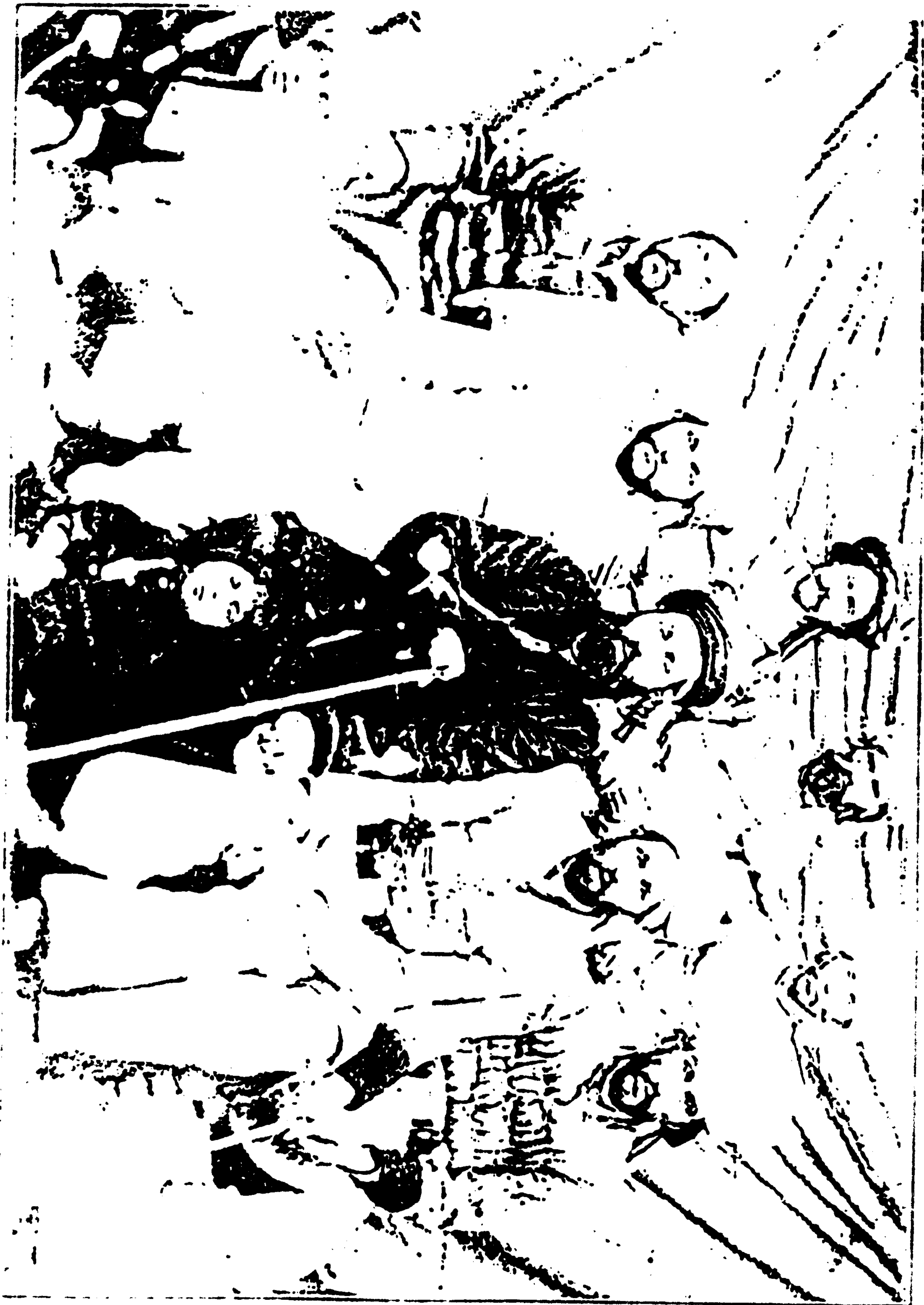
د کابل میزبانانو پوره