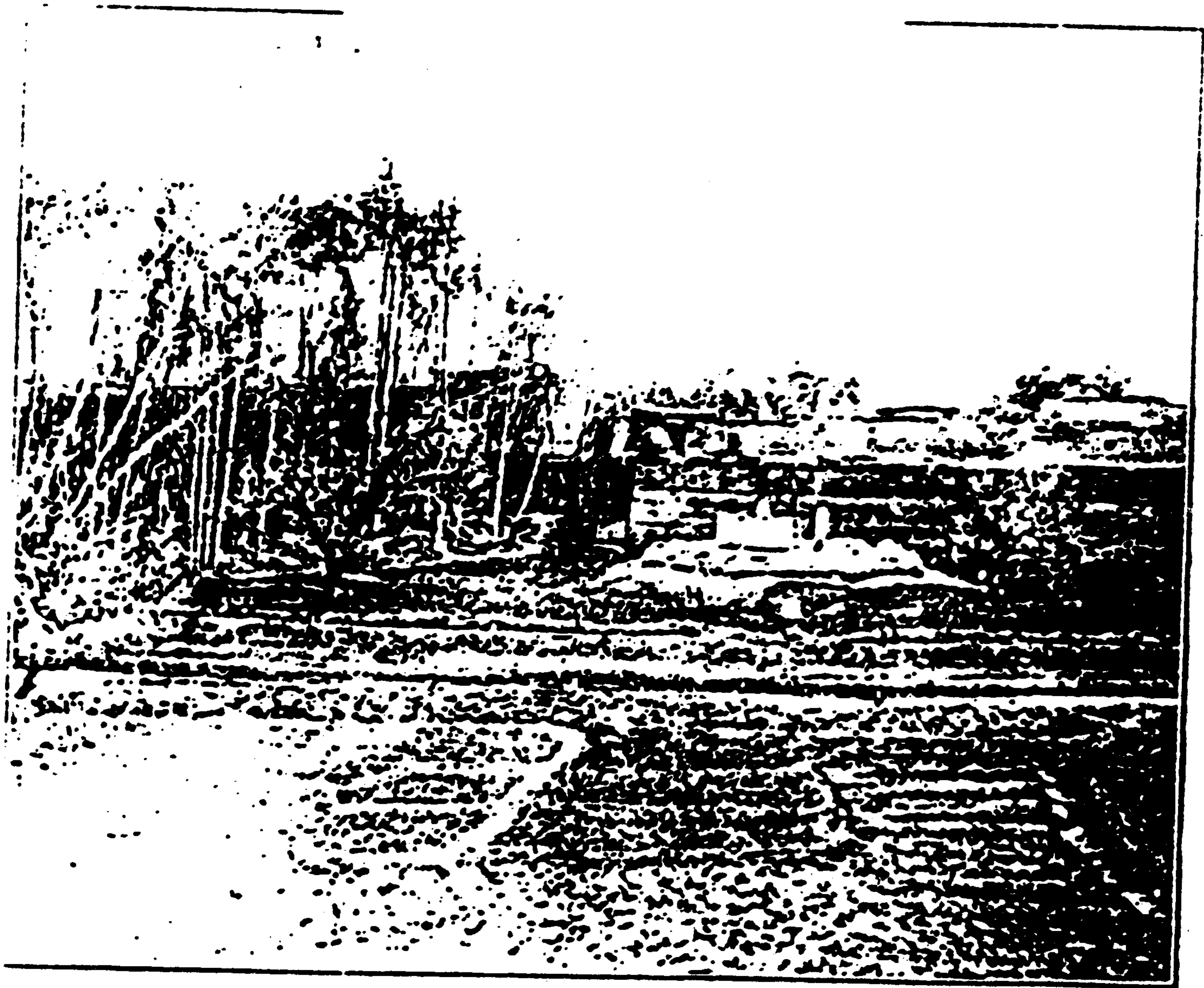
د مولف استورکنځي ته څرمه باغچه - د باغچې په کونج کې زیارت