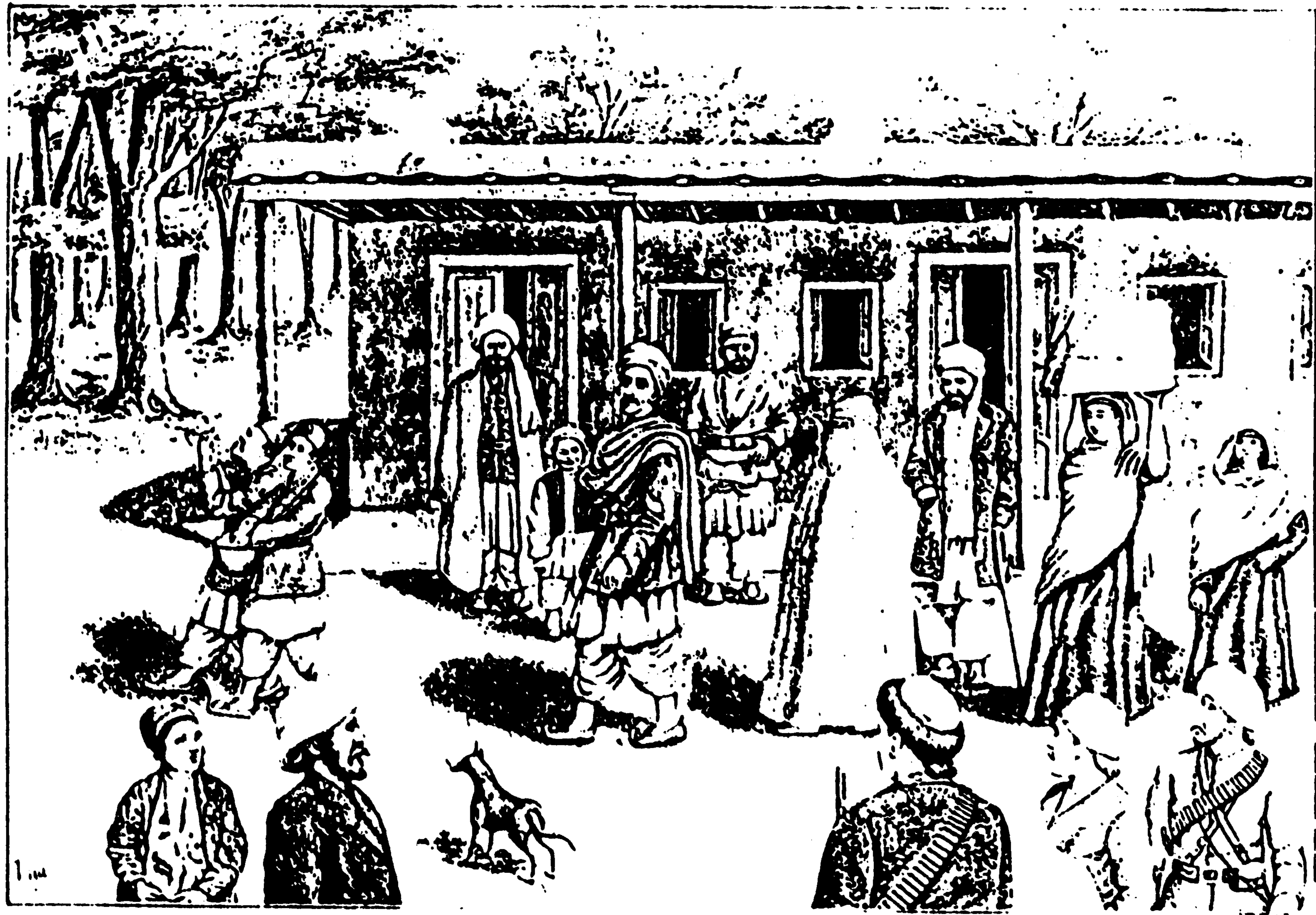
دغریبانو د واده مراسم - زوم او ناوې - ترشایې نجلۍ دناوې جامې پسي وړي (دمولف رسامي)