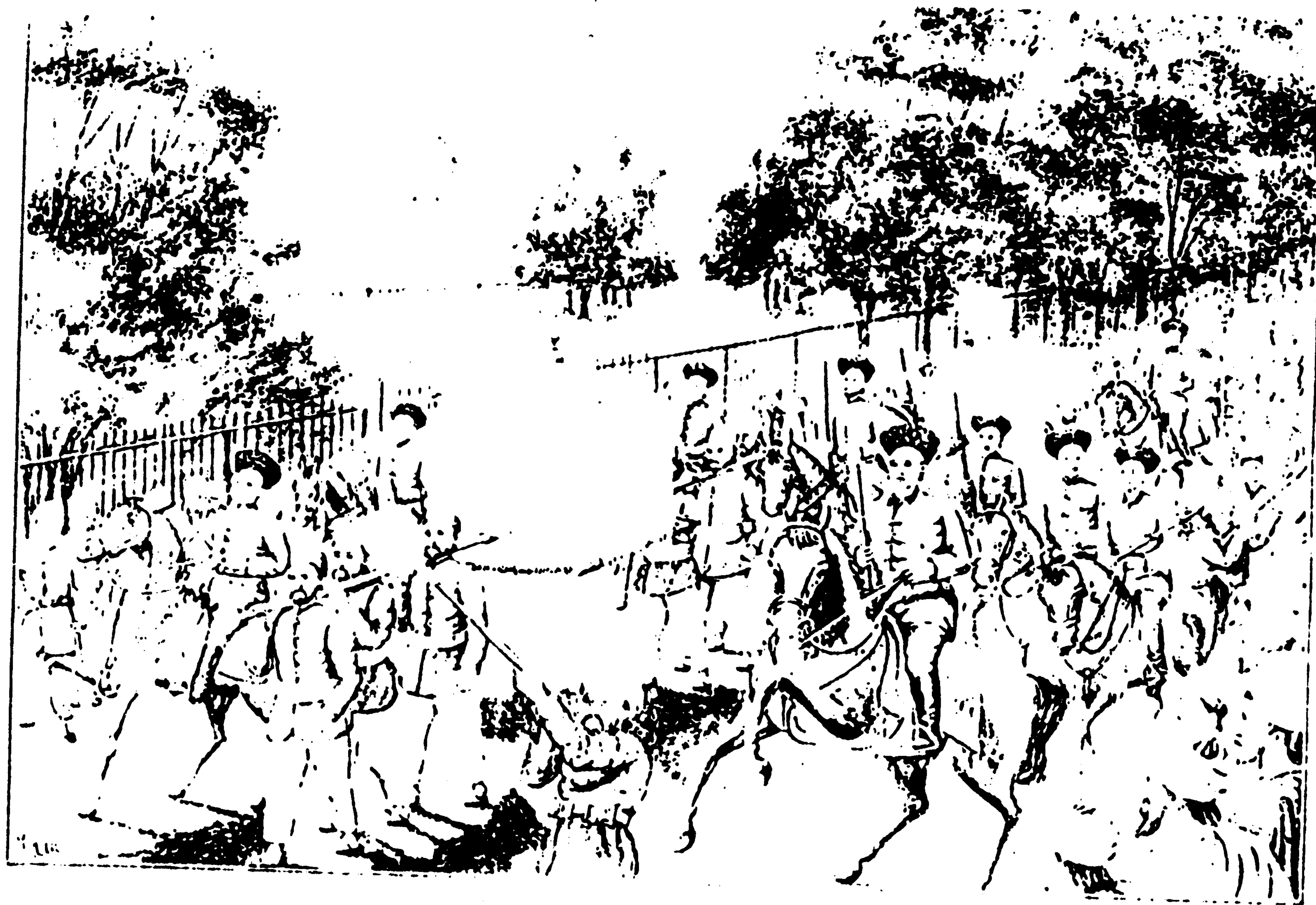
د بډايانرد واده مراسم - ناوې په ډولۍ کې ( دمولف رسامي )