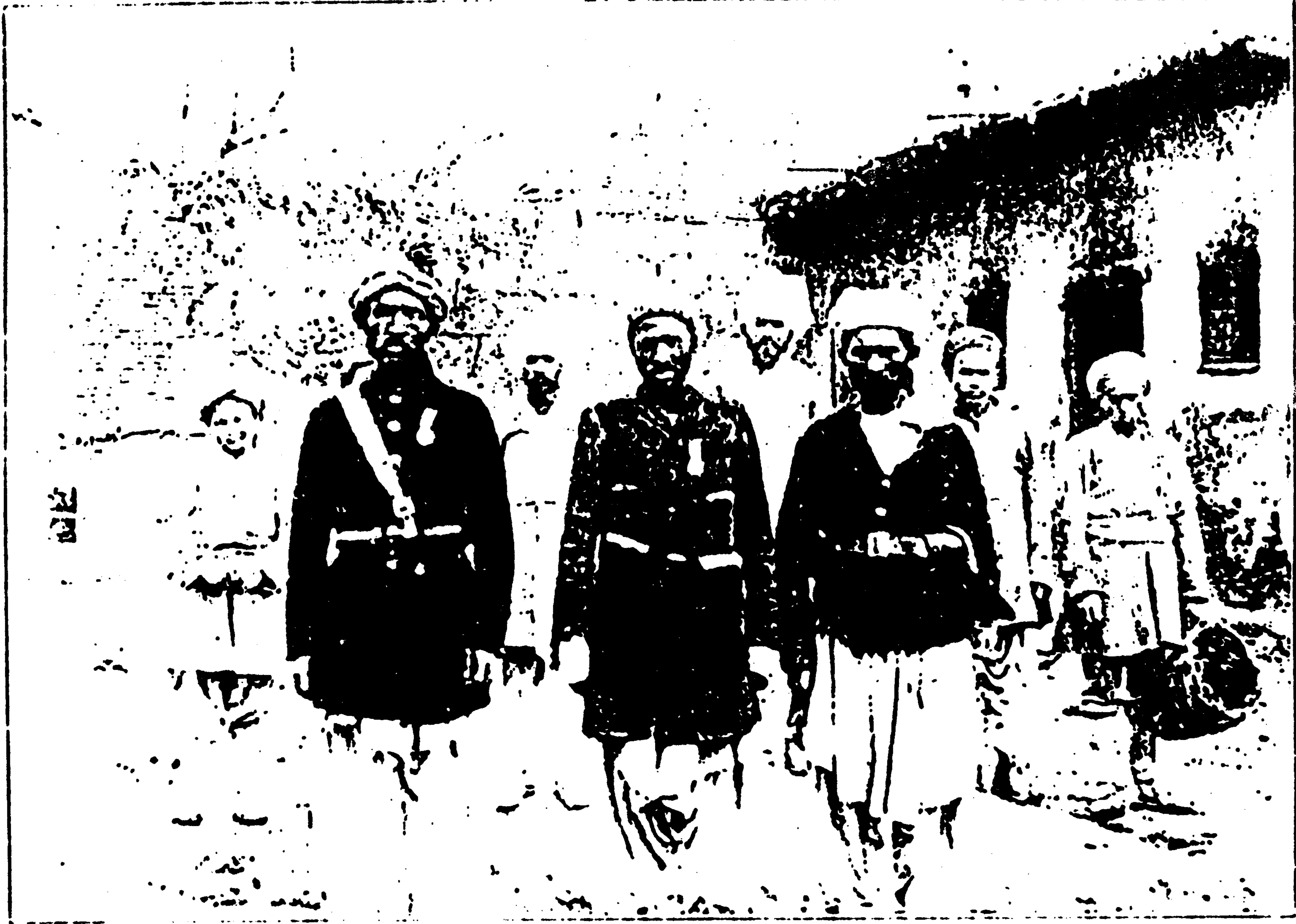
د مولف په کورکي دافغاني ساتونکو او نوکرانودله - پخلنځی یې شاته دی