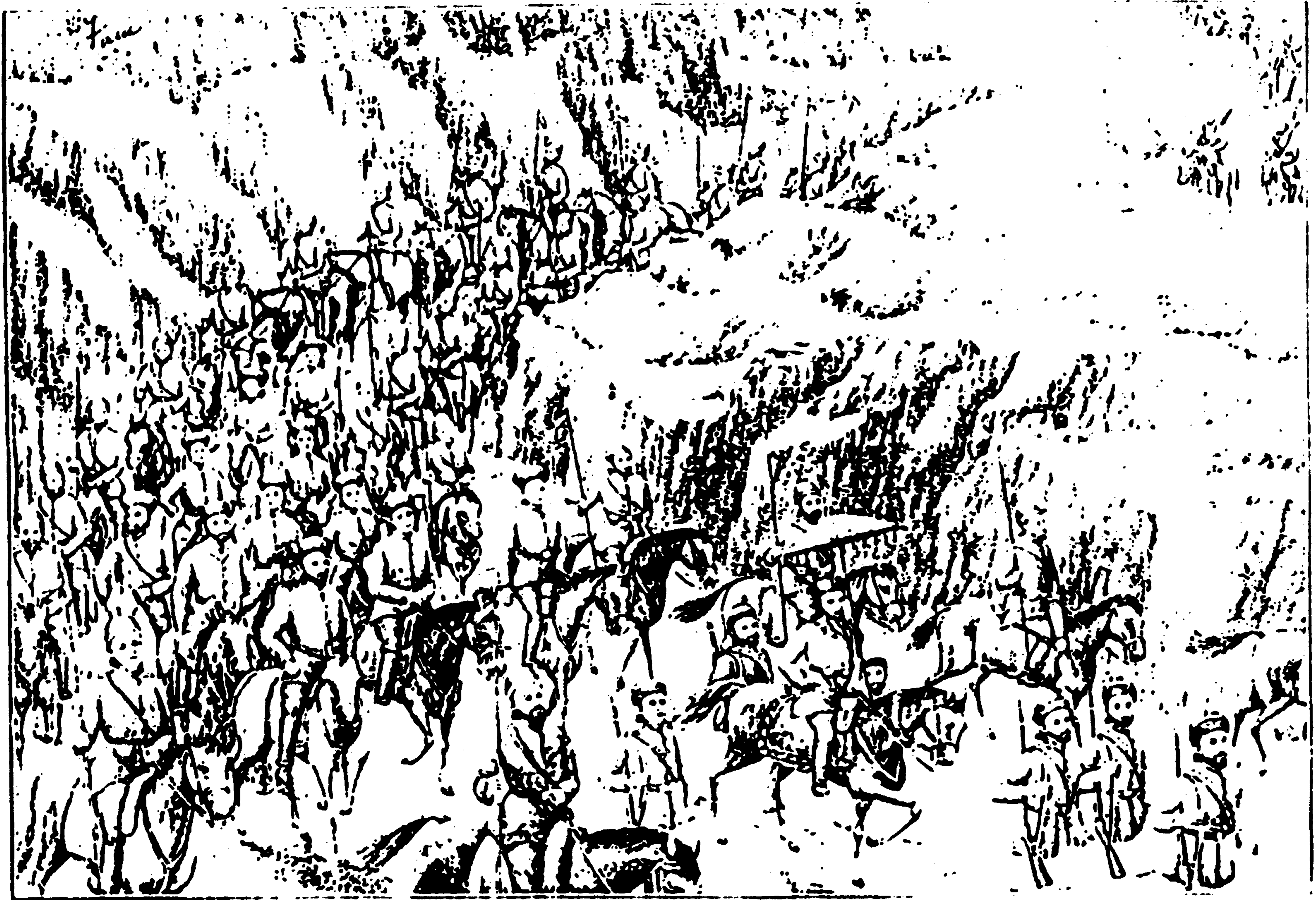
شہزادہ لہ کندهاره کابل ته دتللو په حال کي ( دمولف رسامي )