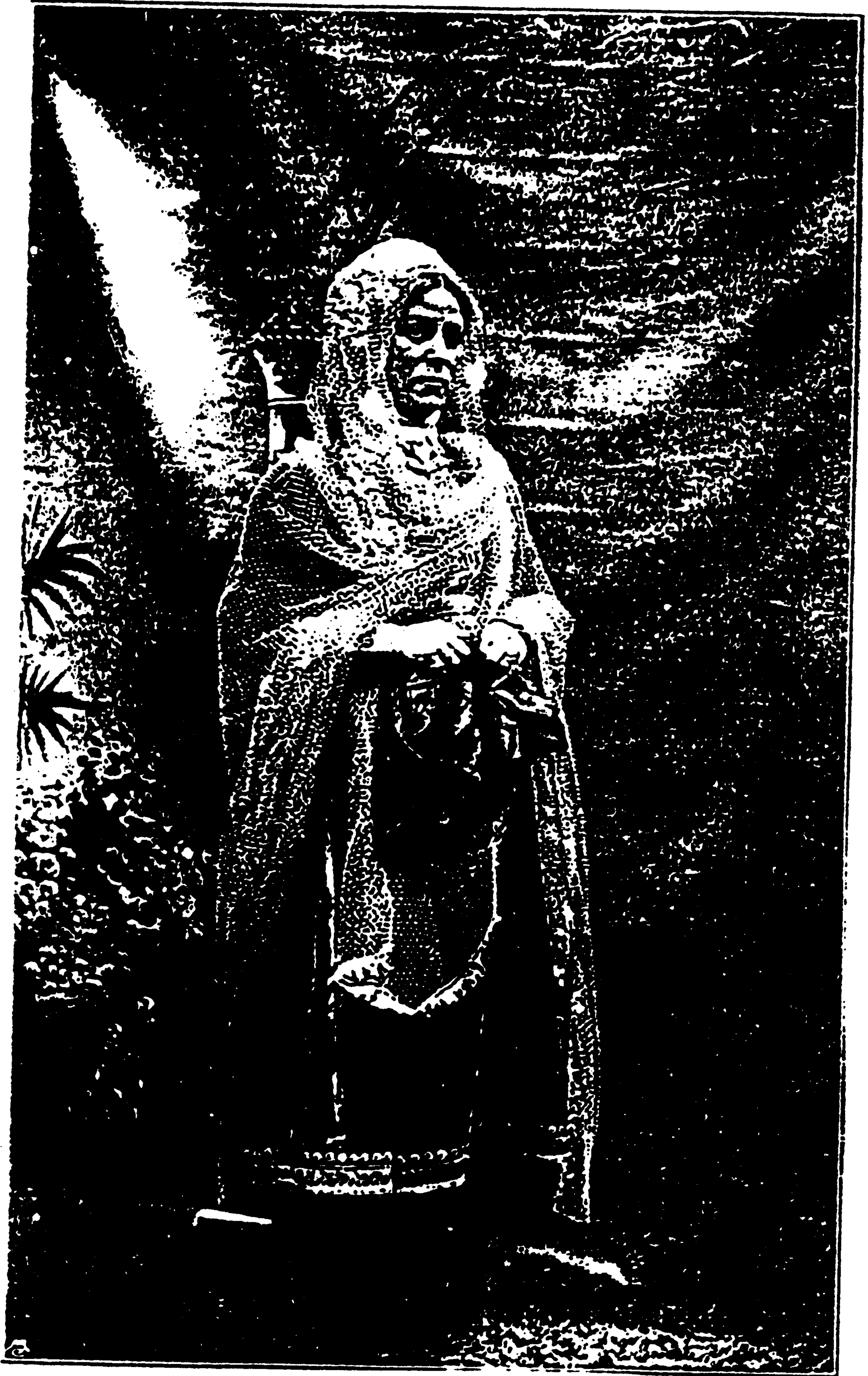
د کابلې ښخې جامې