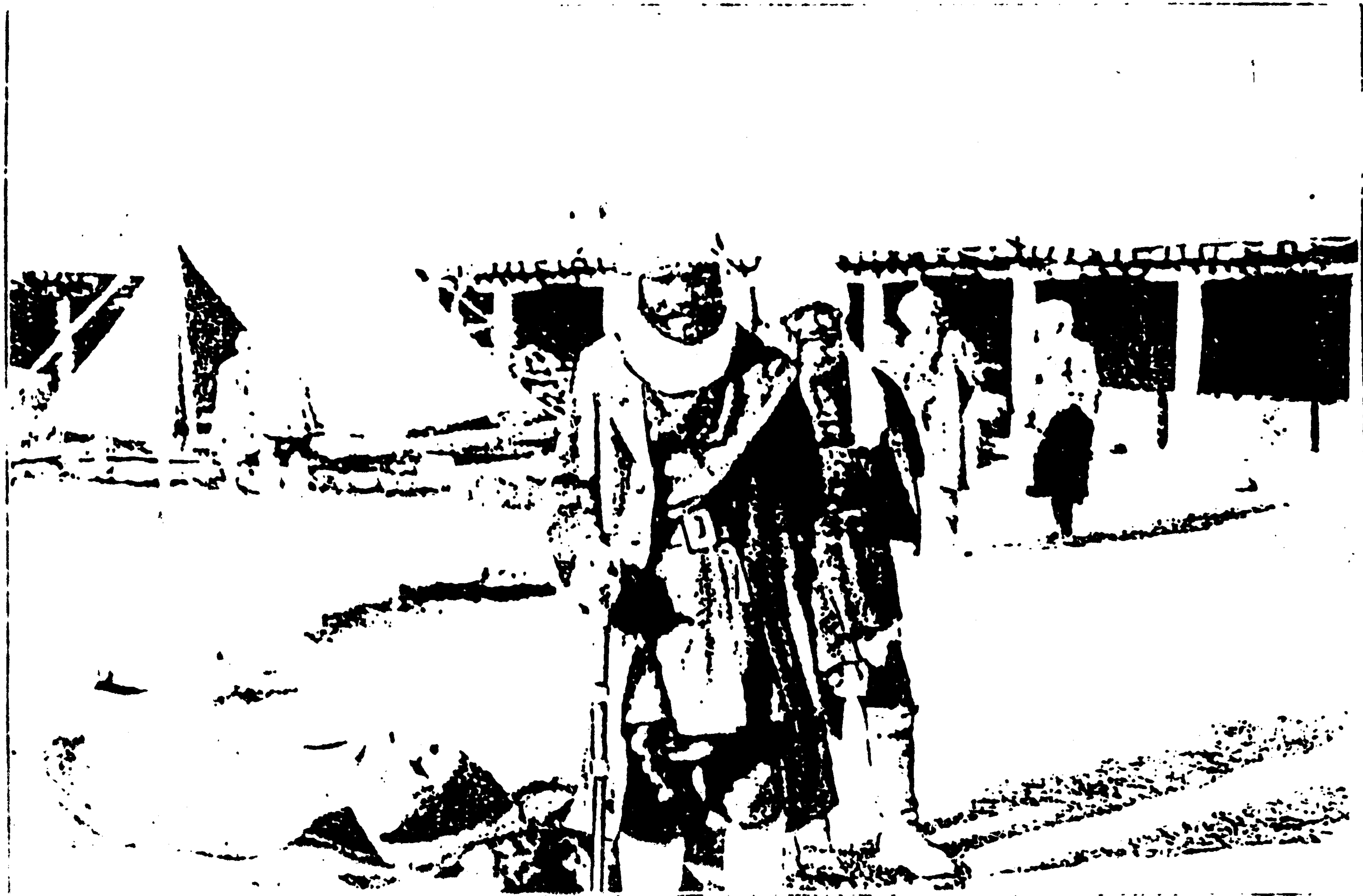
د کابل او پېښور پر لار کاروانسرای