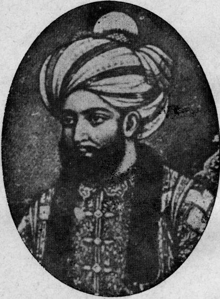
اعلیٰ حضرت لوی احمد شاہ بابا