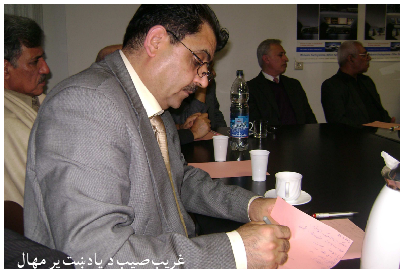
غريب صيب د يادښت پر مهال

نړيوال سازمانونه په افغانستان کې خپل دفترونه او نمايندگۍ لري، خو په دې برخه کې هم نيمگړتيا داده، چې د افغانستان سياسي نمايندگۍ لاهم د يوه تنظيم په لاس کې دي او د افغانستان د ملي گټو بنسټکارندويي نه شي کولای. سربېره پر دې يو شمېر نړيوال سازمانونه د افغانستان د ملي گټو پر خيال نه ساتي او همدا راز د گاونډيو هېوادونو پر وړاندې د افغانستان بهرنی سياست غښتلی نه دی.