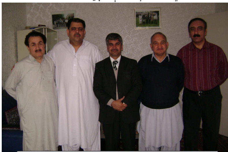
شور صیب، مجبور صیب، یون، غریب صیب او یار صیب

دې کاواکې سولې ته زیان رسي، تر څو چې سوله په طبیعي ډول د عدالت پر بنسټ رامنځته نه شي، دا ډول سولې دایمي اساس نه لري. ما په دې بحث کې په افغانستان کې شوي پرمختګونه او راتلونکي احتمالي ګواښونه څومره، چې زما ذهن کار کاوه تشریح کړل، دا بحث ډېر اوږد شو او د شپې تر ناوخته روان و. لږ چې فرصت برابر شو، نو ګران ورور عبدالله احسان راغی او ویې ویل استاده! اوس نوزه غواړم تاسو سره یوه ځانګړې مرکه وکړم، زما هیله ده ځینې معلومات ځان سره خوندي کړم، ازاد بحث خو هسې هم د هوا خپو ته ځي او څه ترې نه پاتې کېږي.