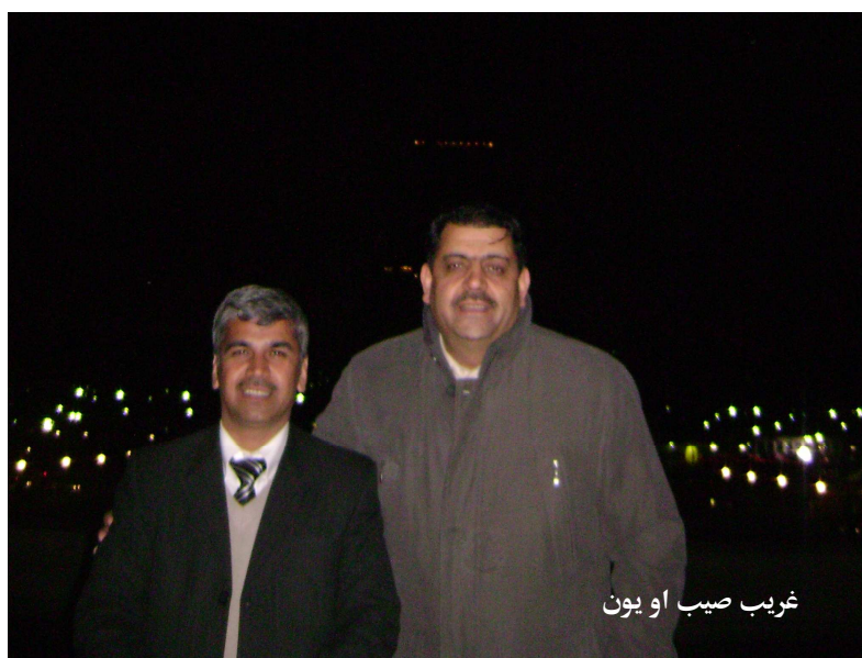
غريب صيب او يون

پنځه دقيقې منزل به مو کړی و، چې د بنار منځ واټ ته ورسېدو، دا د پاریس بنار منځ دی، چې له دې ځايه د بنار اکثره ودانۍ بنکاري او بنه د سيل ځای دی. فيصل وويل: د دوی لويې