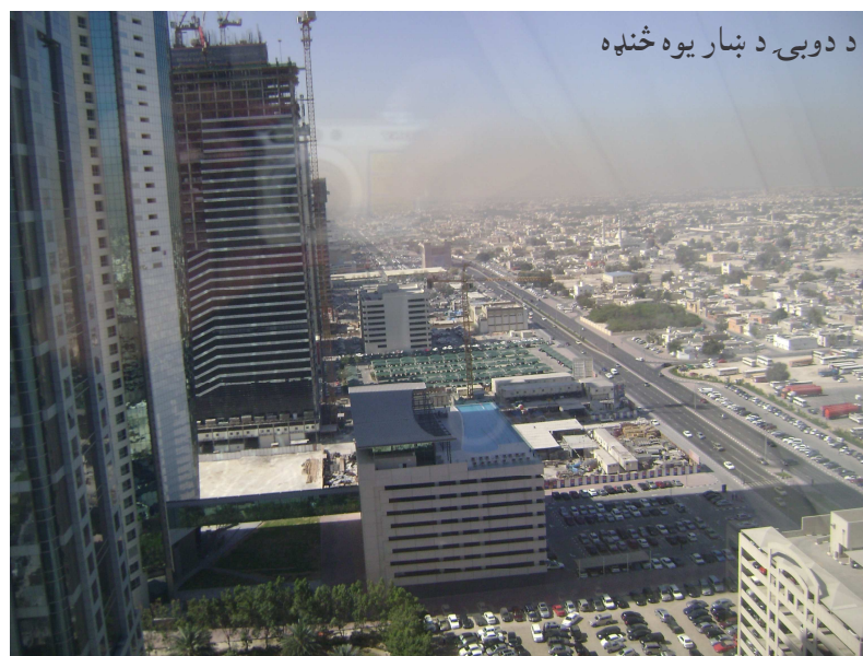
د دوبي د بنار يوه څنډه