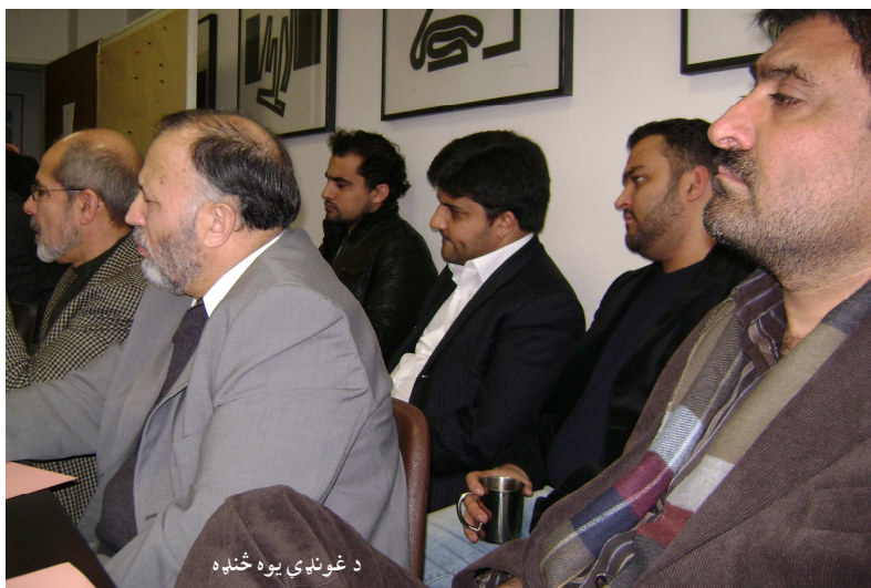
د غونډې يوه څڼه

ډاکټر صيب حرکت وويل: دا سمه ده، چې افغانستان کې يو شمېر مثبت کارونه ترسره شوي، خو دا کارونه د هغو په تناسب ډېر کم دي، چې بايد شوي وای. د حرکت صيب په نظر حکومت په دې کې پاتې راغلی، چې له دې طلايي چانس څخه گټه پورته کړي. حرکت صيب زياته کړه زموږ ملي ارزښتونه د بهرنيو قوتونو له گټو سره سر نه خوري.