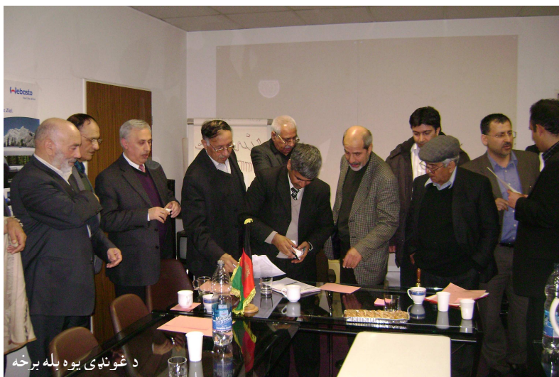
د غونډې یوه بله برخه

❖ د جمهوري ریاست او ملي شورا ټاکنې تر سره شوې، دا ټاکنې هم د ولسواکۍ د تمثیل یوه بڼه بېلگه وه، چې خلک دې په خپله خوښه خپل استازي وټاکي، خو دې سره سره په دواړو ټاکنو کې یو لړ نیمګړتیاوې وې. په تېره بیا په پارلماني ټاکنو کې، پر درغلی سربرېره (۳۱۵) هغو جنګسالزانو او جنایتکارانو ته په ټاکنو کې د کاندیدۍ حق ورکړ شو، چې تر دې دمخه په تور لست کې شامل وو. تر انتخاباتو وروسته د دوی یو زیات شمېر د «مشروعیت» تر پردې تېر شول او اوس ان په ملي شورا کې د خلکو پر برخلیک لوبې کوي.