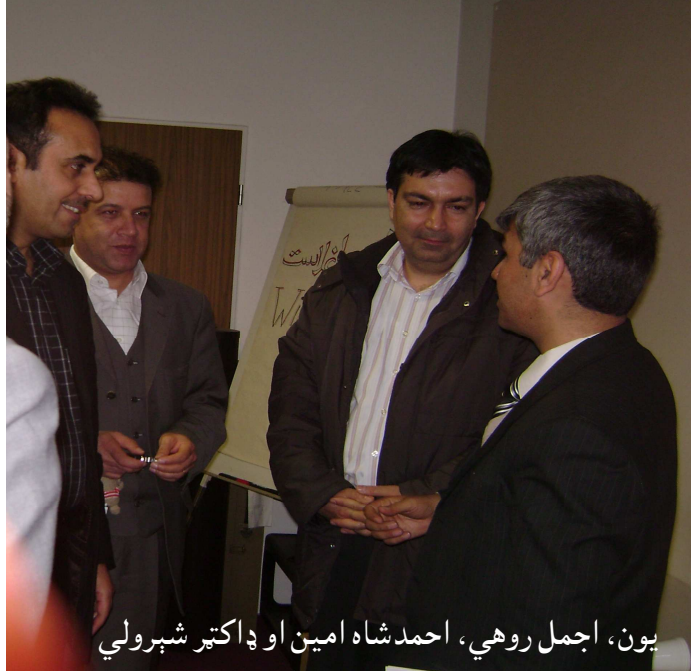
يون، اجمل روهي، احمد شاه امين او ډاکټر شېرولي

❖ د سوداګرۍ او پانګه اچونې په برخه کې هم په زړه پورې پرمختګ شوی، په زرګونو خصوصي او نړيوالو شرکتونو په افغانستان کې پانګه اچولې، يوازې د خصوصي سکتورونو پانګونه تر (۵) مليارډو ډالرو پورته کېږي، له پاکستان سره تجارت په کال کې له پنځوس ملیونو ډالرو څخه (۲، ۱) بليونو ډالرو ته پورته شوی، امریکا سره له نشت څخه (۳۲۰) ملیونو ډالرو ته لوړ شوی دی. همدارنګه نورو هېوادونو سره د افغانستان صادراتي او وارداتي روابط زيات شوي دي. ❖ د صحت برخې ته هم پاملرنه شوې، لږ تر لږه په هره ولسوالۍ کې يو کلنيک جوړ شوی، (۲۲) لوی روغتونونه جوړ شوي، (۱۲۰) شخصي کلنيکونه او (۱۴) سيار کلنيکونه جوړ شوي دي.