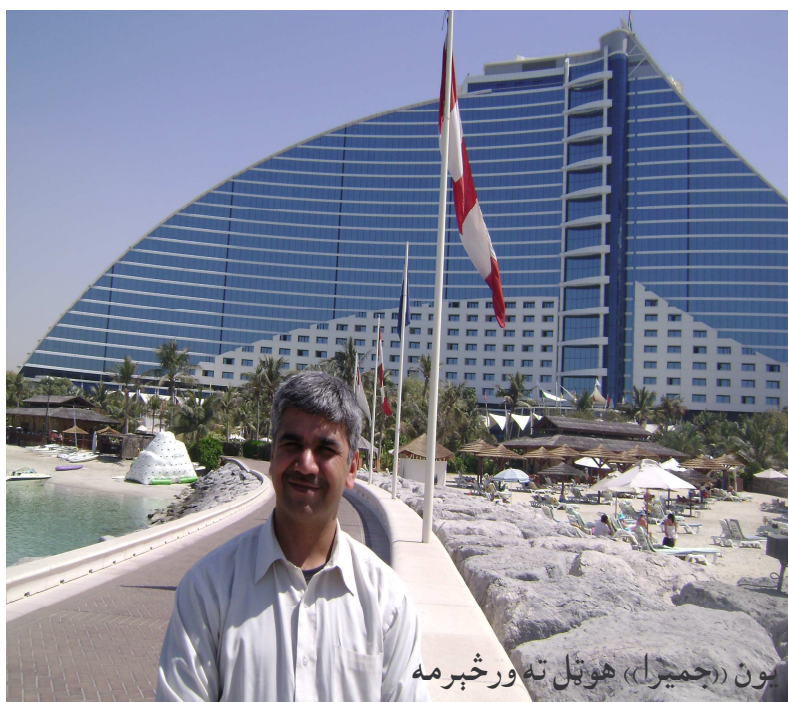
بون «جميرا» هوتېل ته ورځېرمه