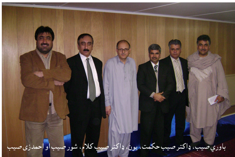
باوري صيب، ډاکتر صيب حکمت، يون، ډاکتر صيب کلام، شور صيب او احمدزی صيب

دا «غریبان» خو ما خو ځله له «میدانه» ځغلولي، غریب صیب بیا وویل: ته یې مني؟ دې کې بیا ټولو وخنډل، تنگ صیب بیا یوه