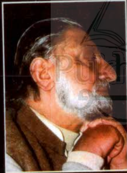
ترجمہ: قلندر مومند