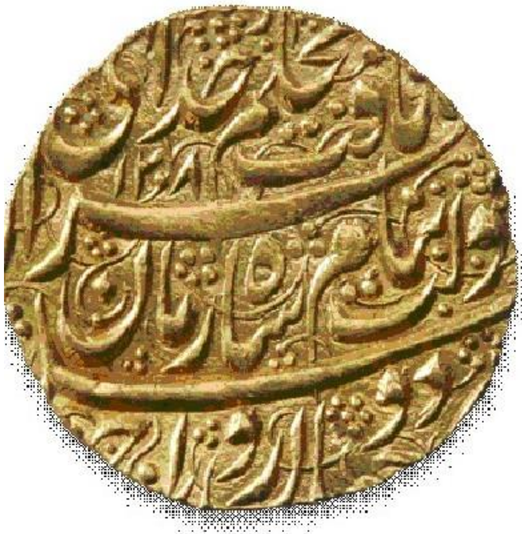
د شاه زمان سکه