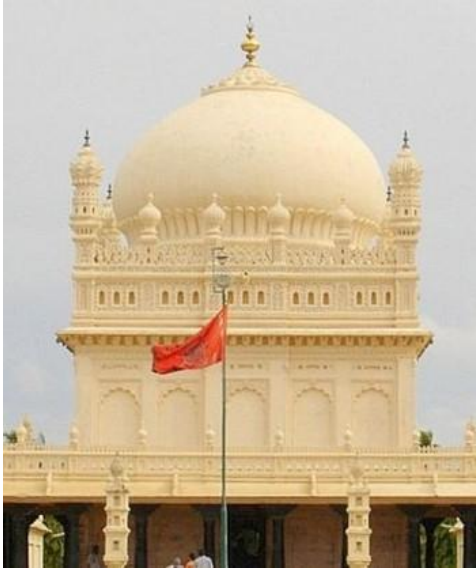
د نیو مقبره