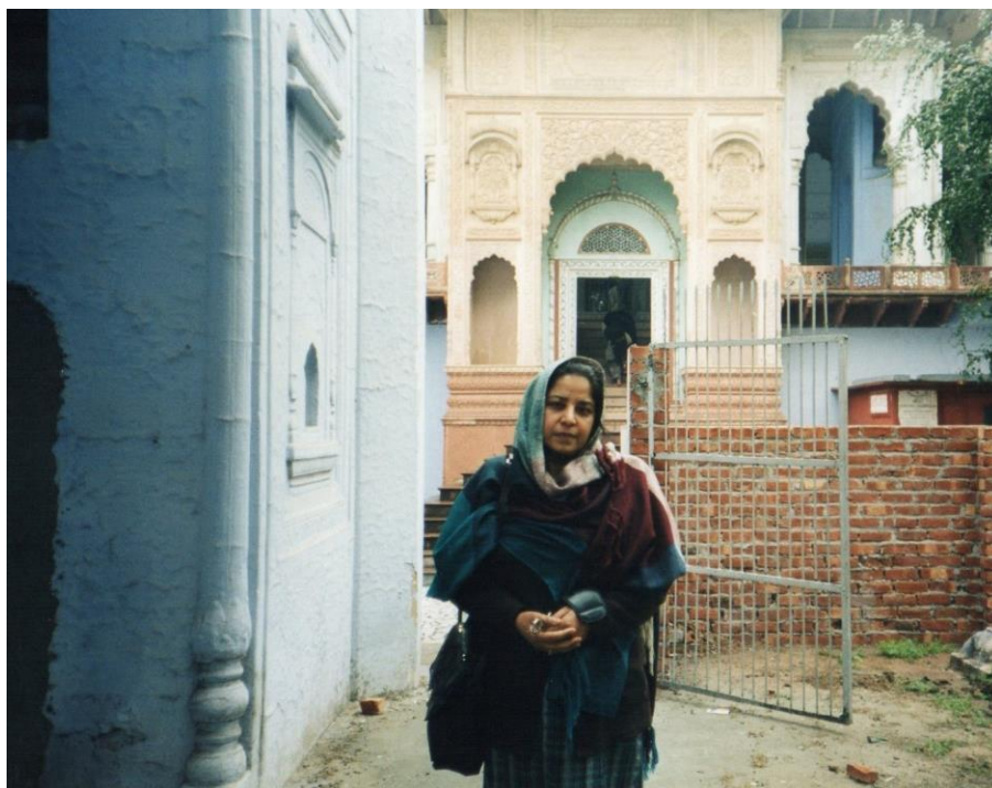
ليکواله په سر هند کې د شاه زمان مقبرې سره

کوو، هغه چې د هند خاوري ته يې خو واري تکل وکړو، اخر هم دلته خاوري شو.