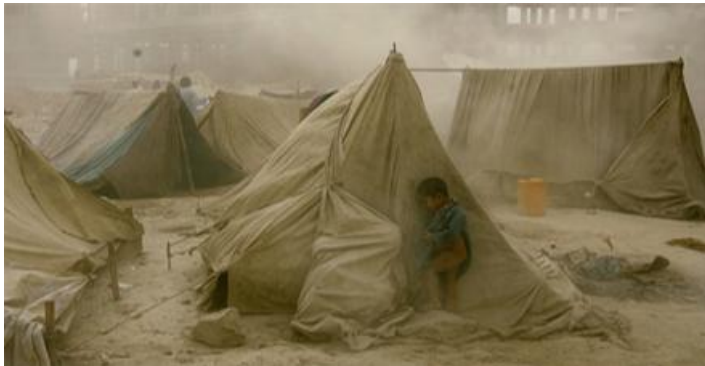
Fig 11: Afghaans vluchtelingenkamp in de hoofdstad Kabul

President Barak Hussain Obama neemt vergelijkbare beslissingen om meer militaire eenheden naar Afghanistan te sturen wat geen vrede of veiligheid tot stand kan brengen. Hiermee heeft hij bewezen dat hij tegen een vreedzame oplossing van het Afghaans probleem is. Er wordt gedacht dat Barak Hussain Obama ten onrechte de Nobelprijs voor de Vrede heeft gekregen wat een vernederend fenomeen voor de Nobelprijs-organisatie is.