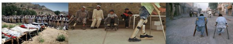
Fig. 5: Slachtoffer van niet geëxplodeerd wapenarsenaal

een ander onderzoek van de VN in Bosnië en in Cambodja blijkt dat 40-50% mijnslachtoffers sterven aan hun verwondingen. Maar door blinde bombardementen van Amerikanen en het verspreiden van clusterbomen zijn er in de laatste jaren meer dan 200.000 mensen overleden en na het plat bombarderen van de zuidelijke provincies met uranium-houdende bommen is er een duidelijke stijging van aangeboren afwijkingen bij Afghaanse kinderen.