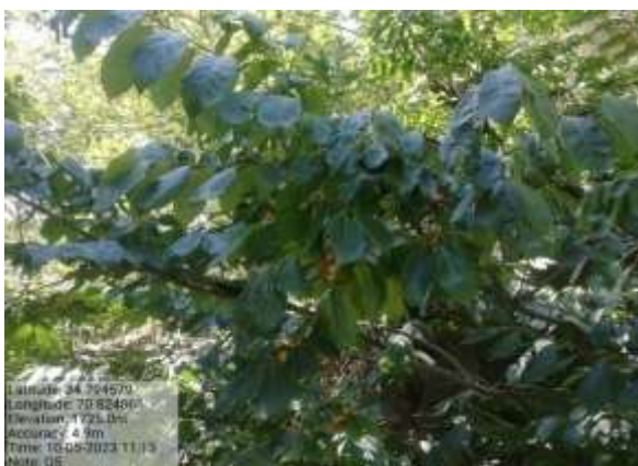
شکل (۸) : د الوچې ښودنه کوي