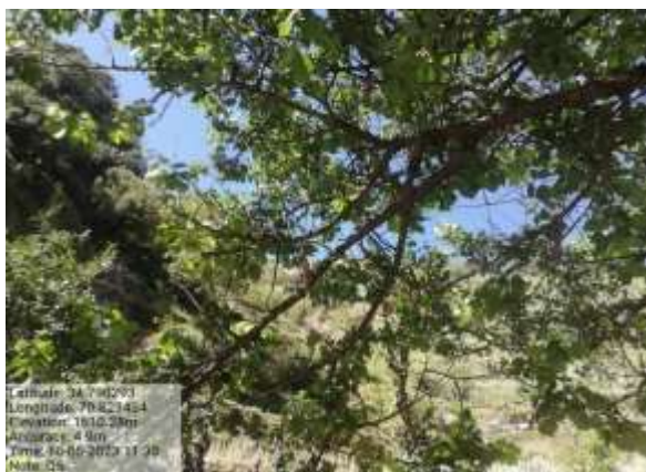
شکل (۱۰) : د تور املوک ښودنه کوي