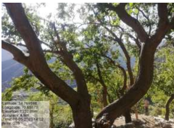
شکل (۱۲) : د توت ښودنه کوي