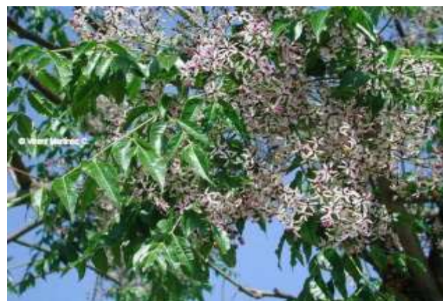
شکل (۱۶) : د بکیانې بنودنه کوي