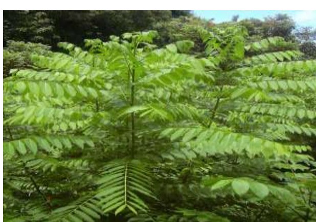
شکل (۱۵) : د شنې بنودنه کوي