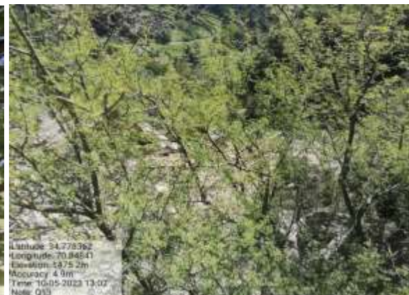
شکل (۹) : د پلوڅې ښودنه کوي