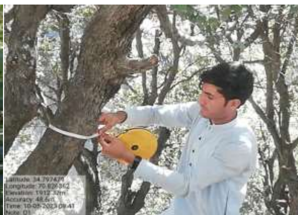
شکل (۷) : د قطر د اندازه کولو ښودنه کوي