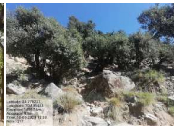
شکل (۱۱) : د څپړۍ ښودنه کوي