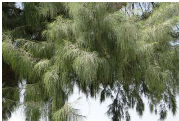
شکل (۱۳) : د غز بنودنه کوي