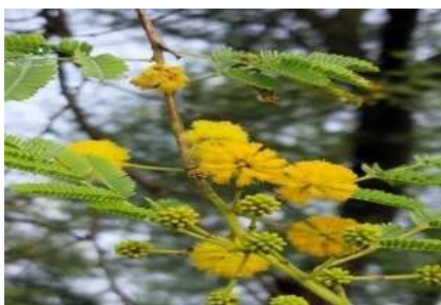
شکل (۱۷) : د کیکر بنودنه کوي