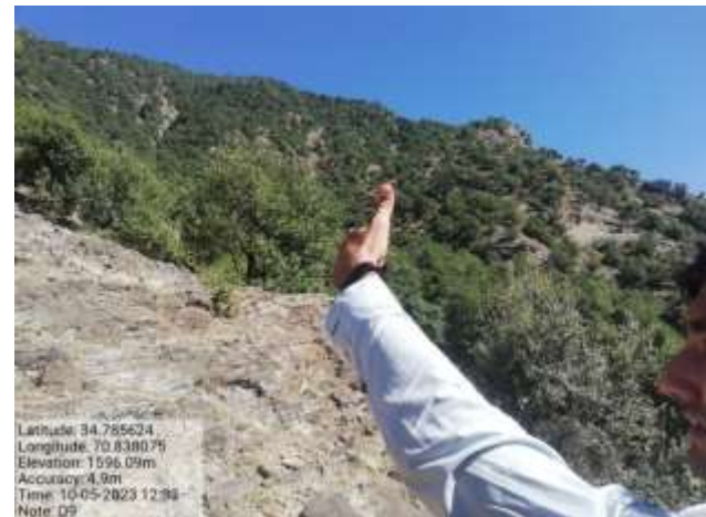
شکل (۲۳): د ونې د ارتفاع د اندازه کولو بنودنه