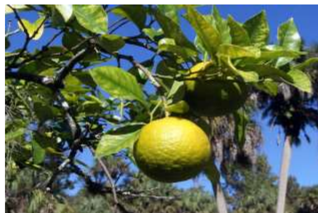
شکل (۱۸) : د نارنج بنودنه کوي