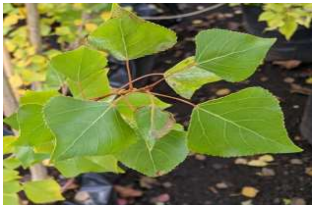
شکل (۱۴) : د سفیدار بنودنه کوي