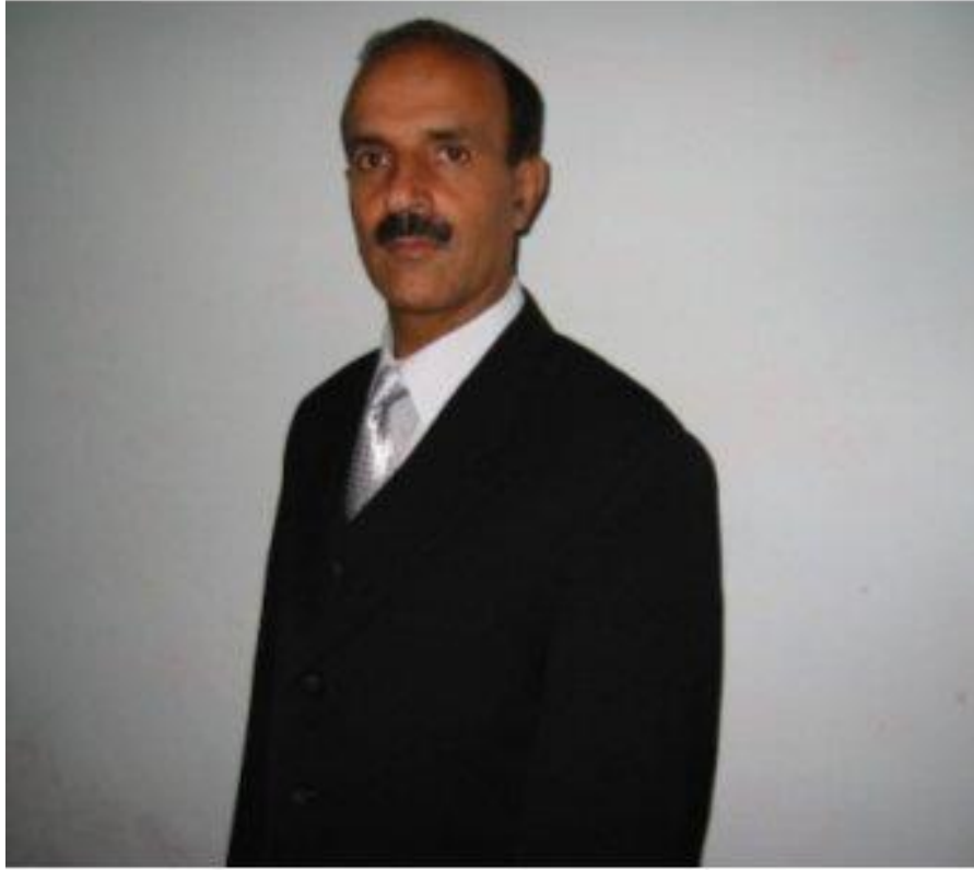
احمد شاه (پهلوی) دالاهي ارشاداتو مفسر دپښتنو د ادبي تاريخ سپاهي شاعر، ليکوال او نقد گير